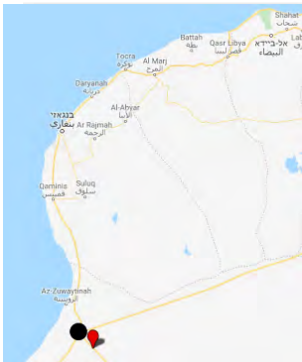
אזור אלקנאן בו הותקפה תחנת משטרה (מסומן באדום). מצפון מערב לו נמצאת אג'דאביא (מסומנת בשחור)