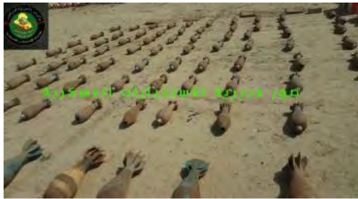
פצצות מרגמה בקוטר 120 מ"מ, שאותרו במקום מחבוא של דאעש מדרום למוצול