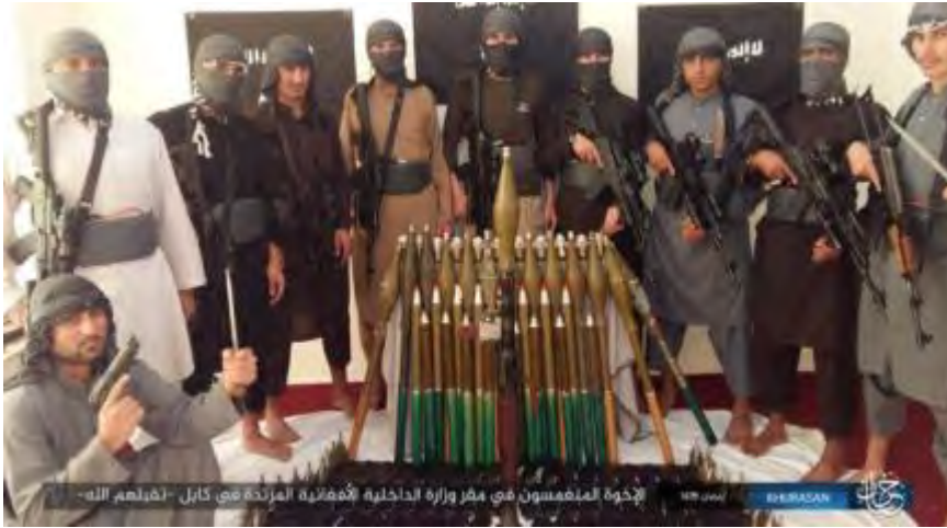
עשרה פעילי דאעש על רקע דגל דאעש, לפני היציאה לביצוע הפיגוע נגד מטה של משרד הפנים האפגאני (חק, 1 ביוני 2018)