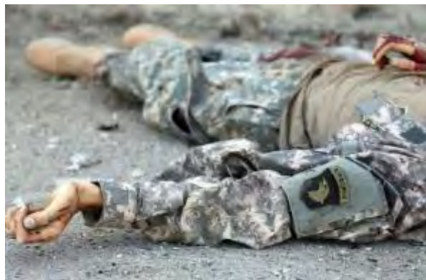
מימין: אחד מפעילי דאעש שנהרגו בתקיפה נגד מתחם משרד הפנים האפגאני, לובש מדים עליהם תג של דיביזיה 101 המוטסת של צבא ארה"ב (חק, 1 ביוני 2018). משמאל: סמל דיביזיה 101 בהגדלה.