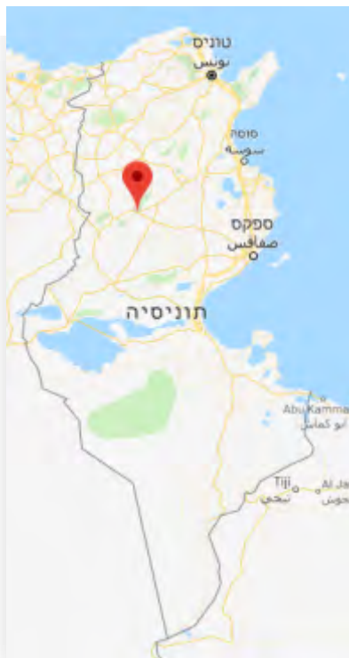
La zone de Sbeitla dans l'Est de la Tunisie, où le gazoduc a explosé

méditerranéenne (voir carte). L'explosion du pipeline a entraîné la perte de pétrole. Le champ comprend 19 puits de pétrole et est actif depuis 1969 (Bab Net, 2 juin 2018). Le 3 juin 2018, l'agence de presse Amaq de l'Etat islamique a annoncé que les membres de l'organisation avaient fait exploser un gazoduc transportant du gaz du champ pétrolifère Al-Dawlab à la ville de Sfax sur la côte méditerranéenne (Amaq, 3 juin 2018).