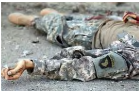
Droite: Un des membres de l'Etat islamique tués dans l'attaque contre le ministère de l'Intérieur afghan portant un uniforme avec une insigne de la 101 ème Division aéroportée des forces armées américaines (Haqq, 1 er juin 2018). Gauche : L'insigne de la 101 ème Division