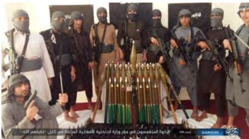
Dix membres de l'Etat islamique avec le drapeau de l'organisation en arrière-plan, avant l'attaque du siège du ministère de l'Intérieur afghan (Haqq, 1 er juin 2018)

► Des photos publiées par l'Etat islamique montrent une dizaine de membres de l'Etat islamique armés de fusils d'assaut et portant des ceintures explosives. D'autres photos montrent les corps de certains des terroristes. Un badge de la 101 ème Division aéroportée des forces armées américaines est visible sur l'uniforme de l'un des morts. Des photos des deux véhicules utilisés par les membres de l'Etat islamique ont également été publiées (Haqq, 1 er juin 2018).