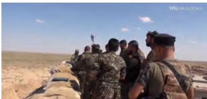
Combattants des FDS à un poste de combat dans la région d'Al-Dashisha

► Le 3 juin 2018, il a été signalé que des affrontements avaient lieu entre les membres de l'Etat islamique et les forces des FDS autour du village d'Al-Dashisha. Au cours des combats, des roquettes auraient été lancées à partir d'une base américaine à Al-Shadadi (environ 30 km au Nord du village d'Al-Dashisha) sur des cibles de l'Etat islamique dans trois villages au Sud-Est de Hasakah (Euphrate Post, 3 juin 2018).