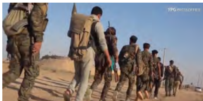
Une colonne de combattants des FDS en route pour opérer contre des cibles de l'Etat islamique autour d'Al-Dashisha (Bureau de presse des YPG, 4 juin 2018)