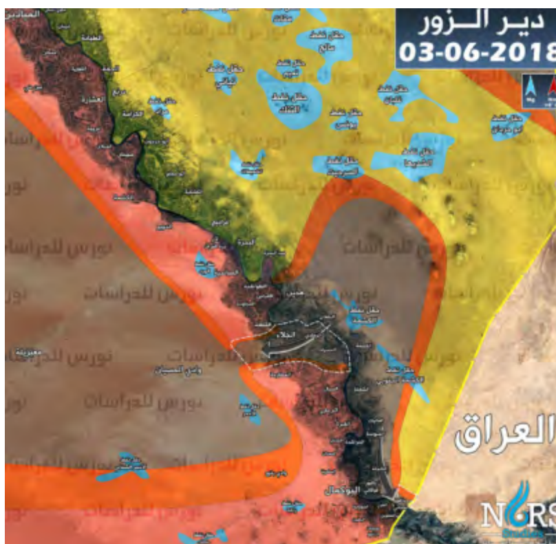
Déploiement des forces dans la région de Deir ez-Zor (exact au 3 juin 2018): L'armée syrienne et les forces qui la soutiennent à l'Ouest de l'Euphrate (bande rouge sombre); les FDS (jaune). Les champs de pétrole (en bleu); l'Etat islamique (brun); la zone d'affrontements entre l'Etat islamique et les FDS à l'Est de l'Euphrate (bande orange) (Institut syrien d'études stratégiques, 4 juin 2018)