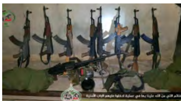
Droite: Armes de l'Armée de Khaled bin Al-Walid saisies par les forces rebelles près de la zone frontalière entre la Syrie, la Jordanie et Israël (Orient News, 31 mai 2018). Gauche : Combattants de l'armée syrienne tirant sur les positions de l'Armée de Khaled bin Al-Walid dans la région de Daraa (SMART News, 1 er juin 2018)