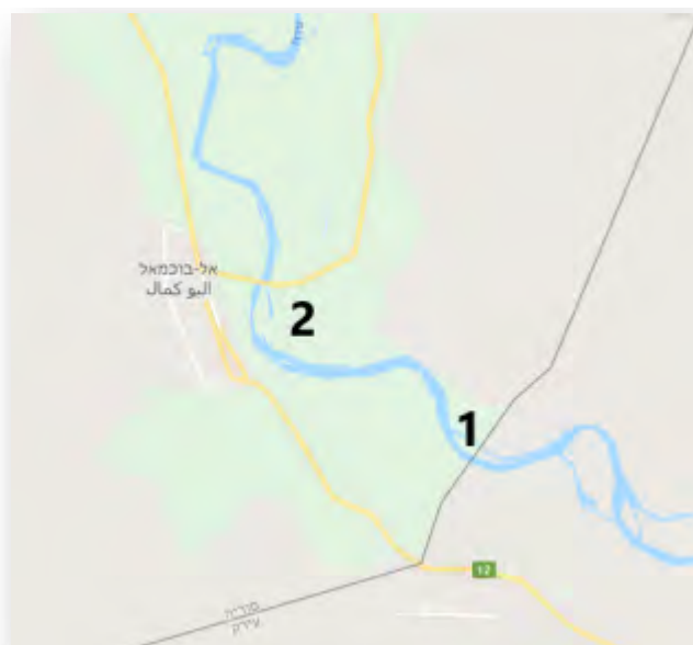
Le village d'Al-Baghrouz al-Fawqani, au Sud-Est d'Abu Kamal (2); le village d'Al-Baghrouz al-Tahtani, près de la frontière irakienne, repris par les FDS (1) (Google Maps)