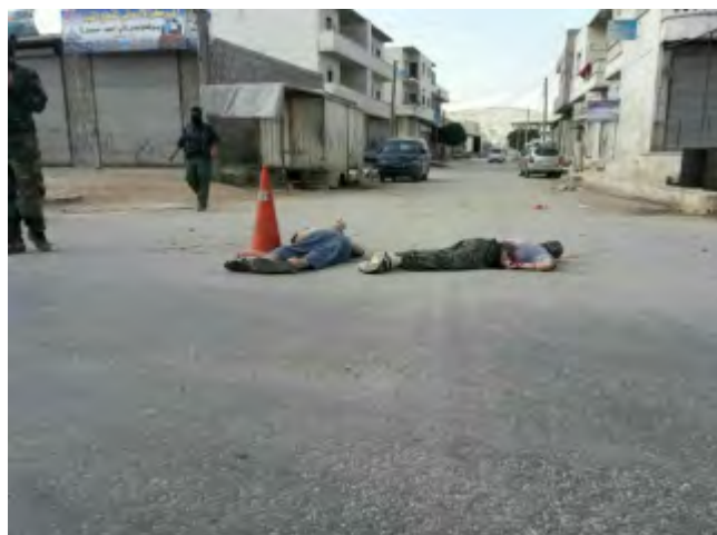
Corps de deux membres de l'Etat islamique gisant dans la rue après avoir été exécutés par le Siège de Libération d'Al-Sham dans la ville d'Al-Dana, au Nord d'Idlib (Haqq, 1 er juin 2018)

► Deux membres de l'Etat islamique ont été capturés alors qu'ils posaient des engins explosifs improvisés près de la banque de sang dans la ville d'Al Dana, à environ 32 km au Nord d'Idlib. Les deux hommes ont été exécutés par des membres du Siège de Libération d'Al-Sham, l'organisation jihadiste contrôlant la région d'Idlib (Spoutnik, 1 er juin 2018).