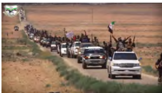
Droite : Convoi de véhicules dans le cadre du défilé militaire. Militants agitant des drapeaux de l'organisation et de l'Armée syrienne libre. Gauche : Les combattants de la milice tribale agitant le drapeau de l'organisation (Enab Baladi, 5 juin 2018)