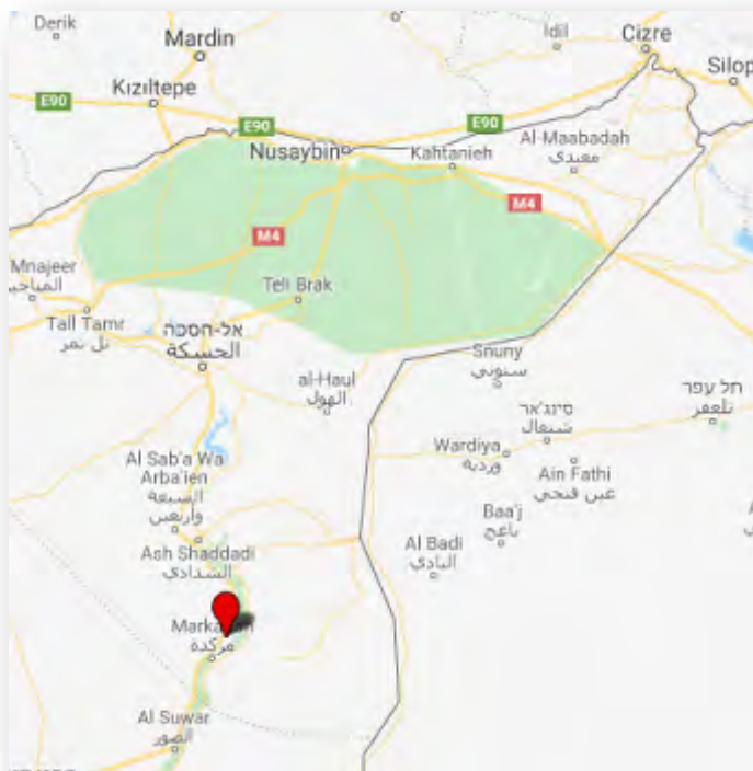
Le village d'Al-Dashisha, bastion de l'Etat islamique dans la zone rurale au Sud de Hasakah

zone rurale au Sud de Hasakah (zone de contrôle kurde à l'Est de l'Euphrate). Le bastion prééminent de l'Etat islamique dans cette zone se trouve dans le village d'Al-Dashisha , à environ 78 km au sud de Hasakah (Enab Baladi, 4 juin 2018).