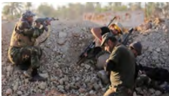
Les forces de sécurité irakiennes au combat (Al-Sumaria News, 31 mai 2018)

de sécurité irakiennes et se sont finalement retirés de la région (Al-Sumaria News, 31 mai 2018).