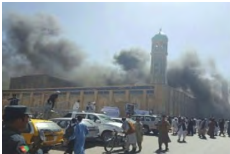
La scène de l'attaque contre la conférence des dignitaires musulmans (barsh.ir, 4 juin 2018)