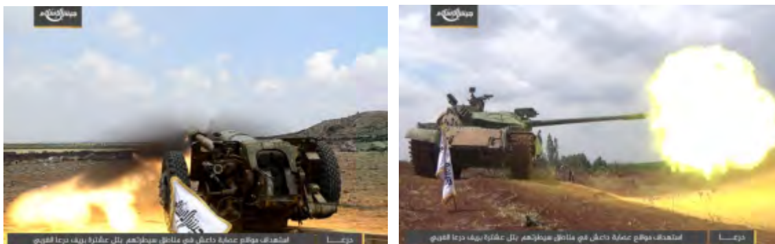
Droite : Un char de Jaysh Al-Islam attaque des positions de l'Armée de Khaled bin Al-Walid à Tell Ashtara, au Nord de Daraa. Gauche: Un char de Jaysh al-Islam attaque des positions de l'armée de Khaled bin Al-Walid à Tell Ashtara