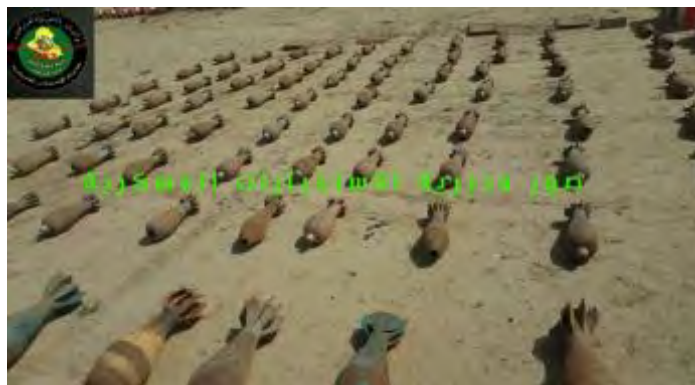
Obus de mortier de 120mm trouvés dans une cache de l'Etat islamique au Sud de Mossoul