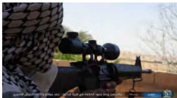
Droite: Un sniper de l'Etat islamique observe les positions de l'armée syrienne depuis le village d'Al-Baghrouz al-Fawqani. Gauche: Un tireur d'élite de l'Etat islamique tire sur des soldats de l'armée syrienne (Haqq, 2 juin 2018)