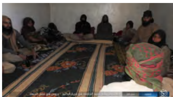
Droite: Des membres de l'Etat islamique, dont des enfants, lors d'une leçon sur les "vertus du jihad" dans le village d'Al-Baghrouz Al-Fawqani, près d'Abu Kamal. Gauche: Membres de l'Etat islamique creusant des tranchées dans le village (Haqq, 2 juin 2018)