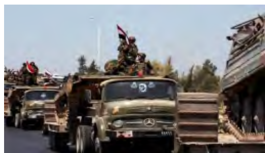
Droite : Colonne de véhicules blindés de l'armée syrienne en route vers Quneitra (Al-Hall, 30 mai 2018). Gauche: Des soldats de l'armée syrienne rejoignent la campagne de reprise de Daraa (Butulat Al-Jaysh Al-Suri, 31 mai 2018)