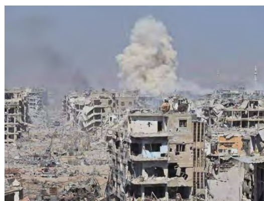
Массивные разрушения, причиненные в лагере беженцев Аль Ярмук (20 мая 2018 г.)