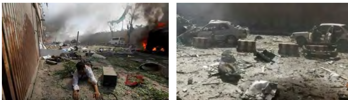
Снимки с места совершения теракта (Ютуб, 19 мая 2018 г.)

► 19-го мая 2018 г. не менее 8 человек было убито, а еще не менее 55 человек получили ранения, в результате 4 взрывов, произведенных в ходе матча по крикету, который проходил на стадионе в г. Джелалабад, находящемся в восточной части Афганистана. 2 из взрывов были устроены на территории стадиона, а 2 других – поблизости от него, судя по всему, с целью поразить игроков и болельщиков, бегущих от стадиона после 2 первых взрывов (газета "Афганистан Таймс", 20 мая 2018 г.). До настоящего момента времени не было обнаружено заявления организации ИГИЛ о принятии на себя ответственности за совершение данного теракта , однако за последнее время организация устроила несколько терактов в г. Джелалабад, и поэтому вероятность того, что именно она стоит за совершением данного теракта, весьма высока.