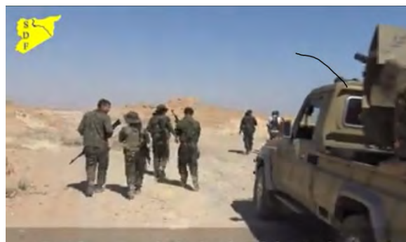
Справа: силы курдской группировки в районе села Хаджин. Слева: бойцы курдской группировки ведут наблюдение в направлении села Хаджин (официальная страница Фейсбук группировки SDF, 20 мая 2018 г.)