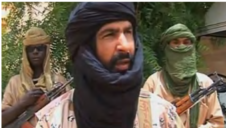
Аднан Абу Аль Валид Аль Сархауви (газета "Буабат Аль Харкат Аль Исламия", 21 мая 2018 г.)