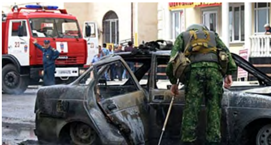
Место совершения теракта (газета "Аль Захина", 20 мая 2018 г.)

себя ответственность за совершение этого теракта. В заявлении организации ИГИЛ было указано, что для совершения этого теракта боевики применили ножи, бутылки с зажигательной смесью и винтовки (агентство новостей Ройтерс, 20 мая 2018 г.).