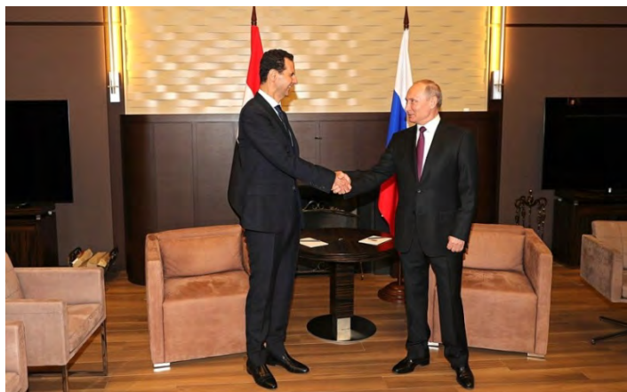
Владимир Путин и Башар Аль Асад в ходе встречи в г. Сочи

сирийская армия добилась в своей борьбе против террора, и перехода к более активной стадии в политическом процессе, Россия и Сирия будут действовать, исходя из предположения, что "иностранное вооруженные формирования отступят с территории Сирийской Арабской Республики" (сайт Кремля на английском языке, 17 мая 2018 г.) 2 .