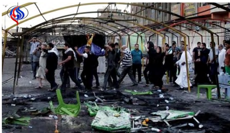
Место совершения теракта (телеканал "Аль Алам", 16 мая 2018 г.)