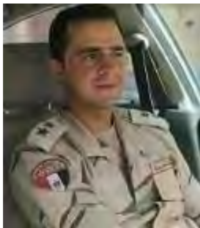
Раад (майор) Абед Аль Рахман Аль Шанауви (аккаунт Твиттер AL AGNABY@AgnabyAI, 18 мая 2018 г.)

► 18-го мая 2018 г. организация ИГИЛ сообщила, что ее вооруженные боевики совершили нападение на пункт сосредоточения сил египетской армии, находившийся в южной части г. Аль Шейх Зувейд. В результате этого нападения был убит раад (майор) Абед Аль Рахман Аль Шанауви , а также еще один солдат (агентство новостей "Хек", 18 мая 2018 г.).