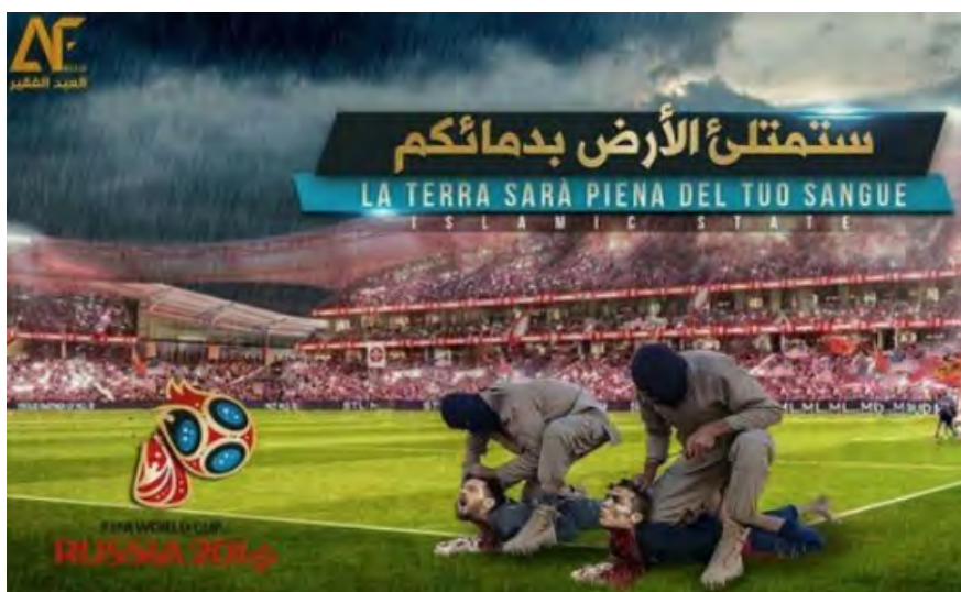
Листовка под заголовком "Земля будет напитана вашей кровью", ниже которого написано "исламское государство" (Site, 17 мая 2018 г.)

► 16-го мая 2018 г. организация ИГИЛ опубликовала, в мобильном приложении "Телеграм" и в социальных сетях, новую листовку, в которой содержится фотомонтаж, изображающий, как боевики организации ИГИЛ отрезают головы знаменитым футболистам Лионелю Месси и Кристиано Рональдо на игровом поле заполненного зрителями стадиона. Заголовок, выполненный на арабском и испанском языках, гласит: "Земля будет напитана вашей кровью", и под ним размещена надпись на английском языке "исламское государство" (Site, 17 мая 2018 г.). Это очередная акция, совершаемая в рамках кампании запугивания, которую организация ИГИЛ ведет в преддверии начала чемпионата мира по футболу в России.