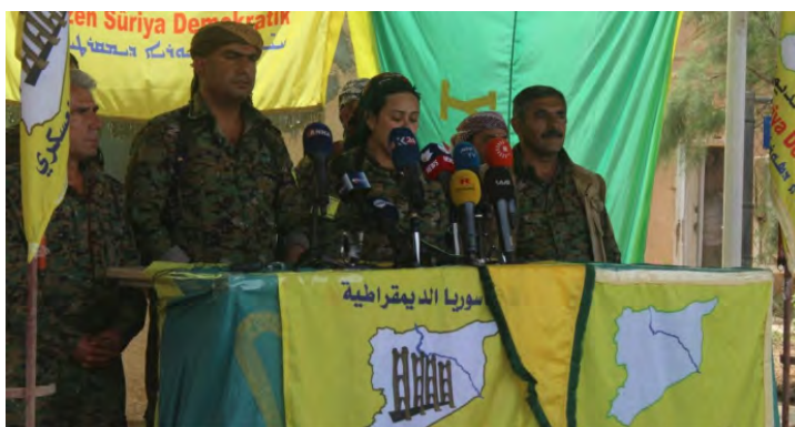
Представители группировки SDF объявляют о начале операции "Буря на острове" (сайт группировки SDF, 1 мая 2018 г.)

► Группировки "Демократические силы Сирии" (SDF), действующая при поддержке США, объявила о начале операции "Буря на острове" . Целью операции является ликвидация присутствия боевиков организации ИГИЛ в районе, прилегающем к границе между Сирией и Ираком, и полная зачистка этого района (сайт группировки SDF, 1 мая 2018 г.). На данном этапе в нашем распоряжении не имеется информации о ходе проведения данной операции.