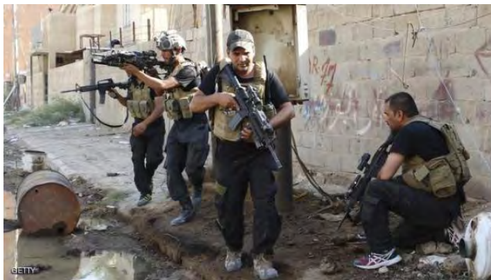
Служащие иракских сил безопасности в ходе проведения одной из операций (иракское агентство новостей, 29 апреля 2018 г.)