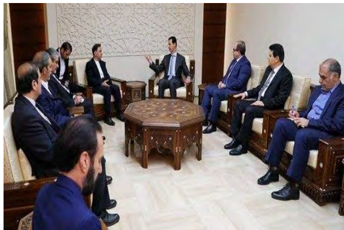
פגישת הנשיא אסד עם שר התחבורה והפיתוח העירוני האיראני (מהר, 18 במאי 2018)