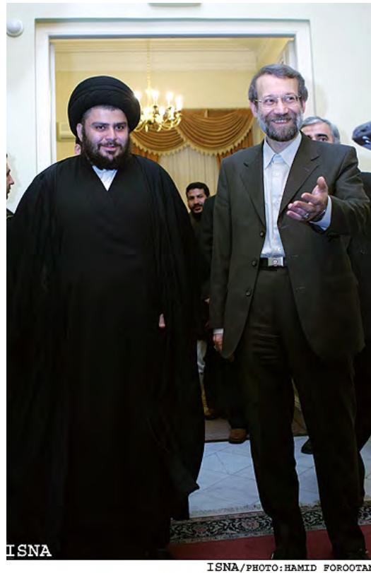
תמונה משנת 2006 של מקתדא אלצדר עם עלי לאריג'אני (יו"ר המג'לס, אז שימש כמזכיר המועצה העליונה לביטחון לאומי) (איסנ"א, 22 בינואר, 2006)

◀ בתוך כך דווח בתקשורת הערבית והמערבית, כי מפקד כוח קדס של משמרות המהפכה, קאסם סלימאני, הגיע במחצית מאי 2018 לביקור בבגדאד כדי לקיים התייעצויות פוליטיות בעקבות הבחירות בעיראק ולקדם הרכבת ממשלה שתעלה בקנה אחד עם האינטרסים האיראנים (אלשרק אלאוסט; רויטרס, 16 במאי 2018). ◀ בהתייחסו לתוצאות הבחירות בעיראק אמר דובר משרד החוץ האיראני, בהראם קאסמי ( Bahram Qasemi), במסיבת העיתונאים השבועית שלו, כי לא צפויה כל בעיה בין איראן לממשלת עיראק החדשה לנוכח היחסים הטובים בין שתי המדינות. הוא אמר, כי יש להמתין בסבלנות ולראות אילו זרמים פוליטיים ירכיבו את הממשלה הבאה. קאסמי הדגיש, כי איראן רואה בעיראק מדינה עצמאית וכי היא מכבדת את בחירתו של העם העיראקי (תסנים, 21 במאי 2018). ◀ אירג' מסג'די (Iraj Masjedi), שגריר איראן בבגדאד, הגיב, אף הוא, לתוצאות הבחירות בעיראק ואמר, כי בכירים איראנים, ובהם מפקד כוח קדס של משמרות המהפכה, קאסם סלימאני, מקיימים קשרים טובים וידידותיים עם מקתדא אלצדר. הוא דחה את הטענות על חילוקי דעות בין איראן לאלצדר ואמר, כי לאיראן יש קשרים טובים עם כל הקבוצות, שזכו במספר המושבים הגדול ביותר בבחירות לפרלמנט העיראקי (אירנ"א, 21 במאי 2018).