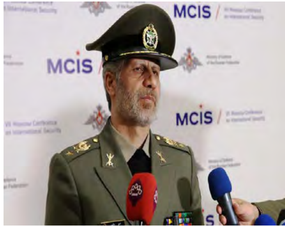
שר ההגנה האיראני במוסקבה (אירן"א, 4 באפריל 2018)