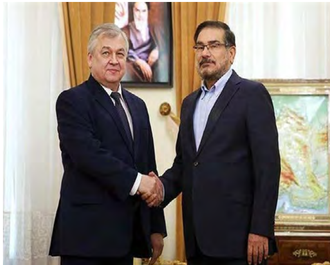
פגישת שליח נשיא רוסיה לענייני סוריה עם עלי שמח'אני (תסנים, 11 באפריל 2018)

◀ ב-10 באפריל, 2018, נפגש יועצו של שר החוץ האיראני לעניינים מדיניים, חסין-ג'אברי אנצארי ( Hossein Jaber Ansari), בטהראן עם שליחו המיוחד של נשיא רוסיה לענייני סוריה, אלכסנדר לברנטייב. אנצארי אמר, כי ההתפתחויות בסוריה מחייבות להגביר את שיתוף הפעולה בין שתי המדינות. בפגישה השתתפו גם נציגים משרד ההגנה של שתי המדינות. במהלך ביקורו הבלתי מתוכנן בטהראן נפגש לברנטייב גם עם מזכיר המועצה העליונה לביטחון לאומי של איראן, עלי שמח'אני, ודן עימו בהתפתחויות בסוריה, ובראשן התקיפה הישראלית בבסיס חיל האוויר הסורי T-4 ואיומי ארה"ב לתקוף בסוריה בתגובה לשימוש בנשק כימי על-ידי צבא סוריה (איסנ"א, 10 באפריל 2018).