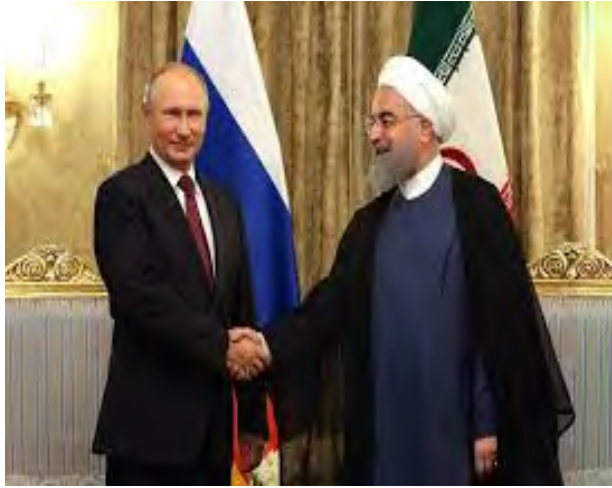
פגישת פוטין-רוחאני בטהראן (מהר, 1 בנובמבר 2017)

◀ ב-19 במאי פרסם האתר "תאבנאכ" מאמר פרשנות נוסף, בו כינה את הצהרות יועצו הנשיאותי של ולדימיר פוטין בנוגע להמשך נוכחותם של כוחות זרים בסוריה "משחק הרוסים במגרשן של ישראל ואמריקה". במאמר נכתב, כי לאחר הצהרות פוטין בפגישתו עם נשיא סוריה בסוצ'י, העריכו כמה מתומכי רוסיה, כי פוטין לא התכוון לכוחות איראן או חזבאללה אלא רק לכוחות ארה"ב ותורכיה, אך דברי לברנטייב הבהירו כי פוטין התכוון גם לכוחותיה של איראן. פרישת ארה"ב מהסכם הגרעין הגבירה, לטענת "תאבנאכ", את הצורך של איראן בתמיכת רוסיה, וזו עשויה להשתמש בנסיבות החדשות שנוצרו על מנת לדרוש מטהראן ויתורים בסוגיית סוריה ובסוגיות נוספות.