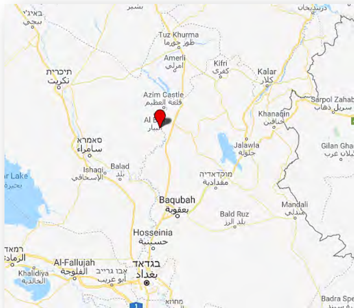
אזור אלמטיביג'ה

◀ בכיר עיראקי במחוז דיאלא דיווח, כי דאעש הפך את אזור אלמטיביג'ה (כ-66 ק"מ מצפון לבעקובה) למעוזו העיקרי בעיראק . נמסר כי באזור התקבצו פעילי דאעש ממחוזות שונים, בהם דיאלא, ומספרם שם הולך וגדל (אלסומריה ניוז, 18 במאי 2018).