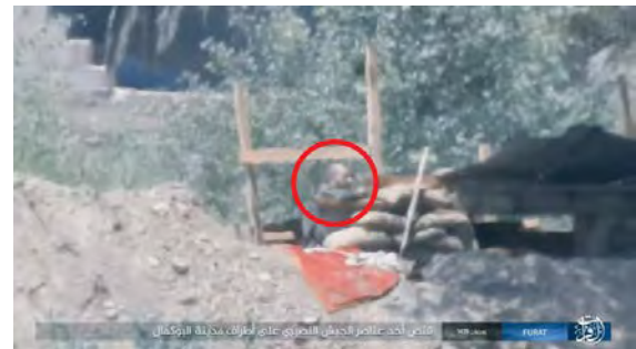
מימין: חייל צבא סוריה בעמדה לפני שנורה למוות על-ידי צלף דאעש בפרברי אלבוכמאל. משמאל: חייל צבא סוריה קורס בעמדה, לאחר שנורה למוות על-ידי צלף דאעש (חק, 17 במאי 2018)