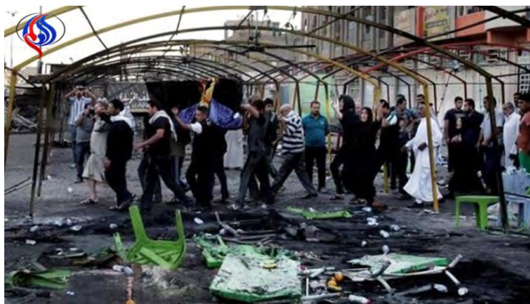
זירת הפיגוע (אלעאלם, 16 במאי 2018)

עיראקיים המחבל הותקף על-ידי כוחות הביטחון, ובמהלך ההתקפה נהרגו מספר בני אדם ואחרים נפצעו (אלעאלם, 16 במאי 2018).