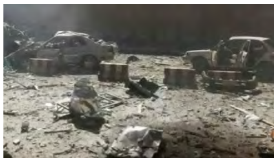
צילום מזירת הפיגוע (יוטיוב, 19 במאי 2018)