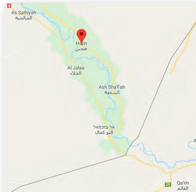
העיירה הג'ין

במורד עמק הפרת נמשכו הקרבות בפרברי העיירה הג'ין (כ-26 ק"מ צפונית לאלבוכמאל), המעוז הבולט של דאעש בגדה המזרחית של הפרת. כוחות SDF כבשו תל השולט על הג'ין וכי בפרברי העיירה התחוללו קרבות. דווח כי כוחות SDF הסתייעו בירי ארטילרי של כוח צרפתי לעבר מטרות דאעש ובתקיפות אוויריות של מטוסי הקואליציה הבינלאומית (מרכז המעקב הסורי לזכויות אדם, 20 במאי 2018; עמוד הפייסבוק של SDF, 20 במאי 2018).