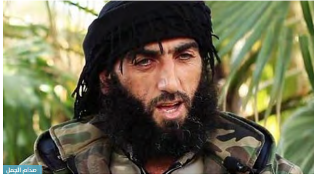
צדאם עמר יחיא אלג'מל, בכיר דאעש שהיה שותף לשריפת החייל הירדני (אלדסתור, 13 במאי 2018)