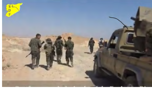
מימין: כוחות כורדיים באזור העיירה הג'ין. משמאל: כוחות כורדיים צופים על העיירה הג'ין