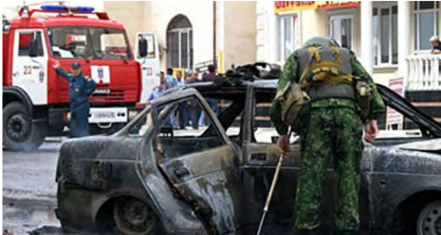
זירת הפיגוע (אלזכונה, 20 במאי 2018)