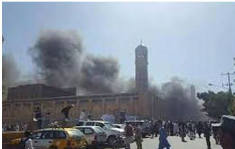
זירת הפיגוע באפגניסטן (אח'באר ליביא, 7 במאי 2018).