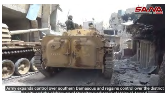
Army expands control over southern Damascus and regains control over the district vicinity and the clubhouse of Quneitra workers in al-Hajar al-Aswad

מימין: כוח משוריין של צבא סוריה בשכונת אלחג'ר אלאסוד. משמאל: נגמ"ש של צבא סוריה בשכונה (סאנא, 6,4 במאי 2018).