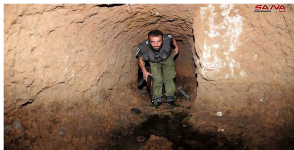
מימין: חייל מצבא סוריה במנהרה של דאעש שנמצאה בשכונת אלחג'ר אלסוד. משמאל: פתח של אחת המנהרות של דאעש (סאנא, 6 במאי 2018).