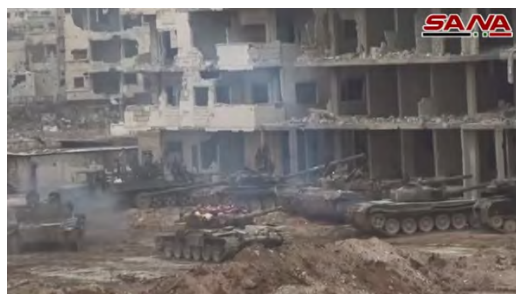
מימין: טנקים של צבא סוריה בשטח כינוס סמוך למבנים שנפגעו בשכונת אלחג'ר אלסוד (סאנא, 7 במאי 2018). משמאל: חיילי צבא סוריה בשכונה (סאנא, 7 במאי 2018).