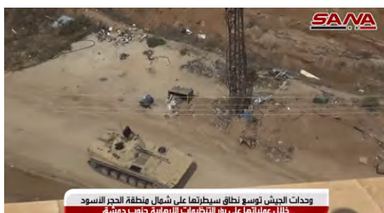
وحدات الجيش توسع نطاق سيطرتها على شمال منطقة الحجر الأسود خلال عملياتها على بوز التظاهرات الأرمينية جنوب دمشق