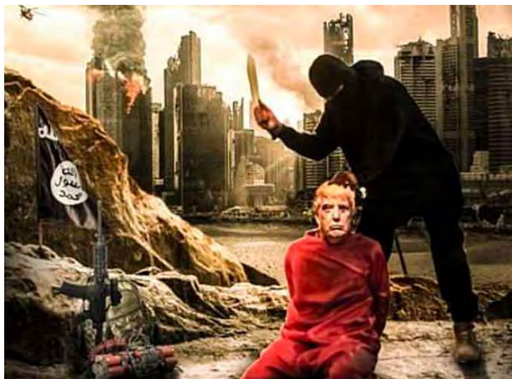
כרזה חדשה של דאעש באנגלית, שפורסמה בטלגרם, בה נראה נשיא ארה"ב טראמפ רגע לפני עריפת ראשו על רקע גורדי שחקים מפויחים ומעלים עשן בניו-יורק (ממר"י, 7 במאי 2018).

◀ ב-7 במאי 2018 פורסמה באמצעות הטלגרם כרזה חדשה של דאעש באנגלית תחת הכותרת "התאזרי בסבלנות אמריקה" (Be Patient America). בכרזה נראה נשיא ארה"ב, דונלד טראמפ, בסרבול כתום, רגע לפני עריפת ראשו, על רקע גורדי שחקים מפויחים ומעלים עשן בניו יורק. מעל הכרזה הופיע איום באנגלית האומר: "התאזרי בסבלנות אמריקה, המלחמה עדיין לא הסתיימה ולא ניצחת. בעזרת אללה את תובסי, רק חכי לכך. חרבותינו אינן שבורות, זרעותינו אינן חלשות, הרצון להט ש לנו לא דעך ולא הרגשנו משועממים או חלשים! אך, בחסדו של אללה אנו הרבה יותר חזקים ממה שהיינו בהתחלה של מלחמתך. בכל יום שחולף, אנו נעשים חזקים יותר בחסדו של אללה ואת נעשית חלשה יותר..." (ממר"י, 7 במאי 2018).