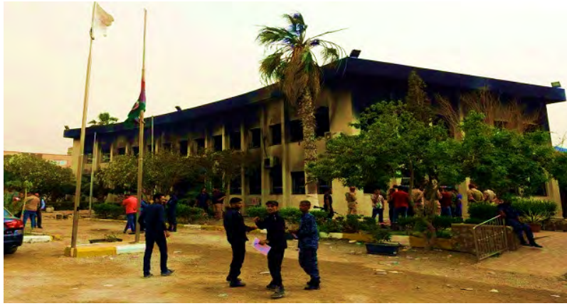
מבנה מטה וועדת הבחירות העליונה בטריפולי. המבנה נראה מפויח בעקבות הפיגוע, אך עדיין עומד על תילו (בואבת אליום אלואל, 2 במאי 2018).