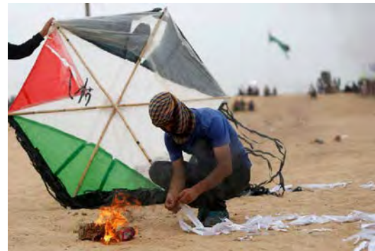
פלסטינים מכינים "עפיפון תבערה" מזרחית לעזה לקראת שיגורו לשטח ישראל (חשבון הטוויטר PALINFO, 4 במאי 2018).

◀ כלי התקשורת של חמאס מעודדים את שיגור "עפיפוני התבערה" ומשתבחים בנזק שגורמים העפיפונים הללו. עמוד הפייסבוק של רשת החדשות קדס פרסם (4 במאי 2018) כתבה אודות קבוצה של צעירים המכנה עצמה "יחידת העפיפונים" . אחד הצעירים אמר כי יחידה זאת בנתה עפיפונים רבים שנועדו לשרוף יערות רבים בישראל. לדברי אותו צעיר אנשי "יחידת העפיפונים" קושרים לעפיפונים את דגלי פלסטין כדי להראות, שפעילותם אינה אלימה. בפועל מהווה שיגור "עפיפוני התבערה" חלק ממגוון גדול של מעשי אלימות המופעלים במסגרת "צעדת השיבה הגדולה" בעידוד חמאס.