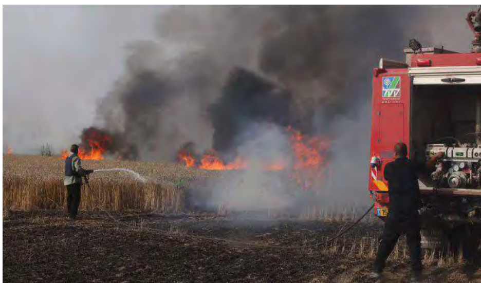
שריפה בשדות קיבוץ בארי, אשר נגרמה מ"עפיפון תבערה" (דף הפייסבוק אלרסאלה, 2 במאי 2018).