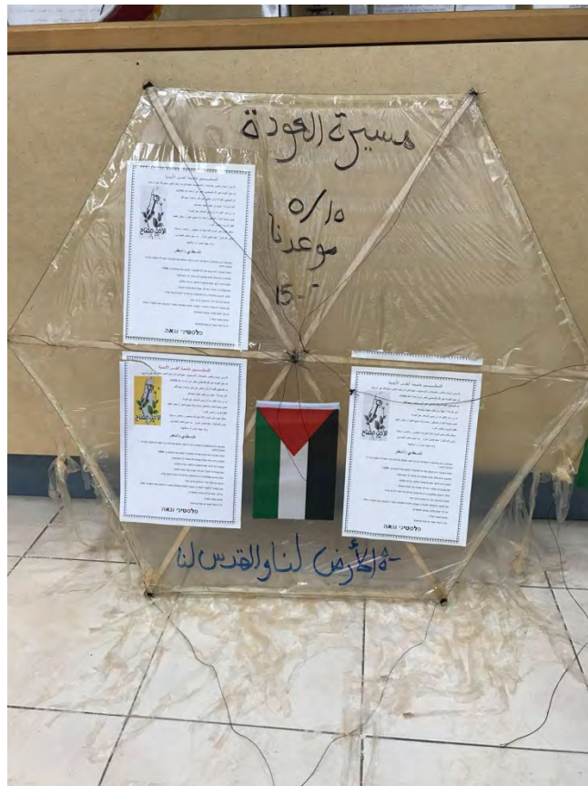
דגם העפיפון שהגיע לידי מרכז המידע למודיעין ולטרור. למעלה: "צעדת השיבה, 15 במאי ["יום הנכבה"] הוא המועד שלנו". למטה: "האדמה לנו וירושלים לנו".

◀ לידי מרכז המידע למודיעין ולטרור הגיע "עפיפון תעמולה" ששוגר מרצועת עזה לשטח ישראל. זהו עפיפון פשוט מייצור ביתי. במקרה זה לא נמצא חיבור לעפיפון לגורם תבערה כלשהו ולא אותרו סימנים כי העפיפון הוצת. העפיפון הורכב מכפיסי עץ שאליהן חוברת יריעת ניילון ונוסף לו זנב ארוך. יריעת הניילון חוברת לכפיסי העץ באמצעות חוטים. לגוף העפיפון חוברו שלושה כרוזים (בעלי תוכן זהה) ושני דגלי פלסטין (אחד באמצע והשני בצדו של העפיפון).. על גבי העפיפון נכתב בטוש שחור "צעדת השיבה, 15 במאי ["יום הנכבה"] הוא המועד שלנו". למטה נכתב "האדמה לנו וירושלים לנו".