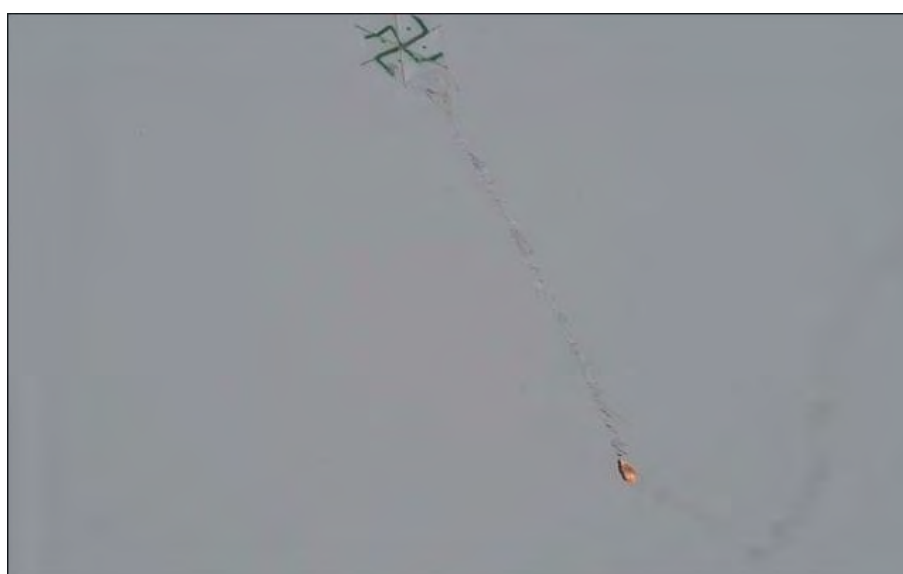
"עפיפון תבערה" עם צלב קרס ששוגר משטח הרצועה לעבר ישראל (דובר צה"ל, 20 באפריל 2018).