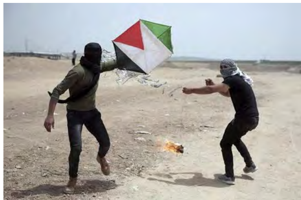
מימין: פלסטינים משגרים "עפיפון תבערה" ממרכז הרצועה לעבר ישראל (חשבון הטוויטר PALINFO, 21 באפריל 2018). משמאל: שריפה במתבן בקיבוץ כיסופים כתוצאה מ"עפיפון תבערה" (דף הפייסבוק שהאב, 21 באפריל 2018)