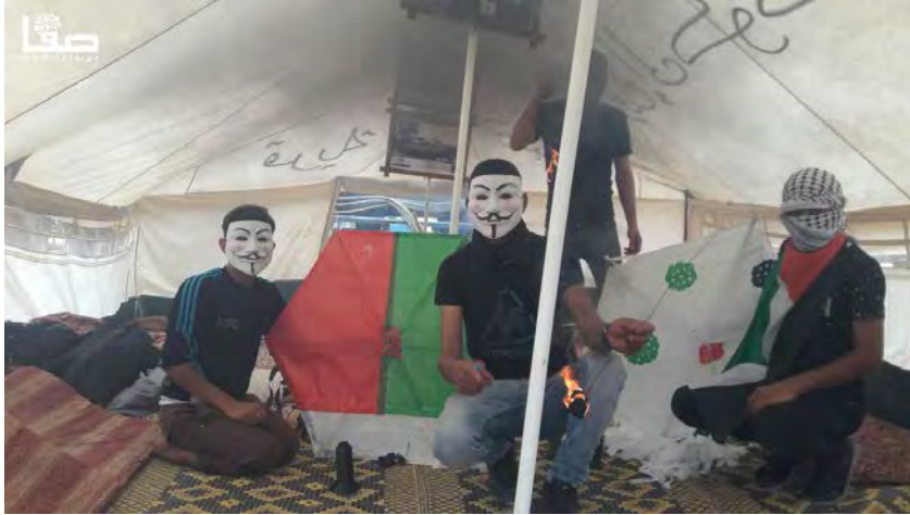
פלסטינים מכינים "עפיפון תבערה" בתוך "מחנה השיבה", מזרחית למחנות מרכז הרצועה.