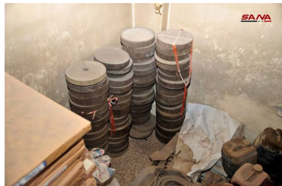
Droite : Mines saisies par l'armée syrienne dans le quartier d'Al-Hajar al-Aswad. Gauche : Conteneurs d'explosifs de l'Etat islamique (SANA, 6 mai 2018)