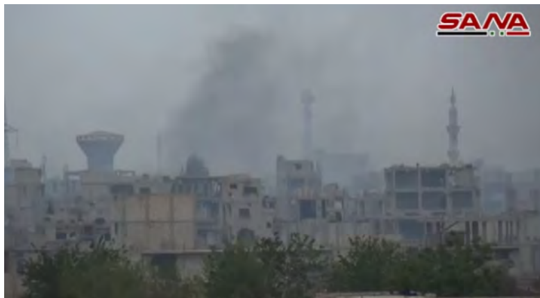
Fumée dans le quartier d'Al-Hajar al-Aswad à la suite des frappes aériennes et des tirs d'artillerie de l'armée syrienne (SANA, 7 mai 2018)

du quartier (Al-Watan, 6 mai 2018). L'armée syrienne a découvert un réseau de tunnels dans le quartier d'Al-Hajar al-Aswad et saisi des armes, des mines, des explosifs et des engins piégés (SANA, 6 mai 2018). Le 7 mai 2018, l'armée de l'air syrienne a effectué des frappes aériennes, au cours desquelles des bombes ont été lancées dans les zones sous le contrôle de l'Etat islamique dans les quartiers d'Al-Hajar al-Aswad et d'Al-Tadamon.