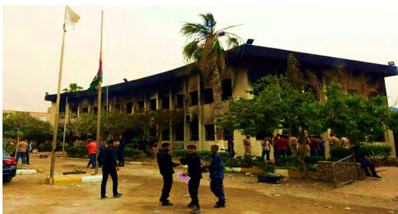
Le siège de la Haute Commission électorale nationale à Tripoli après l'attentat (Bawabat Al-Youm al-Awwal, 2 mai 2018)