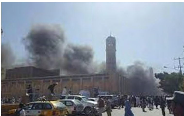
La scène de l'attaque en Afghanistan (Akhbar Libye, 7 mai 2018)