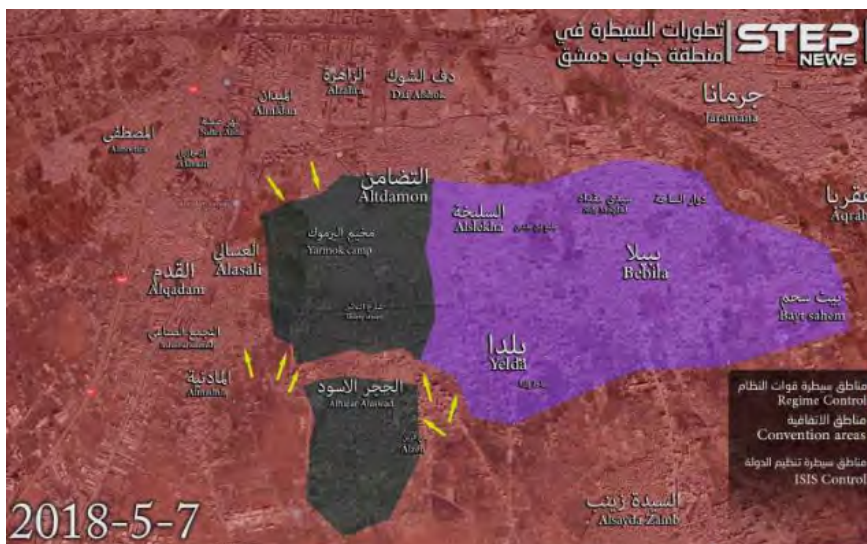
Directions de l'attaque de l'armée syrienne, qui a réussi à séparer le camp de réfugiés de Yarmouk du quartier d'Al-Hajar al-Aswad (Khotwa, 7 mai 2018)

Hajar Al-Aswad au Sud. Cette semaine, les forces syriennes ont continué d'avancer dans le camp de réfugiés de Yarmouk du Nord au Sud. Selon les médias affiliés au régime syrien, plus de 65% du camp sont maintenant sous le contrôle de l'armée syrienne (Butulat Al-Jaysh Al-Suri, 5 mai 2018). En outre, l'armée syrienne a réussi à séparer le quartier d'Al-Hajar al-Aswad du camp de réfugiés de Yarmouk et à reprendre la partie Sud du quartier.