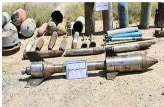
Armes de l'Etat islamique trouvées dans la province d'Al-Anbar (5 mai 2018)