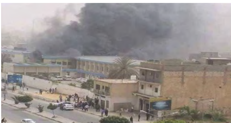
La fumée monte du siège de la Haute Commission électorale nationale à Tripoli, où l'attaque de l'Etat islamique a eu lieu (Al-Mutawasit, 3 mai 2018)

► L'Etat islamique a revendiqué la responsabilité de l'attaque. La revendication de responsabilité a déclaré que l'attaque a été menée en réponse à un appel du porte-parole de l'Etat islamique Abu al-Hassan al-Muhajir d'attaquer les centres électoraux dans le pays. En outre, le texte précise que deux membres de l'organisation sont arrivés au siège de la Haute Commission électorale nationale à Tripoli, ont échangé des coups de feu avec les gardes de sécurité à l'extérieur du bâtiment et sont entrés, tirant sur les personnes présentes. Après avoir manqué de munitions, ils ont fait exploser leurs gilets explosifs. Au moins 15 membres de sécurité et employés ont été tués (Haqq, 3 mai 2018).