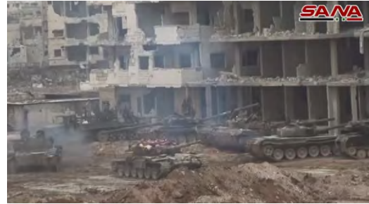
Droite : Chars de l'armée syrienne dans une zone de rassemblement près de bâtiments endommagés dans le quartier d'Al-Hajar al-Aswad. Gauche : Soldats de l'armée syrienne dans le quartier (SANA, 7 mai 2018)