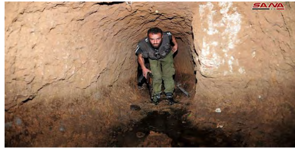
Droite : Soldat de l'armée syrienne dans un tunnel de l'Etat islamique découvert dans le quartier d'Al-Hajar al-Aswad. Gauche : L'ouverture d'un des tunnels de l'Etat islamique (SANA, 6 mai 2018)