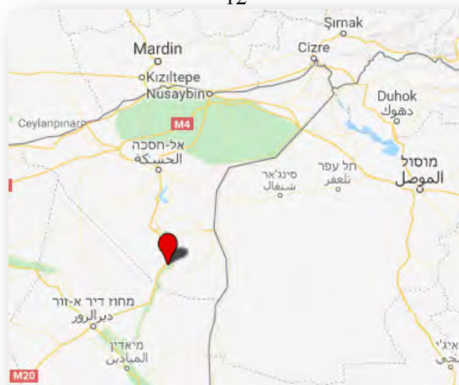
La zone de l'attaque aérienne irakienne à Al-Dashisha, en territoire syrien