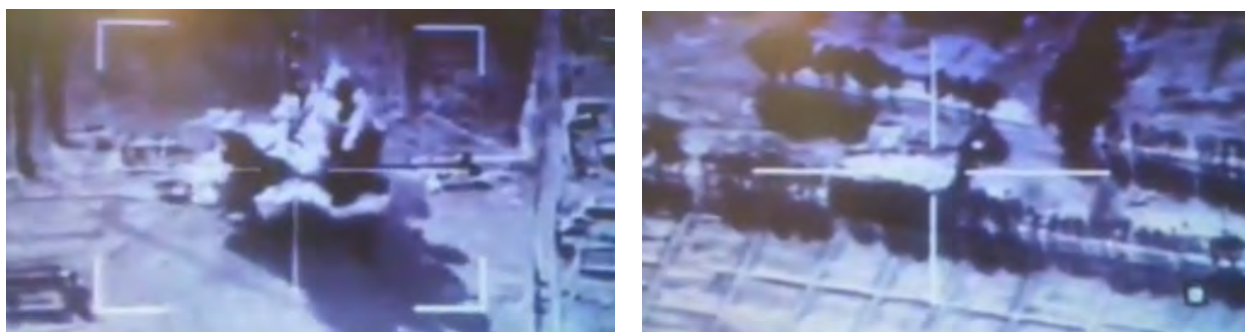
Droite : Bâtiment à Al-Dashisha où les commandants de l'Etat islamique étaient présents avant l'attaque de l'armée de l'air irakienne. Gauche : La frappe aérienne sur le bâtiment (Euphrates Post, 6 mai 2018)