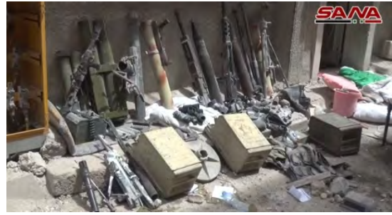
Droite : Armes de l'Etat islamique saisies dans le quartier d'Al-Hajar al-Aswad. Gauche : Grenades et masques à gaz de l'Etat islamique (SANA, 4 mai 2018)