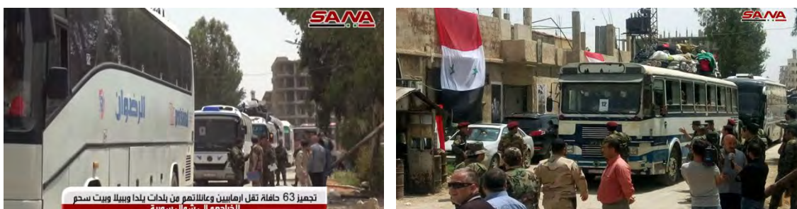
Droite : Deux des bus qui ont évacué les membres du Siège de Libération d'Al-Sham et leurs familles dans la première phase (SANA, 4 mai 2018). Gauche : Certains des bus qui ont évacué les membres du Siège de Libération d'Al-Sham et leurs familles dans la troisième phase (SANA, 5 mai 2018)

► Le 6 mai 2018, l'évacuation de près de 5 000 membres du Siège de Libération d'Al-Sham et de leurs familles a été achevée. L'évacuation a été effectuée des quartiers de Yalda, Babila et Beit Sahm, à l'Est du camp de réfugiés de Yarmouk. Elle a été réalisée en trois phases, par des dizaines de bus dans chacune. Les évacués ont été transférés dans la zone d'Idlib (contrôlée par le Siège de Libération d'Al-Sham) et dans la zone de Jarabulus (contrôlée par la Turquie).