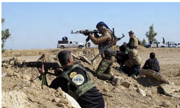
Combattants de la Mobilisation populaire lors d'activités de sécurité