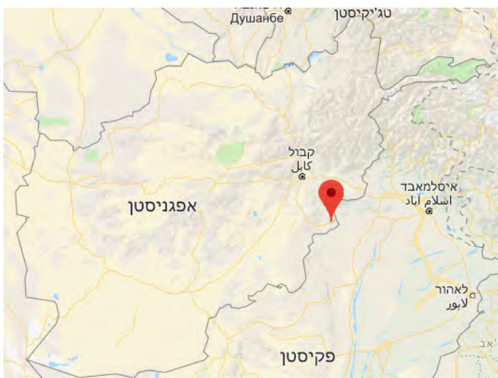
Province de Khost dans l'Est de l'Afghanistan (Google Maps)

► Le 6 mai 2018, dix-sept personnes auraient été tuées et 36 blessées dans une explosion dans une mosquée utilisée comme centre d'inscription des électeurs dans la province de Khost dans l'Est de l'Afghanistan (près de la frontière entre l'Afghanistan et le Pakistan). Les mosquées d'Afghanistan servent de centre d'inscription des électeurs (Afghanistan Times, 6 mai 2018). À ce stade, aucune revendication de responsabilité n'a été publiée par l'Etat islamique, mais on sait que l'organisation s'est fixée l'objectif de perturber le processus électoral en Afghanistan et ailleurs.