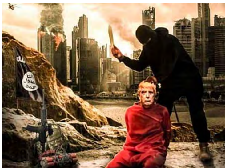
Nouvelle affiche de l'Etat islamique en anglais, publiée sur Telegram, montrant le Président Trump sur le point d'être décapité, avec les gratte-ciels de New York Ville en feu en arrière-plan (MEMRI, 7 mai 2018)

► Le 7 mai 2018, une nouvelle affiche de l'Etat islamique avec l'inscription "Be Patient America" a été publiée sur Telegram. L'affiche montre le Président américain Donald Trump dans une combinaison orange sur le point d'être décapité , avec les gratte-ciels New York en feu en arrière-plan. En haut de l'affiche, une menace en anglais précise : "Soyez patiente Amérique. La guerre n'est pas encore finie et vous n'avez pas gagné. Avec l'aide d'Allah, vous serez vaincue, attendez. Nos épées ne sont pas brisées, nos bras ne sont pas fatigués, notre passion ne s'est pas éteinte et nous ne nous sommes pas ennuyés ou faibles ! Mais, par la grâce d'Allah, nous sommes beaucoup plus forts que nous l'étions au début de votre guerre. Avec chaque jour qui passe, nous devenons plus forts par la grâce d'Allah et vous devenez plus faible [...]" (MEMRI, 7 mai 2018).