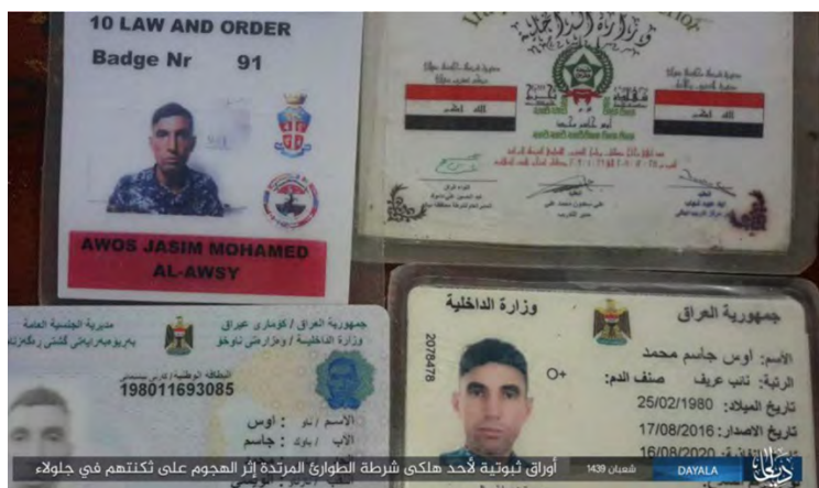
Certificats d'identité de policiers irakiens qui auraient été tués par des membres de l'Etat islamique au Nord-Est de Baqubah (Nasher, 3 mai 2018)