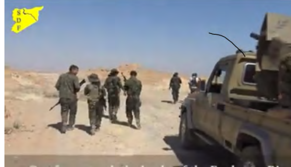
على اليمين: قوات كردية في محيط بلدة هجين. على اليسار: قوات كردية تشرف على بلدة هجين