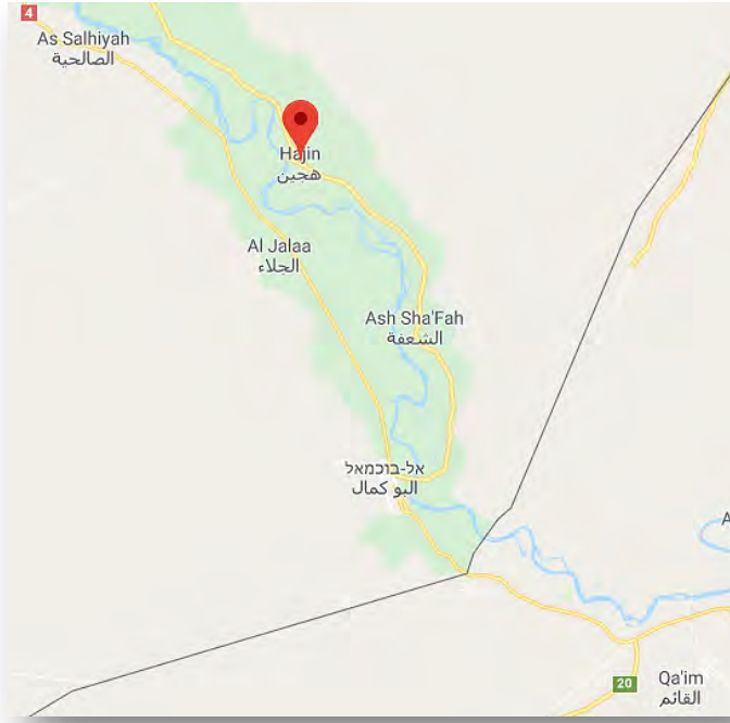
بلدة هجين

تواصلت المعارك في منخفض وادي الفرات في ضواحي بلدة هجين (على مبعده حوالي 26 كلم إلى الشمال من البوكمال)، وهو ابرز معاقل تنظيم الدولة الإسلامية على الضفة الشرقية لنهر الفرات. احتلت قوات سوريا الديمقراطية (SDF) تلة حاكمة تطل على بلدة هجين ودارت معارك في ضواحي البلدة. وأفادت التقارير بأن قوات سوريا الديمقراطية (SDF) قد استعانت بقصف مدفعي قامت به قوة فرنسية على مواقع لتنظيم الدولة الإسلامية وغارات جوية لطائرات التحالف الدولي (المرصد السوري لمتابعة حقوق الإنسان، 20 أيار/ مايو 2018; صفحة فيسبوك قوات سوريا الديمقراطية - SDF، 20 أيار/ مايو 2018).