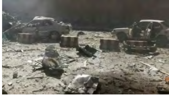
صور من مسرح العملية (يوتيوب، 19 أيار/ مايو 2018)