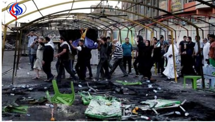
مسرح العملية (العالم، 16 أيار/ مايو 2018)