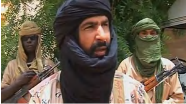
عدنان ابو الوليد الصحراوي (بوابة الحركات الإسلامية، 21 أيار/ مايو 2015).

◀ في 16 أيار/ مايو 2018 أفادت التقارير الإخبارية بأن وزارة الخارجية الأمريكية قد أضافت فرع سهاره في تنظيم الدولة الإسلامية (Islamic State in the Greater Sahara - ISGS)، إلى قائمة التنظيمات الإرهابية الدولية. وجاء في التقرير أن قائد هذه الولاية هو عدنان أبو الوليد الصحراوي، الذي بايع تنظيم الدولة الإسلامية في تشرين أول/ أكتوبر 2016. و فرع سهاره التابع لتنظيم الدولة الإسلامية والذي يعمل في منطقة حدود بوركينا فاسو والنيجر ومالي سبق له أن تبنى المسؤولية عن عدد من العمليات التي تم تنفيذها في المنطقة (The Long War Journal، 16 أيار/ مايو 2018).