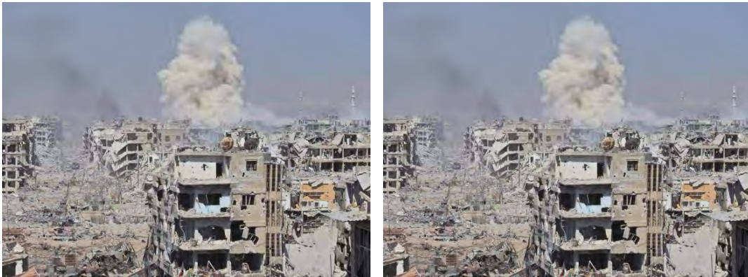
الدمار الشامل الذي لحق بمخيم اليرموك للاجئين (حق، 20 أيار/ مايو 2018)