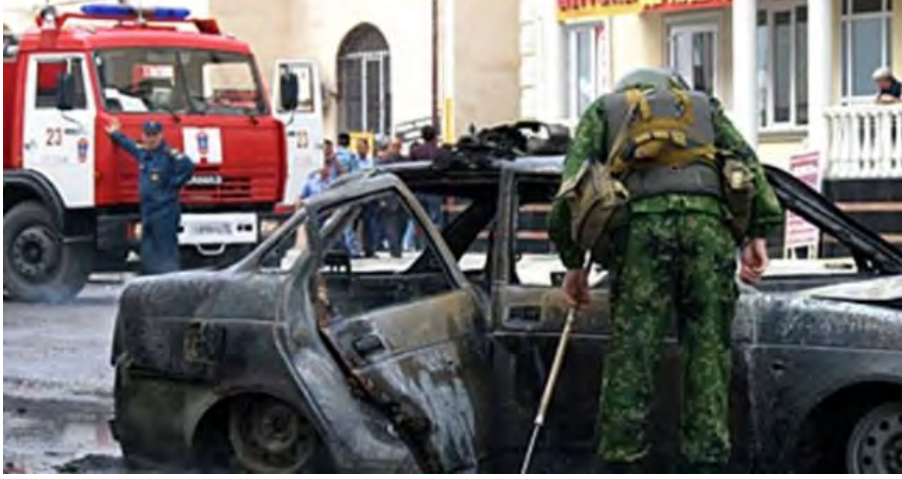
مسرح العملية (الزكينة، 20 أيار/ مايو 2018)