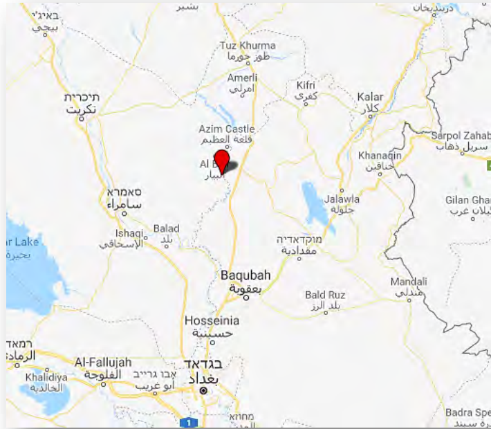
منطقة المطيبيجة (Google Maps)

◀ وقالت شخصية عراقية رفيعة في محافظة ديالى إن تنظيم الدولة الإسلامية قد جعل منطقة المطيبيجة (على مبعده ما يقارب 66 كيلومتر إلى الشمال من بعقوبه) معقله الأساسي في العراق. وأفادت المعلومات بأن عناصر تنظيم الدولة الإسلامية قد احتشدوا في المنطقة قادمين من محافظات مختلفة، ومنها محافظة ديالى وأن أعدادهم هناك تتزايد باستمرار (السومريه نيوز، 18 أيار/ مايو 2018).