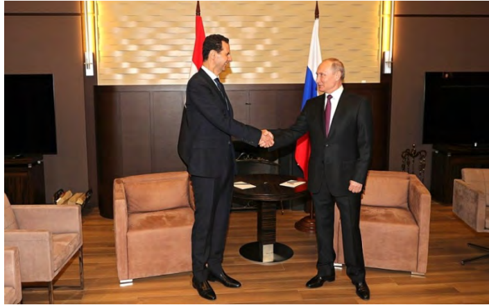
فلاديمير بوتين وبشار الأسد أثناء لقائهما في سوتشي (موقع الكرملين، 17 أيار/ مايو 2018)

◀ في 17 أيار/ مايو 2018 قدم الرئيس السوري بشار الأسد في زيارة مفاجئة إلى مدينة سوتشي في روسيا. وأثناء زيارته التقى الأسد مع الرئيس الروسي فلاديمير بوتين. ووفقاً للتقرير الصادر في موقع الكرملين فقد تباحث الاثنان الأوضاع في سوريا وتطرقا في سياق ذلك إلى مسألة مكافحة الإرهاب وعملية المصالحة في الدولة. وقالت التقارير إن الرئيسان نسفا فيما بينهما الجهود المشتركة لمحاربة التنظيمات الإرهابية وقالوا إن التقدم الكبير الذي قام به الجيش السوري وتوصلا إلى الاستنتاج بأن الظروف قد باتت مهيأة لدفع العملية السياسية. وبعد اللقاء قال بوتين إنه على ضوء إنجازات الجيش السوري في حربه على الإرهاب والانتقال إلى مرحلة أكثر فاعلية في العملية السياسية، فستعمل روسيا وسوريا انطلاقاً من الافتراض بأن "القوات المسلحة الأجنبية ستسحب من أراضي الجمهورية العربية السورية" (موقع الكرملين باللغة الإنجليزية، 17 أيار/ مايو 2018). 2