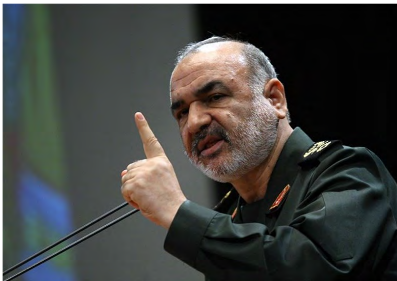
סגן מפקד משמרות המהפכה, חסין סלאמי (תסנים, 20 באפריל 2018).