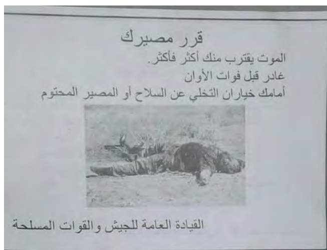
אחד הכרוזים שפוזרו מהאוויר בשכונות אלחג'ר אלאסוד, מחנה הפליטים אלירמוכ ואלתצ'אמן (דף הפייסבוק מחנה אלירמוכ בליבנו, 23 באפריל 2018)

◀ המטה הכללי של צבא סוריה פיזר כרוזים הקוראים לחמושים להניח את נשקם בדרום דמשק. הכרוזים הושלכו מהאוויר בשכונות אלחג'ר אלאסוד, מחנה הפליטים אלירמוכ ואלתצ'אמן. בכרוזים נכתב: "קבל החלטה לגבי גורלך. המוות מתקרב אליך יותר ויותר. עזוב לפני שיהיה מאוחר מדי. ניצבות בפניך שתי אפשרויות: לוותר על הנשק או גורל שאין להימנע ממנו. המטה הכללי של הצבא והכוחות המזויינים " (דף הפייסבוק מחנה אלירמוכ בליבנו, 23 באפריל 2018).