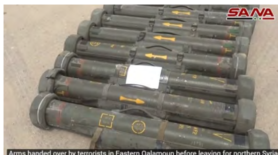
Arms handed over by terrorists in Eastern Qalamoun before leaving for northern Syria

מימין: טנקים שנמסרו לידי צבא סוריה. משמאל: תותח נישא על-גבי משאית, שנמסר לידי צבא סוריה (סאנא, 22 באפריל 2018)