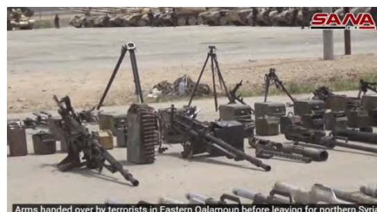
Arms handed over by terrorists in Eastern Qalamoun before leaving for northern Syria

מימין: תותחי נ"מ שנמסרו לידי צבא סוריה. משמאל: מרגמות ופצצות מרגמה (ערוץ היוטיוב סאנא, 22 באפריל 2018)