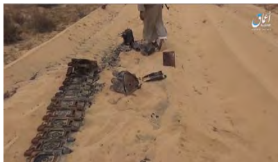
מימין: פעיל דאעש עומד ליד זחל של נגמ"ש של צבא מצרים, שהושמד בפיצוץ מטען חבלה בקרבת שדה התעופה אלג'ורה (אעמאק, 21 באפריל 2018). משמאל: אמיר דאעש במרכז סיני שנהרג ע"י כוחות הביטחון המצריים (עמוד הפייסבוק של דובר צבא מצרים, 18 באפריל 2018)