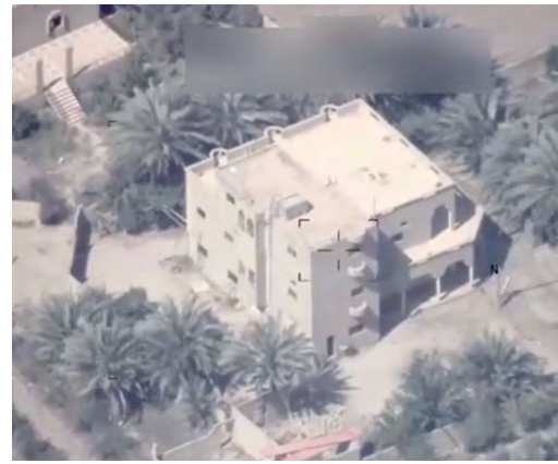
מימין: מטרה של דאעש בסוריה, לפני שהותקפה ע"י חיל האוויר העיראקי. משמאל: המטרה לאחר התקיפה (אלסומריה ניוז, 19 באפריל 2018)