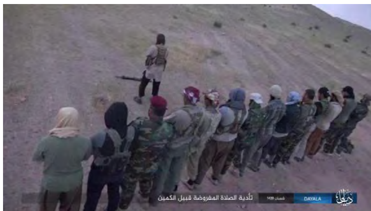
חמישה-עשר פעילי דאעש מתפללים טרם היציאה לאזור הצבת מארבים כנגד לוחמי "הגיוס העממי" בח'אנקין (נאשר, 19 באפריל 2018)