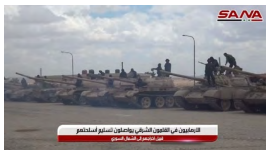
الارهابيون في القلمون الشرقي يحصلون تسليح أسلحتهم من الجيوش في شمال سوريا

מימין: טנקים שנמסרו לידי צבא סוריה. משמאל: תותח נישא על-גבי משאית, שנמסר לידי צבא סוריה (סאנא, 22 באפריל 2018)