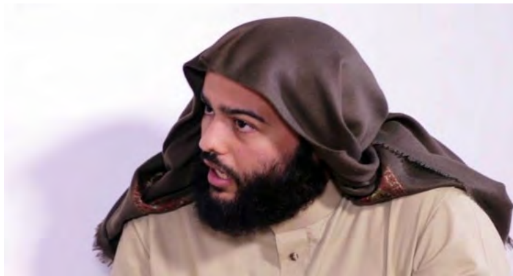
אבו חסן אלמהאג'ר, שמונה בדצמבר 2016 לשמש כדובר הרשמי של דאעש, בעקבות הריגתו של אבו מחמד אלעדנאני, קודמו בתפקיד (אלצבאח, 5 בדצמבר 2016)

מוסד אלפרקאן של דאעש 1 פרסם לאחרונה קלטת-שמע המיוחסת אבו חסן אלמהאג'ר , הדובר הרשמי של הארגון (אורכה כ-50 דקות). זוהי הודעה ראשונה מסוגה מאז נפילת המדינה האסלאמית (נובמבר 2017). 2 היא נועדה לחזק את רוחם של פעילי דאעש במחוזות השונים ולדרבן אותם ולדבוק ב"דרך הג'האד" נגד ה"כופרים" . אלמהאג'ר הדגיש, כי מבחינת דאעש אין כל הבדל בין הלחימה נגד המשטרים המערביים (ובכלל זה מצרים, סעודיה) לבין המלחמה נגד האיבים האחרים (ארה"ב, העם היהודי ואיראן) . בסיום דבריו הוא פנה לחיילי הח'ליפות האסלאמית ולתומכיה וציין, כי הג'האד נגד האויב הרוצה להשתלט על אדמות המוסלמים עומד כיום בפני שלב חדש ובפני פרשת דרכים . הוא קרא לתומכיו לפגוע ברוסיה, איראן וארה"ב, שאותה לדבריו, הצליחו לוחמי הג'האד להתיש.