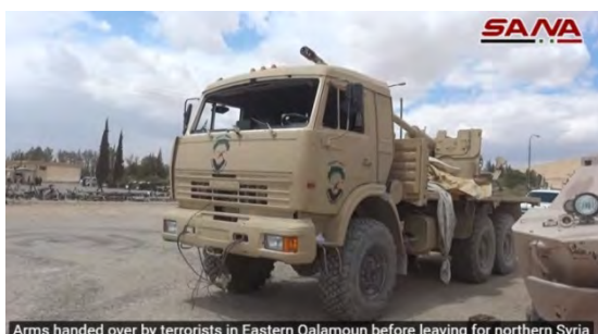
Arms handed over by terrorists in Eastern Qalamoun before leaving for northern Syria

מימין: מחסן התחמושת הגדול עליו השתלט צבא סוריה בהרי אלקלמון המזרחי (מראסלון, 21 באפריל 2018). משמאל: טנקים שנתפסו על ידי צבא סוריה (חשבון הטוויטר @IslamicWorldUpdate, 21 באפריל 2018)