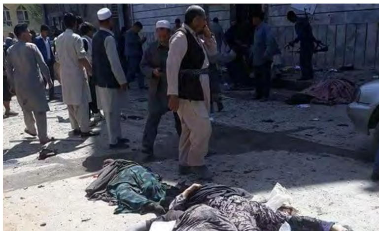
זירת הפיגוע במערב קאבול (אלמיאדין, 22 באפריל 2018)

◀ דאעש דיווח כי הפיגוע בוצע במרכז בחירות בקאבול באמצעות פיצוץ אפוד נפץ, שהיה בידי המחבל המתאבד (אעמאק, 22 באפריל 2018). המחבל המתאבד מכונה קארי עמר הפשוארי (חק, 22 באפריל 2018). על פי שמו המדובר ככל הנראה בפעיל דאעש ממוצא פקיסטאני.