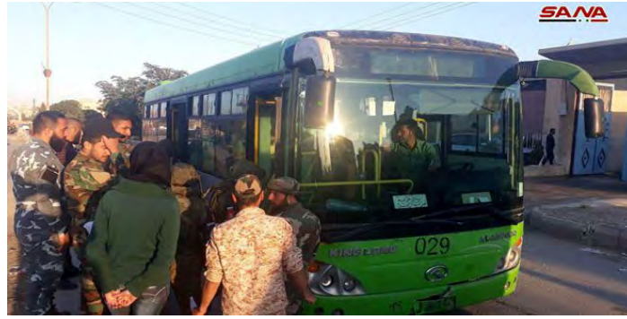
אחד מהאוטובוסים שפינו את פעילי צבא האסלאם ובני משפחותיהם מאזור הרי אלקלמון המזרחי לעבר צפון סוריה (סאנא, 24 באפריל 2018)

צבא האסלאם פרסם כרוז בו הסביר את הסיבות לנסיגת פעיליו מהרי אלקלמון המזרחי ללא קרב ולמסירת כלי נשקו. בין השאר האשים הכרוז את דאעש שהביא במהלך שלוש שנות לחימה להתשתם ולהריגת מאות מפעילי צבא האסלאם בהרי אלקלמון המזרחי. סיבות נוספות שהועלו: אמצעי הלחימה הסורים המתקדמים, איומים רוסיים והרצון לשמור על חיי האזרחים. בכרוז נטען, כי הצד הרוסי התעקש במהלך המשא ומתן על מסירת כל אמצעי הלחימה הכבדים והבינוניים, שברשות פעילי צבא האסלאם, תמורת אי תקיפתן של הערים והעיירות באלקלמון המזרחי (דף הפייסבוק פראת פוסט, 23 באפריל 2018).