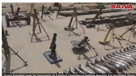
Arms handed over by terrorists in Eastern Qalamoun before leaving for northern Syria

כני שיגור של טילי נ"ט וטילי נ"ט שנמסרו לצבא סוריה (סאנא, 22 באפריל 2018)