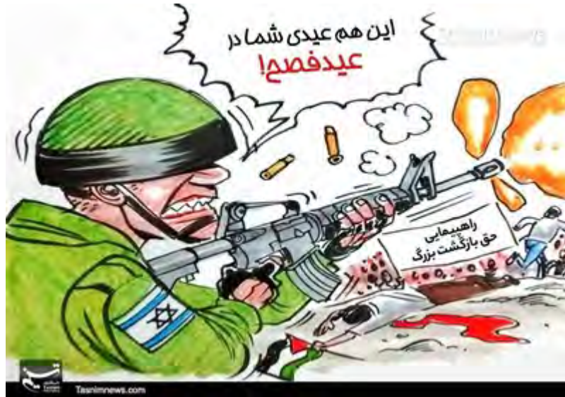
"זה גם החג שלכם בפסח", קריקטורה בתסנים ניוז בעקבות צעדת השיבה, 3 באפריל 2018.

◀ על רקע האירועים בעזה שלח מנהיג איראן, עלי ח'אמנהאי, איגרת לאסמאעיל הניה, בה הדגיש, כי ההתנגדות היא הדרך היחידה להצלת פלסטין והמרשם לרפיו פצעי העם הפלסטיני. הוא ציין, כי איראן רואה בהגנה על הסוגיה הפלסטינית חובה דתית ואנושית החורגת מהתפתחויות הפוליטיות. האיגרת נשלחה בתגובה למכתב, שנשלח על-ידי הניה למנהיג איראן, בו הביע מנהיג חמאס את הערכתו לאיראן על תמיכתה במאבק הפלסטינים נגד ישראל (פארס, 4 באפריל 2018).