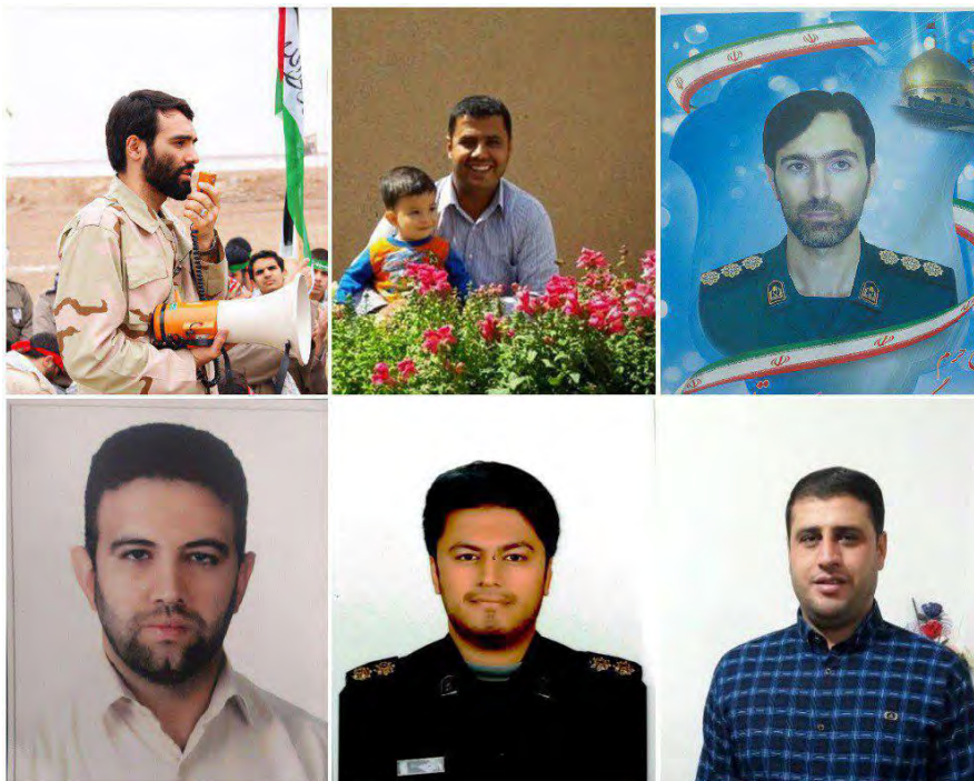
תמונות שישה מבין שבעת האיראנים, שנהרגו בתקיפה בסוריה (תקשורת איראנית, 10 באפריל 2018).

◀ שבעה אנשי משמרות המהפכה, בהם בכיר במערך כלי הטיס הלא מאוישים של משמרות המהפכה בדרגת אלוף-משנה (מהדי דהקאן, Mehdi Dehqan), נהרגו בשבוע שעבר בתקיפת בסיס חיל האוויר הסורי T-4 שבאזור העיר תדמור בסוריה, שיוחסה לישראל. על-פי דיווחים בתקשורת הערבית והישראלית, שימש הבסיס כמרכז שליטה ופיתוח של אנשי משמרות המהפכה וחלק מהמבנים שימשו למערך ייצור של כלי טיס לא מאוישים מהסוג, שאיראן שיגרה לעבר ישראל ב-10 בפברואר, 2018.