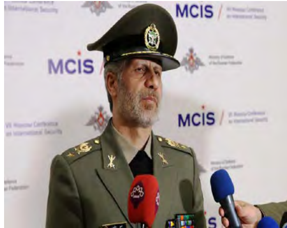
שר ההגנה האיראני במוסקבה (אירנ"א, 4 באפריל 2018).

המוחלט של הטרוריסטים". במהלך ביקורו במוסקבה נפגש חתמי עם סרגיי שויגו, שר ההגנה הרוסי, ודן עמו ביחסים הביטורליים בין רוסיה ואיראן ובשיתוף הפעולה האזורי ביניהן (אירנ"א, 4 באפריל 2018).