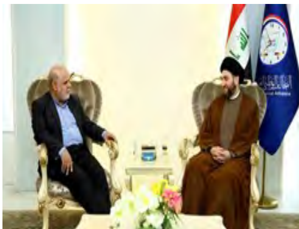
פגישת שגריר איראן בבגדאד עם איש הדת השיעי סיד עמאר חכים (פארס, 5 באפריל 2018).

◀ על רקע הבחירות הכלליות בעיראק הצפויות להתקיים בחודש הבא, נפגש אירג' מסג'די (Iraj Masjedi), שגריר איראן בבגדאד, עם בכירים במערכת הפוליטית העיראקית. ב-5 באפריל 2018 מסרה לשכת נשיא עיראק, כי שגריר איראן נפגש בבגדאד עם נשיא עיראק, פואד מעצום, ודן עמו בהידוק הקשרים בין שתי המדינות. כמו כן נפגש השגריר עם מנהיג המפלגה השיעית "הברית הלאומית", סיד עמאר חכים, ודן עמו בקשרים בין שתי המדינות ובהתפתחויות באזור (פארס, 5 באפריל 2018).