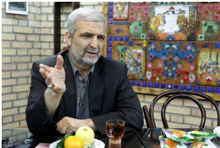
חסן כאט'מי-קמי (ח'בר אונליין, 3 באפריל 2018).

◀ חסן כאט'מי-קמי (Hassan Kazemi-Qomi), שגריר איראן לשעבר בעיראק וחבר צוות המשא ומתן האיראני לשיחות על סוריה באסטנה, התייחס בריאיון לאתר ח'בר אונליין (3 באפריל 2018) להתפתחויות בסוריה ולשיתוף הפעולה בין רוסיה ואיראן בסוריה. הוא ציין, כי איראן ורוסיה חולקות אינטרסים משותפים במאבק בטרור בסוריה ובהתנגדות להגמוניה האמריקאית באזור. רוסיה יכולה לסייע בריסון מדיניות ארה"ב ואיראן יכולה להסתייע בה במאבק נגד ארה"ב והטרור אף על-פי שברור כי לרוסיה יש יעדים רבים ושונים בסוריה. כאט'מי-קמי ציין, כי אין מקום לחשש מפני "בגידת" רוסיה באיראן, משום שהדבר תלוי בהתנהלות נבונה מצד טהראן. הוא הדגיש, כי איראן אינה מסכימה לכל צעד טקטי בו נוקטת רוסיה בסוריה, למשל ההסכמות שלה עם ארה"ב בנוגע ליצירת אזורי מופחתי מתיחות, אך אין בכך כדי למנוע מאיראן להסתייע ברוסיה מול איומים משותפים. הוא העריך, כי המציאות הצבאית בשטח אינה מאפשרת לרוסיה לבגוד באיראן, משום שהיא זקוקה לנוכחותה בסוריה.