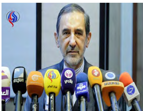
יועצו של מנהיג איראן, עלי-אכבר ולאיתי, במסיבת עיתונאים בדמשק (אל-עאלם, 10 באפריל 2018).

◀ בעקבות התקיפה, איים עלי-אכבר ולאיתי (Ali Akbar Velayati), יועצו הבכיר של מנהיג איראן לעניינים בינלאומיים, בתגובה איראנית כנגד ישראל. ולאיתי, שהגיע ב-10 באפריל 2018 לדמשק כדי להשתתף בוועידה בנושא ירושלים, הצהיר, כי פשעי ישראל לא יישארו ללא מענה וכי הניצחון בסוריה קרוב (אירנ"א, 10 באפריל 2018).