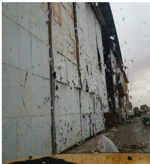
תוצאות התקיפה בבסיס הסורי (תסנים, 11 באפריל 2018).

◀ בעקבות התקיפה, איים עלי-אכבר ולאיתי (Ali Akbar Velayati), יועצו הבכיר של מנהיג איראן לעניינים בינלאומיים, בתגובה איראנית כנגד ישראל. ולאיתי, שהגיע ב-10 באפריל 2018 לדמשק כדי להשתתף בוועידה בנושא ירושלים, הצהיר, כי פשעי ישראל לא יישארו ללא מענה וכי הניצחון בסוריה קרוב (אירנ"א, 10 באפריל 2018).