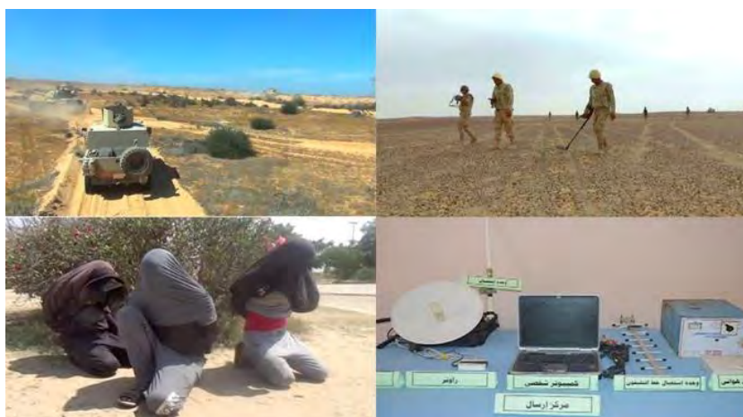
En haut à droite, dans le sens des aiguilles d'une montre : démineurs de l'armée égyptienne à la recherches de mines et d'engins piégés. Station de diffusion de terroristes. Trois détenus. Véhicules blindés de l'armée égyptienne lors d'une activité de sécurité