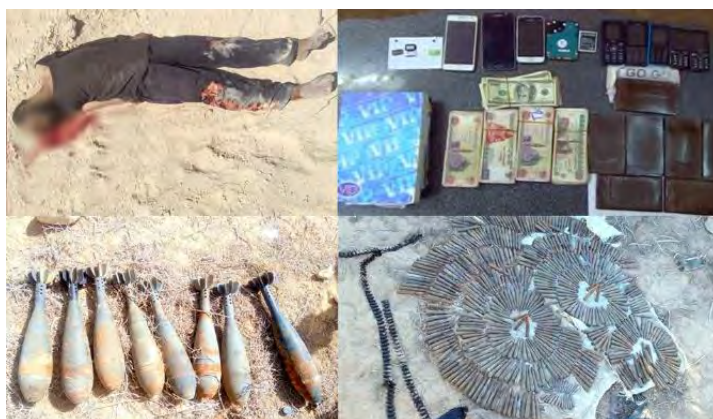
En haut à droite, dans le sens des aiguilles d'une montre : argent liquide, téléphones cellulaires et marijuana trouvés en possession d'un membre de l'Etat islamique qui a été tué dans le Nord du Sinaï. Munitions d'armes légères, huit obus de mortier et corps d'un terroriste (Porte-parole des forces armées égyptiennes, 8 avril 2018)

Centre du Sinaï. Un terroriste a été tué dans le Nord du Sinaï - de l'argent, des téléphones cellulaires et de la marijuana ont été trouvés en sa possession. Quarante-six véhicules de différents types utilisés par des terroristes ont été saisis. 114 motos sans plaque d'immatriculation ont été détruites. 386 cachettes et dépôts contenant des armes et de l'équipement ont été détruits. En outre, 30 engins piégés ont été trouvés et ont été détruits (Porte-parole des forces armées égyptiennes, 8 avril 2018).