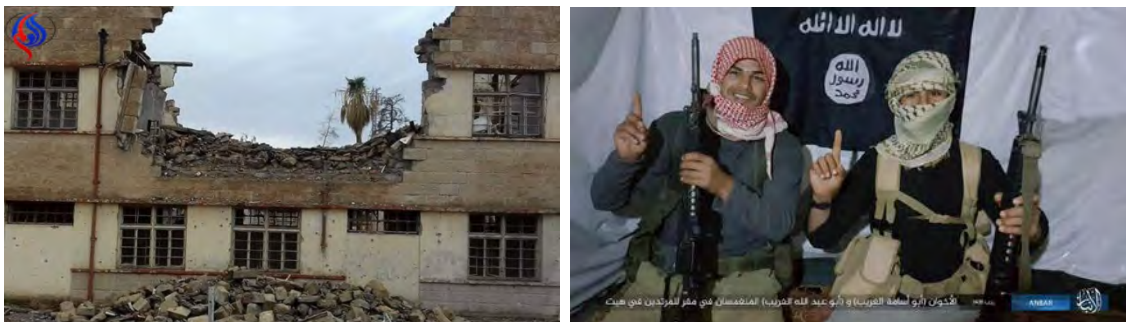
Droite: Les deux frères terroristes suicide de l'Etat islamique qui ont perpétré l'attentat-suicide et la fusillade contre le siège du parti Al-Hall dans la ville de Hit (Site Internet de partage de fichiers, 8 avril 2018). Gauche : Le siège du parti Al-Hall qui a été attaqué (Al-Alam, 8 avril 2018)

► Selon une annonce de la Province d'Al-Anbar de l'Etat islamique, sept gardes de sécurité et militaires ont été tués dans l'attaque. 13 autres personnes ont été blessées, y compris des candidats aux élections et deux hauts fonctionnaires du gouvernement irakien (Site Internet de partage de fichiers, 8 avril 2018). Selon une source iranienne, deux gardes de sécurité ont été tués et cinq autres personnes ont été blessées, y compris un candidat aux élections parlementaires (Al-Alam, 8 avril 2018).