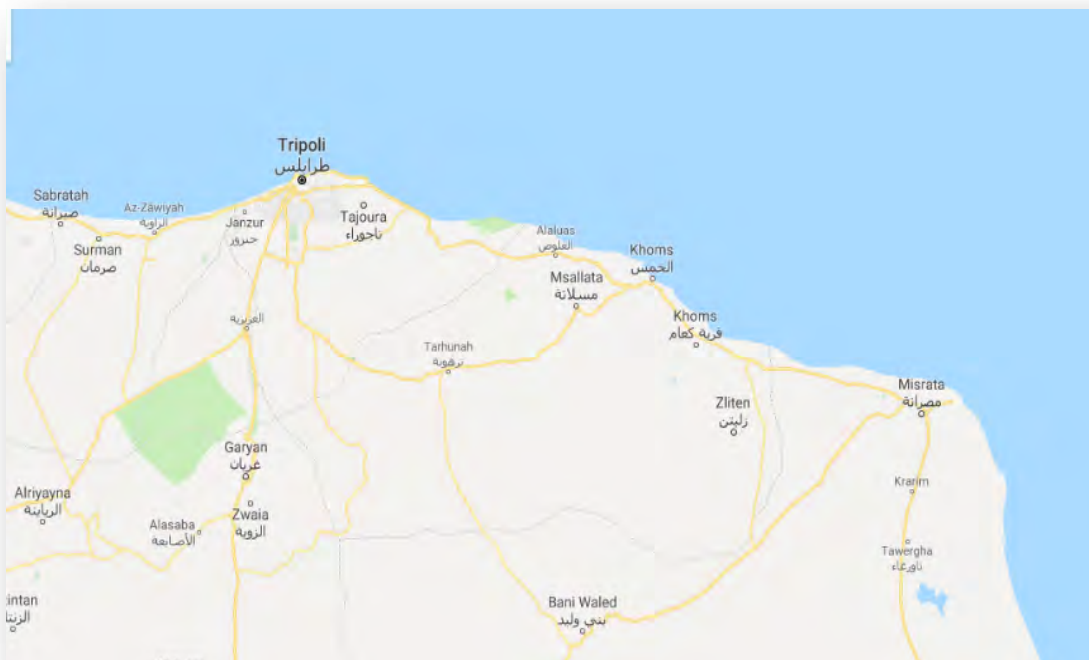
La zone principale de l'opération contre l'Etat islamique : de Tripoli à l'Ouest à Misrata à l'Est et Bani Walid dans le Sud