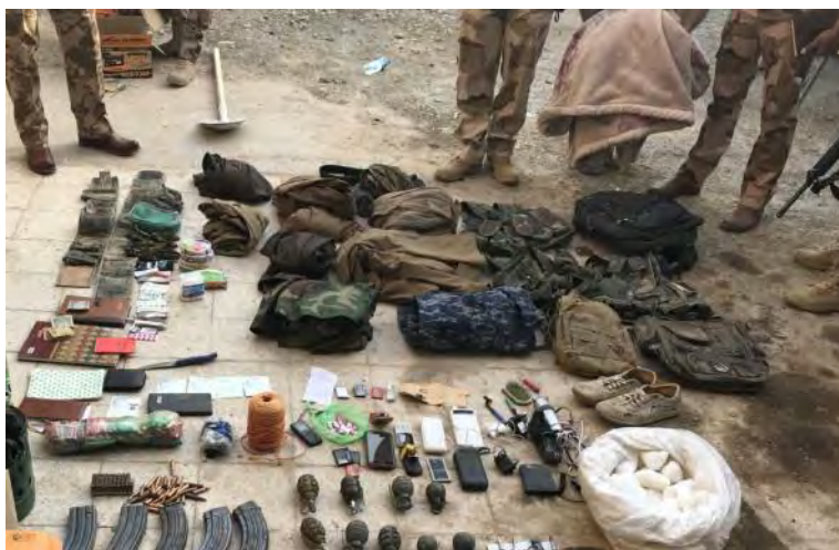
Armes et équipement de l'Etat islamique trouvés dans une cachette au Sud de Baqubah