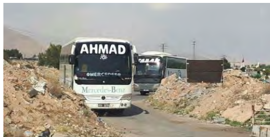
Droite : Bus utilisés pour évacuer les membres de Jaysh al-Islam de Douma (Télévision syrienne, 8 avril 2018). Gauche : Les bus, avec des bâtiments en ruines en arrière-plan (Al-Hadath Suriya, 8 avril 2018)