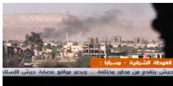
Droite : La ville de Douma attaquée par l'armée syrienne. Gauche : Soldats de l'armée syrienne sur la route du Sud menant à la ville de Douma (Sama, 8 avril 2018)