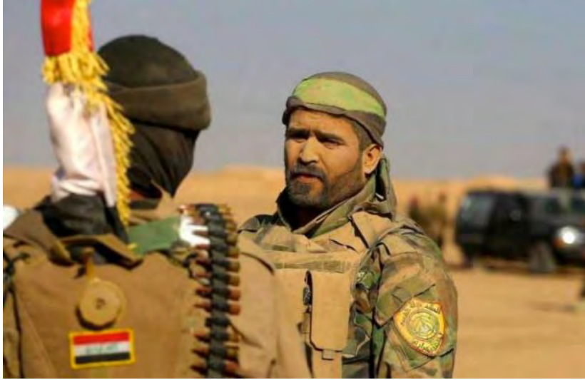
مقاتلو "الحشد الشعبي" خلال أعمالهم الأمنية في منطقة صحراوية.