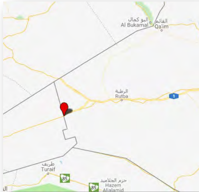
معبر طربيل الحدودي المؤدي من الرطبة إلى الأردن.

◀ أطلق الجيش العراقي عملية ضد تنظيم الدولة الإسلامية في صحراء غرب محافظة الأنبار. وفي هذه العملية التي تهدف إلى العثور على مخابئ عناصر تنظيم الدولة الإسلامية تشارك كذلك قوات الحشد العشائري السنية في محافظة الأنبار وسلاح الجو العراقي وطائرات للتحالف الدولي. وتتم العملية في محورين: الأول في المحيط الصحراوي إلى الجنوب من الرطبة؛ والثاني في المحيط الغربي للرطبة، على مشارف معبر طربيل الحدودي بين العراق والأردن (السومرية، 27 آذار/ مارس 2018).