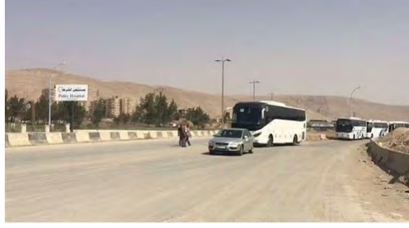
على اليمين: حافلات أتت لإخلاء المتمردين وعوائلهم عن طريق معبر عربين باتجاه إدلب (الحدث سوريا، 25 آذار/ مارس 2018). على اليسار: تحرير ثمانية جنود من الجيش السوري كان المتمرّدون يحتجزونهم وتسليمهم للجانب الروسي في بلدة عربين صفحة فيسبوك فرات بوست [Furat Post]، 24 آذار/ مارس 2018).