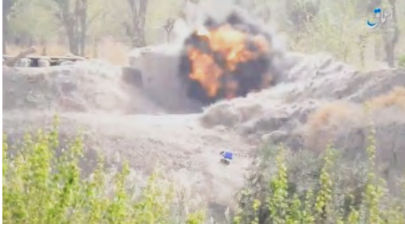
مقطع من شريط مصور نشره تنظيم الدولة الإسلامية يسجل فيه إصابة قذيفة مضادة للدبابات تم إطلاقها على موقع للجيش السوري على أطراف البوكمال (أعماق، 23 آذار/ مارس 2018).

◀ وقالت قناة المنار نقلاً عن مصادر في المعارضة السورية إن تنظيم الدولة الإسلامية قد عاد لتدريب الأطفال في محيط دير الزور. ولهذا الغرض بنى تنظيم الدولة الإسلامية قاعدة عسكرية لوحدة "أشبال الأسود" التابعة للخلافة (وهذه هو اسم وحدة الأطفال في تنظيم الدولة الإسلامية). كما وجاء في التقرير أن تنظيم الدولة الإسلامية يقوم بتجنيد عدد كبير من الأطفال السوريين والأجانب لهذه الوحدة للقيام بعمليات انتحارية (سبوتنيك، 23 آذار/ مارس 2018).