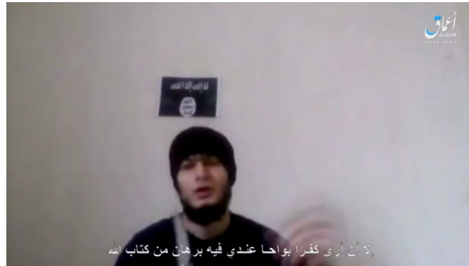
إرهابي تنظيم الدولة الإسلامية يبيع أبو بكر البغدادي (أعماق، 21 آذار/ مارس 2018).

◆ تهديد بقتل من ضلوا عن طريق الدين: " والله إننا لنرى خوفكم منا. والله لن تنعموا بالأمن والطمأنينة أينما كنتم. والله سنذبكم وسنقتلكم ونفخ سياراتكم ونشرب دمانكم، لن تنعموا بالأمن ما دمتم على كفر إلى أن تعودوا إلى دين الله...". (أعماق، 21 آذار/ مارس 2018).