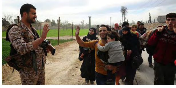
على اليمين: جندي سوري يحيي السكان السوريين الخارجين من الغوطة الشرقية (سانا، 24 آذار/ مارس 2018). على اليسار: بث مباشر من أحد المعابر الإنسانية في الغوطة الشرقية (موقع وزارة الدفاع الروسية eng.mil.ru).