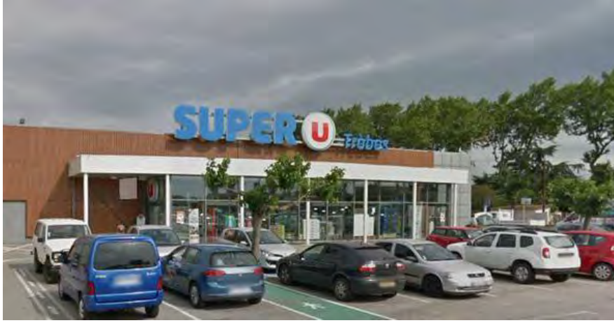
متجر "سوبر يوتيرب"

◀ وأصل الإرهابي سفره إلى مدينة تريب (على مسافة حوالي ثمانية كيلومترات إلى الشرق من مدينة كراكسون)، وهناك اقتحم حانوتاً وهو يهتف "الله أكبر" و"انتقاماً لسوريا". كان الإرهابي يحمل مسدساً وسكيناً وربما كان معه أيضاً عبوات ناسفة مُرتجلة. وعند دخوله الحانوت قتل زبوناً وقتل أحد العاملين في الحانوت. فر من الحانوت عشرات الأشخاص واختبأ منهم حوالي عشرون شخصاً في غرفة التبريد خلف الحانوت.