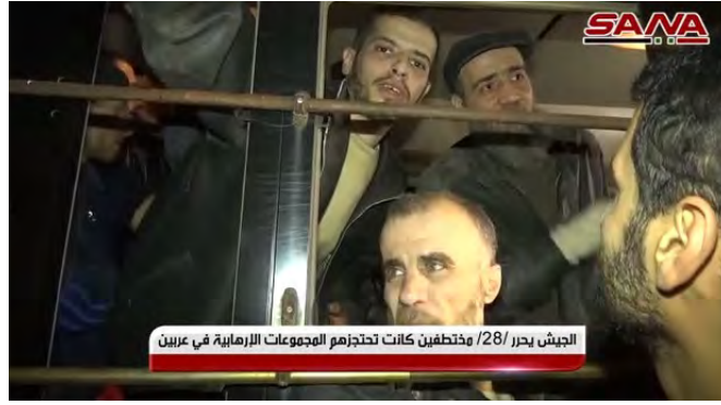
بعض المخطوفين الذين حررهم الجيش السوري (قناة يوتيوب سانا، 26 آذار/ مارس 2018).

◆ وأثناء تمشيط القوات السورية لبلدة عين حرما، على مبعده ما يقارب 3.5 كلم إلى الشرق من دمشق، المختلة من المتمردين، عثرت القوات السورية على مصنع للقذائف الصاروخية والعبوات الناسفة. كما وتم العثور في المدينة على شبكة أنفاق استخدمت لنقل وتخزين الأسلحة (وكالة الأنباء السورية، 23 آذار/ مارس 2018). وفي البلدة ذاتها أطلق الجيش السوري سراح 28 مخطوفاً كانوا محتجزين لدى تنظيمات المتمردين منذ سنة ونصف السنة. كما وسيطر الجيش على مدينة حرستا.