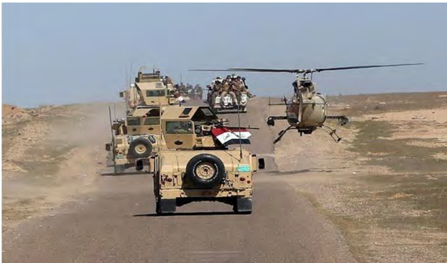
سيارات ومروحية للجيش العراقي أثناء العملية ضد تنظيم الدولة الإسلامية (السومرية، 27 آذار/ مارس 2018).