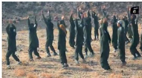
Занятия по физической подготовке боевиков группировки "Армия Халеда Бин Аль Валида" (сайт "ахбар аль муслемин", 25 февраля 2018 г.)