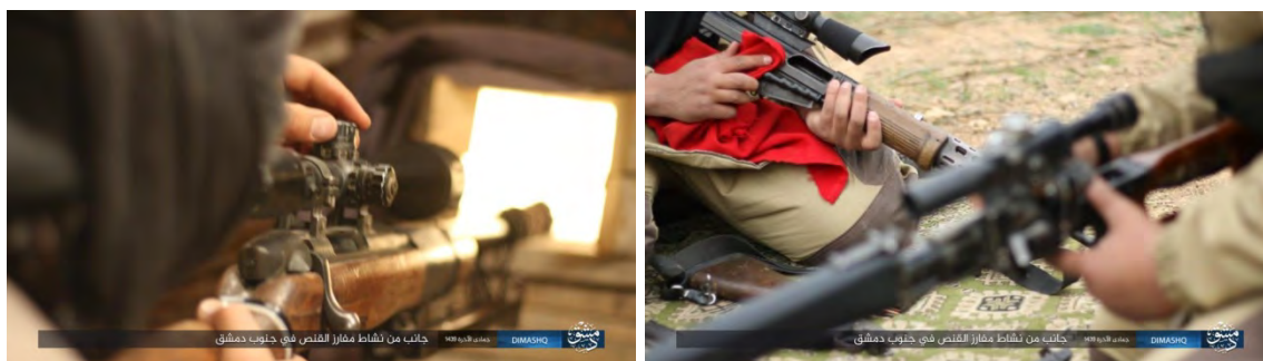
Справа: снайперы организации ИГИЛ занимаются чисткой своего оружия. Слева: снайпер организации ИГИЛ проводит калибровку телескопического прицела (сайт "Нашер", 6 марта 2018 г.)

► Округ Дамаск организации ИГИЛ опубликовал несколько снимков снайперской группы организации, действующей в южной части Дамаска. На снимках видны: подготовка снайперской позиции путем пробивания бойницы в стене, калибровка телескопических прицелов, ведение наблюдения и выстрел в направлении человека в гражданской одежде, который стоит на крыше здания (сайт "Нашер", 6 марта 2018 г.).