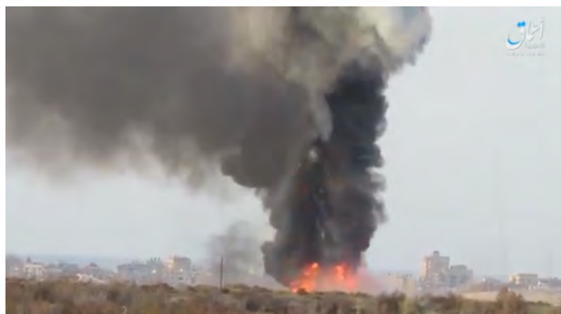
Танк египетской армии горит после подрыва на взрывном устройстве организации ИГИЛ к югу от г. Аль Ариш (сайт "ахбар аль муслемин", 3 марта 2018 г.)

► 1-го марта 2018 г. боевики округа Синай организации ИГИЛ применили взрывное устройство против танка египетской армии (модели М 60), к югу от г. Аль Ариш. Организация ИГИЛ опубликовала ролик, в котором снят горящий танк, а также момент детонации находящегося внутри танка боекомплекта (сайт "ахбар аль муслемин", 3 марта 2018 г.).