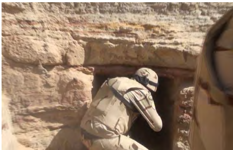
Солдат египетской армии у входа в подземное укрытие, обнаруженное в ходе операции (официальная страница Фейсбук пресс-секретаря вооруженных сил Египта, 4 марта 2018 г.)