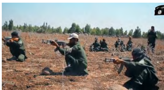
Занятия по стрелковой и огневой подготовке боевиков группировки "Армия Халеда Бин Аль Валида" (сайт "ахбар аль муслемин", 25 февраля 2018 г.)