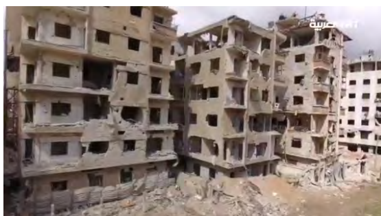
Кадры разрушений в районе Восточная Аль Гута (аккаунт Твиттер TRTalarabiya @ العربية TRT قناة , 1 марта 2018 г.)