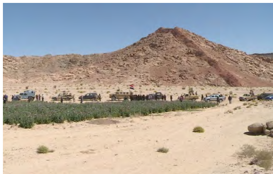
Справа: моторизованная колонна египетских сил безопасности в ходе проведения операции. Слева: солдаты египетской армии в ходе проведения операции (официальная страница Фейсбук пресс-секретаря вооруженных сил Египта, 4 марта 2018 г.)