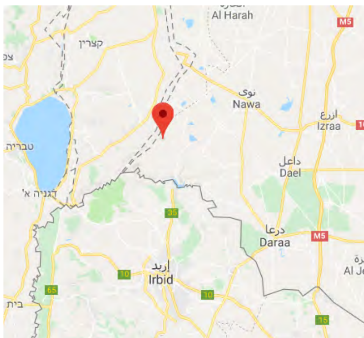
Село Джамала