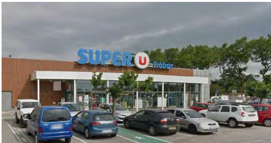
סופרמרקט "סופר יו טרב" (חשבון הטוויטר @CrimeTerrorNexus, 23 במרץ 2018).

◀ המחבל המשיך בניסיעה לעיירה טרב (כשמונה ק"מ ממזרח לקרקסון), שם הוא נכנס למרכול תוך כדי צעקות "אללה אכבר" ו"נקמה עבור סוריה". המחבל היה חמוש באקדח, סכין ויתכן גם במטעני חבלה מאולתרים. עם כניסתו הוא ירה למוות בלקוח ובעובד המרכול. עשרות בני אדם, שהיו במרכול, נמלטו וכעשרים איש הסתתרו בחדר קירור מאחורי המרכול.