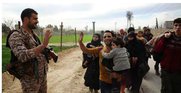
מימין: חייל סורי מנופף לשלום לתושבים סורים המפונים מאלע'וטה המזרחית (סאנא, 24 במרץ 2018). משמאל: שידור חי מאחד המעברים ההומניטריים באלע'וטה המזרחית ( אתר משרד ההגנה הרוסי eng.mil.ru ).