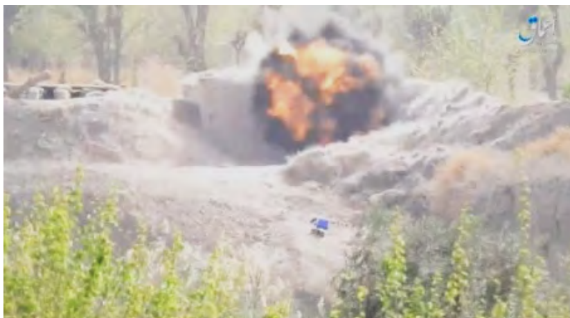
מתוך סרטון של דאעש המתעד את פגיעת רקטת נ"ט, ששוגרה לעבר עמדה של צבא סוריה בפאתי אלבוכמאל (אעמאק, 23 במרץ 2018).

◀ מקורות אמריקאים שבו והביעו חשש מהתבססות פעילי דאעש במרחב שפונה ע"י כוחות SDF (קרי, מורד עמק הפרת). על פי מקורות כורדיים התגייסו ללחימה נגד תורכיה בעפרין כ-1,700 לוחמי SDF . להלן התבטאויות אמריקאיות cbuat: