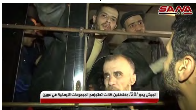
כמה מהחטופים, ששחררו ע"י צבא סוריה (ערוץ היוטיוב סאנא, 26 במרץ 2018).