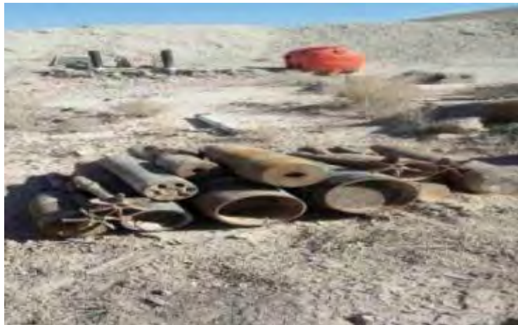
אמצעי לחימה, שאותרו על-ידי כוחות הביטחון העיראקים במחנה אימונים של דאעש באזור מדברי במחוז אלאנבאר (סוכנות הידיעות העיראקית, 19 במרץ 2018).

◆ משרד ההגנה העיראקי דיווח כי אותר מחנה אימונים של דאעש באזור המדברי של מחוז אלאנבאר . במחנה נמצאו אמצעי חבלה (סוכנות הידיעות העיראקית, 19 במרץ 2018).