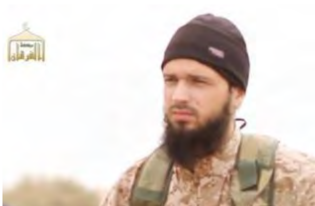
מקסים הושאר המכונה אבו עבדאללה הצרפתי שנהרג בסוריה בניסיונות שאינן ידועות (אלערב אליום [Al 'Arab Al Youm], 15 במרץ 2018).