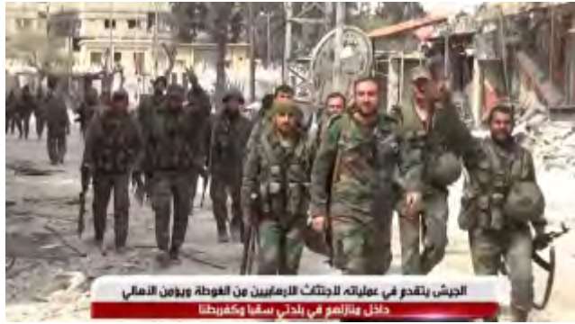
חיילי צבא סוריה בעיר סקבא, שנכבשה מידי כוחות המורדים (ערוץ היוטיוב סאנא, 18 במרץ 2018).

◀ לאור ההצלחות באלע'וטה המזרחית ערך בשאר אלאסד, נשיא סוריה, סיור מתוקשר היטב בקרב חיילי צבא סוריה ובקרב אזרחים באזור. סרטון המתעד את הביקור הועלה ליו טיוב (ערוץ היוטיוב של נשיאות סוריה [PresidencySy], 18 במרץ 2018).