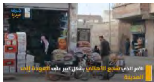
מימין: חנות שנפתחה באלרקה (Jorf New, 16 במרץ 2018). משמאל: מחנה פליטים מחוץ לעיר (Jorf New, 20 במרץ 2018).