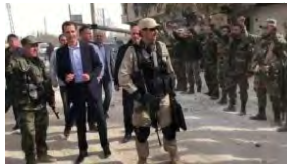
ביקור בשאר אלאסד, נשיא סוריה בקרב חיילים וקצינים מצבא סוריה באזור ג'סרין באלע'וטה המזרחית (מראסלון, 18 במרץ 2018).