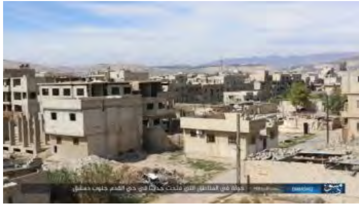
שכונת אלקדם, ממערב למחנה הפליטים אלירמוק, בדרום העיר דמשק (אח'באר אלמסלמין, 15 במרץ 2018).