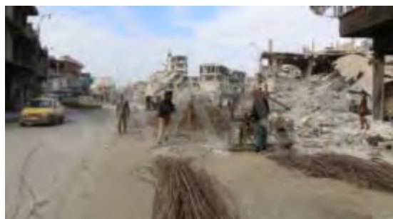
מימין: ההרס בעיר אלרקה (סמארט ניוז, 28 בפברואר 2018). משמאל: מרכז העיר אלרקה (Jorf New, 16 במרץ 2018).