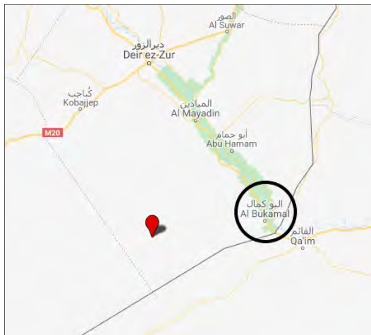
תחנת T2 לשאיבת נפט והעיר אלבוכמאל.

◀ השבוע דווח, כי פעילי דאעש השתלטו על תחנת T2 לשאיבת נפט, כשבעים ק"מ ממערב לאלבוכמאל, שהייתה בשליטת צבא סוריה. דאעש פוצץ במקום ארבע מכוניות תופת, שגרמו ל-23 הרוגים בקרב הכוחות הסורים. כמו כן נפלו בשבי דאעש 17 חיילים סוריים. דאעש ספג תשעה הרוגים ולמעלה מ-15 פצועים. כוחות הצבא הסורי בסיוע חיל אוויר נכשלו להשיג לידיהם את תחנת T2 (אח'באר אלסורין, 19 במרץ 2018; ענד בלדי, 18 במרץ 2018).