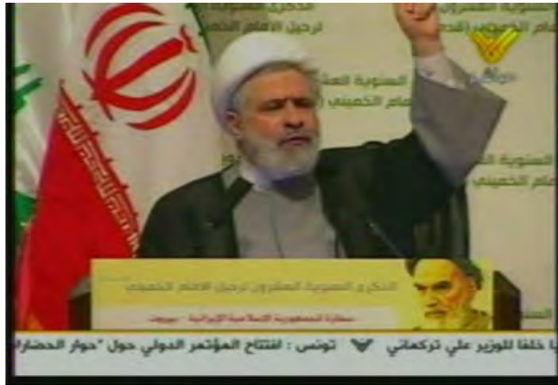
שיח' נעים קאסם, סגן מזכ"ל חזבאללה נואם בטקס שקיימה שגרירות איראן בלבנון ביום השנה למותו של ח'מיני (אלמנאר, 3 ביוני 2009).

◆ בהמשך הראיון נתן שיח' נעים קאסם דוגמא באשר למשמעות ההנחיה ההלכתית, שחזבאללה חייב לקבל מח'אמנהאי: אם, למשל, ח'אמנהאי יורה שלחימה בישראל הינה חובה הלכתית אזי "ההרוג בלחימה נגד ישראל יהפוך לשהיד, למיטב הבנתנו". אולם, והיה והמנהיג ח'אמנהאי יקבע כי המלחמה אסורה "אז ההרוג ילך לגיהנום, מכיוון שלא היה לו היתר ללכת למלחמה הזאת". שיח' נעים קאסם הדגיש, כי חזבאללה אינו יכול לצאת למבצע נגד ישראל ללא הצדקה דתית מחכם הדת השליט באיראן 2 , אולם, לדבריו, השליט חכם הדת אינו אמור להיכנס לפרטים אודות אופן ביצוע ההחלטה (העיתוי, אמצעי הלחימה הנחוצים וכו') והדבר נותר בידי חזבאללה.