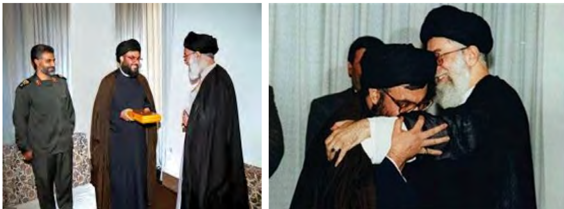
מימין: מנהיג איראן ח'אמנהאי ומזכ"ל חזבאללה נצראללה (תסנים, 12 בנובמבר 2014). משמאל: מנהיג איראן ח'אמנהאי, מזכ"ל חזבאללה נצראללה ומפקד כוח קדס של משמרות המהפכה, קאסם סלימאני (אתר המנהיג העליון, 11 באוגוסט 2016).

◀ נאום נצראללה שב ומעיד על עוצמת הקשר בין איראן לחזבאללה. קשר זה התחזק בשנים האחרונות אף יותר לנוכח הרחבת משימותיו של חזבאללה במהלך מלחמת האזרחים הסורית. איראן מצידה רואה בחזבאללה את הזרוע האסטרטגית המועדפת שלה המשרתת את המערכה נגד ישראל, את מדיניותה בסוריה, את חתרנותה במזרח התיכון ואת חתירתה להגמוניה אזורית. מעורבותו הנרחבת והיעילה של חזבאללה בלחימה בסוריה והסיוע שהוא מגיש למיליציות השיעיות הפרו-איראניות בעיראק ובתימן , המחישו לאיראנים היטב את חשיבותו של חזבאללה ככלי המרכזי לקידום האינטרסים האזוריים שלהם. ◀ הכחשת דברי נצראללה, בתגובה לביקורת עזה שהתעוררה בלבנון, מעידה על העדפת חזבאללה לנסות לעמעם את כפיפותו המוחלטת להנהגה האיראנית ולהימנע מהודאה פומבית ומפורשת, כי נאמנותו לאיראן גוברת על נאמנותו למדינה הלבנונית, למוסדותיה ולחוקתה. שכן, הודאה כזו מעוררת רגישות מיוחדת, במיוחד בעת הנוכחית, לקראת הבחירות הפרלמנטריות הצפויות להתקיים בלבנון במאי 2018; ולנוכח הביקורת הגוברת כלפי חזבאללה וקשריה עם איראן הן בתוך לבנון והן בעולם הערבי בהובלת ערב הסעודית.