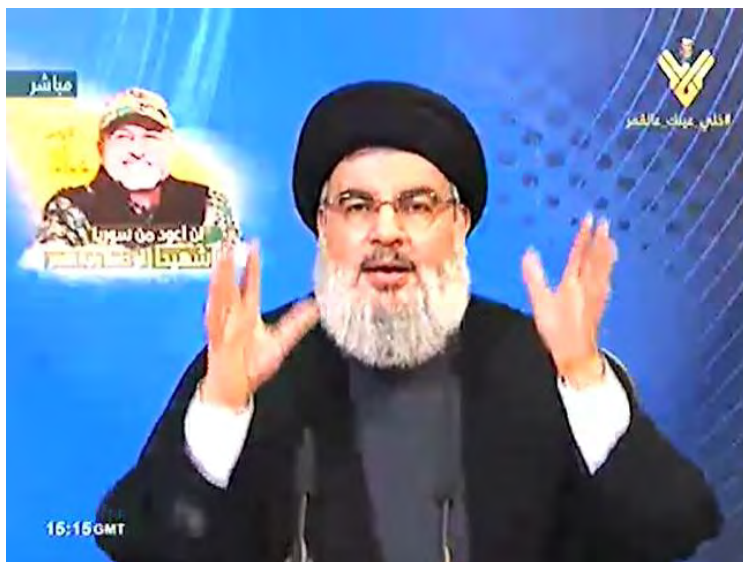
מזכ"ל חזבאללה חסן נצראללה בנאומו ב-24 ביוני 2016.

◀ דוגמה נוספת להתבטאות אודות התלות המוחלטת של חזבאללה באיראן ניתן למצוא בנאום חסן נצראללה, ב-24 ביוני 2016. נצראללה ציין, כי כל תקציבו מגיע ישירות מאיראן ולא באמצעות הבנקים הלבנוניים ("תקציב חזבאללה, משכורות, כספים, אוכל, שתייה, נשק, כל אלה מגיעים מאיראן... כל עוד יש באיראן כסף, יש לנו כסף"). נצראללה הודה למנהיג איראן ח'אמנהאי על תמיכתו בחזבאללה לאורך כל שנות קיומו הנמשכת לדבריו עד היום. 3