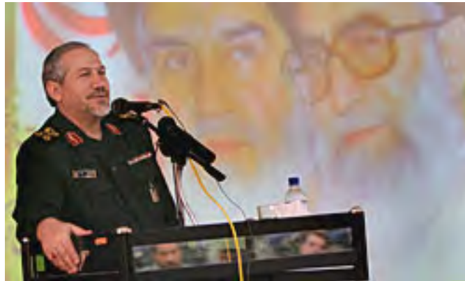
סיד יחיא רחים צפוי במהלך נאום שבו הציג את נצראללה כ"חייל" של ח'אמנהאי. ברקע תמונות ח'מיני וח'אמנהאי (סוכנות פארס, 16 בנובמבר 2008)

◀ ב-2 ביוני 2012, העניק סיד יחיא רחים צפוי, מפקד משמרות המהפכה לשעבר, ששימש אז יועצו הביטחוני של המנהיג ח'אמנהאי, ראיון לערוץ הטלוויזיה PressTV. בראיון התייחס צפוי, בין השאר, למעורבות חזבאללה בעימות אפשרי בין איראן לישראל. צפוי ציין, כי ברשות חזבאללה אלפי רקטות ואם ישראל תרצה לפגוע באיראן, הרי שבסבירות גבוהה חזבאללה יפעל נגדה. רחים צפוי המשיך ואמר, כי הוא רואה [במנהיג חזבאללה] חסן נצראללה "חיל של המנהיג ח'אמנהאי". הוא הוסיף, כי גם לאיראן יש יכולת להכות בישראל והטילים ארוכי הטווח שלה מסוגלים לכך: "אין אף נקודה בישות הציוני שאינה בטווח הטילים שלנו" (Press TV, 2 ביוני 2012). הצהרה דומה השמיע צפוי ב-2008: "... סיד חסן נצראללה רואה עצמו כחייל של מנהיג איראן ואנשי חזבאללה לוקחים דוגמא מהנשים והגברים האמיצים של איראן" (סוכנות הידיעות האיראנית פארס, 16 בנובמבר 2008).