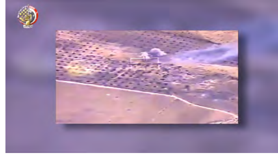
"מטרות טרור", שנפגעו בתקיפת כלי טיס של חיל האוויר המצרי.