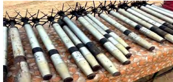
מימין: רקטות גראד, שאותרו על-ידי צבא מצרים במהלך פעילות ביטחונית. משמאל: טילי נ"ט "אהראם", גרסת ייצור מצרית לטול הנ"ט הרוסי סאגר (10 במרץ 2018). 4