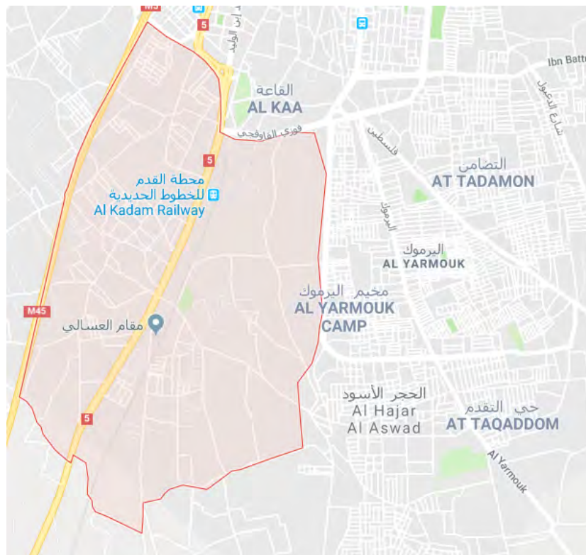
שכונת אלקדם (באדום) ממערב למחנה הפליטים אלירמוק.

◀ השבוע נמסר, כי בינתיים הושג הסכם בין הכוחות הסורים לארגוני המורדים לפינוי אזרחים ופעילים חמושים מהשכונה אלקדם, שממערב למחנה הפליטים אלירמוק. נמסר כי כ-1,800 חמושים ובני משפחותיהם יצאו ב-13 במרץ 2018 לאזור אדלב בפיקוח הסהר האדום 2 (ח'טוה, סמא, 12 ו-13 במרץ 2018). דאעש מצדו טען, כי המשטר הסורי גיבש הסכם עם ארגוני המורדים במסגרתו ימסרו עמדות המורדים, שבשכונות אלקדם לידי צבא סוריה. בתמורה לכך הסכימו כוחות המשטר לאפשר יציאת 500 פעילים חמושים מהמטה לשחרור אלשאם ומארגוני מורדים אחרים לעבר מרחב אדלב. בתגובה תקף דאעש עמדות צבא סוריות בשכונת אלקדם. דאעש טען כי בתקיפה נהרגו עשרה חיילי צבא סוריה (אלחק, אח'באר אלמסלמין, 13 במרץ 2018).