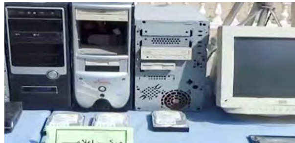
מימין: מחשבים, כוננים ומסך מחשב, שהיו חלק מציוד של מרכז ההסברה של מחוז סיני של דאעש. משמאל: חוברות ודפים מתוך שבועון דאעש אלנבא' שנמצאו במרכז ההסברה (עמוד הפייסבוק הרשמי של הכוחות המזוינים, 10 במרץ 2018).