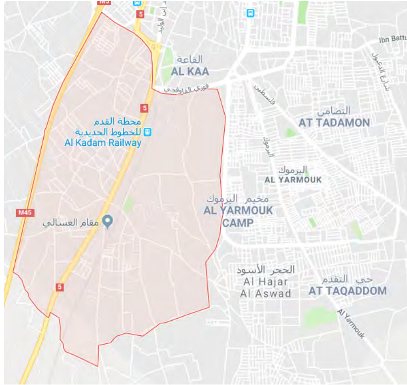
حي القدم (باللون الأحمر) إلى الغرب من مخيم اليرموك للاجئين.

◀ في أعقاب سقوط الغوطة الشرقية، يخشى تنظيم الدولة الإسلامية من تحويل القوات السورية لمهاجمة المنطقة التي يسيطر عليها إلى الجنوب من دمشق (تحديداً مخيم اليرموك للاجئين). وعليه فقد عمل تنظيم الدولة الإسلامية على تحصين المدخل على شارع لوبيا في وسط مخيم اليرموك للاجئين. حيث وضع عناصر التنظيم براميل حديدية مملوءة بالتراب ونصبوا العرش المظلة للوقاية من الغارات الجوية (قلب الحديث، 8 آذار/ مارس 2018). ◀ وأفادت التقارير هذا الأسبوع عن التوصل إلى اتفاق بين القوات السورية وبين تنظيمات المتمردين لإخلاء المواطنين والعناصر المسلحة من حي القدم إلى الغرب من مخيم اليرموك. وأفادت التقارير عن خروج حوالي 1800 مسلح وأفراد عائلاتهم في 23 آذار/ مارس 2018 من حي القدم باتجاه منطقة إدلب تحت إشراف منظمة الهلال الأحمر 2 (خطوة، سما، 12-13 آذار/ مارس 2018). أما تنظيم الدولة الإسلامية من جهته فقد قال إن النظام السوري قد اتفق مع تنظيمات المتمردين على أن تقوم تلك التنظيمات بتسليم مواقعها في حي القدم إلى الجيش السوري. وبالمقابل وافقت القوات السورية على خروج حوالي 500 مسلح من هيئة تحرير الشام وغيرها من تنظيمات المتمردين إلى محيط إدلب. ورداً على ذلك قام تنظيم الدولة الإسلامية بمهاجمة مواقع الجيش السوري في حي القدم. وزعم تنظيم الدولة الإسلامية بسقوط عشرة جنود من الجيش السوري جراء ذلك الهجوم (الحق، أخبار المسلمين، 13 آذار/ مارس 2018).