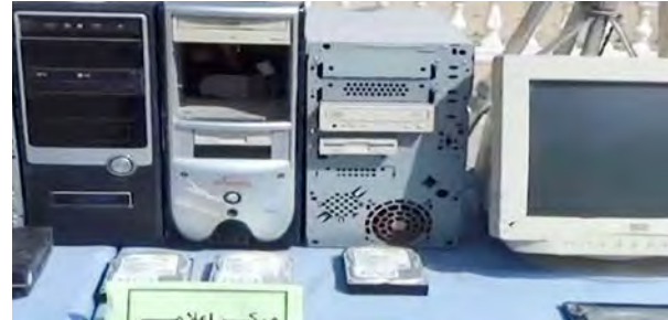
على اليمين: أجهزة كمبيوتر ومحركات أقراص وشاشة كانت تُستخدم في المركز الإعلامي التابع لولاية سيناء في تنظيم الدولة الإسلامية. على اليسار: كراسات وصفحات من أسبوعية النبا الصادرة عن تنظيم الدولة الإسلامية تم العثور عليها في المركز الإعلامي