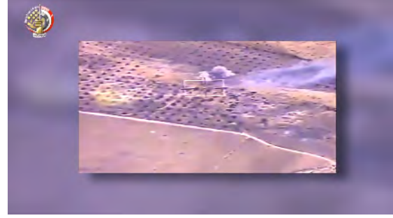
"أهداف إرهابية" تم ضربها بغارة لطائرات سلاح الجو المصري (صفحة فيسبوك الرسمية للقوات المسلحة، 10 آذار/ مارس 2018).