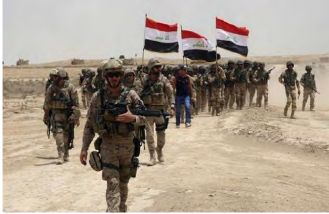
الجيش العراقي أثناء العمليات الأمنية (وكالة الأنباء العراقية، 11 آذار/ مارس 2018).

◀ واصلت قوات المن العراقية هذا الأسبوع عملياتها لملاحقة خلايا تنظيم الدولة الإسلامية المحلية في أنحاء العراق، حيث أسفرت العمليات عن مقتل واعتقال عناصر من تنظيم الدولة الإسلامية وضبط أسلحة كثيرة. وتمحورت عمليات القوات العراقية وقوات "الحشد الشعبي" (المليشيات الشيعية) هذا الأسبوع في منطقة كركوك 3 . وأعلن "مصدر أمني" عن انطلاق عملية أمنية واسعة النطاق لتنظيف قرى إلى الجنوب الغربي من كركوك من عناصر وخلايا تنظيم الدولة الإسلامية (وكالة الأنباء العراقية، 11 آذار/ مارس 2018).