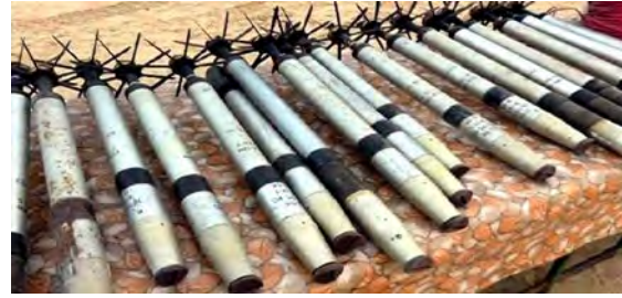
على اليمين: صواريخ جراد عثر عليها الجيش المصري أثناء الأعمال الأمنية. على اليسار: صاروخ "أهرام" المضاد للدبابات، وهي نسخة مصرية الصنع لصاروخ "ساجر" الروسي (صفحة فيسبوك الرسمية للقوات المسلحة، 10 آذار/ مارس 2018). 4