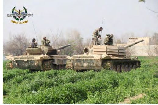
دبابات الجيش السوري أثناء الهجوم في منطقة الغوطة الشرقية (بطولات الجيش السوري، 11 آذار/ مارس 2018; قناة يوتيوب سانا، 12 آذار/ مارس 2018).

◀ وفقاً لتقارير الجيش السوري والإعلام السوري فقد نجحت القوات السورية في احتلال حوالي 60% من مساحة الغوطة الشرقية وتقطيع المنطقة على ثلاثة أجزاء ( صحیح حتى 12 آذار/ مارس 2018). القسم الشمال تسيطر عليه التنظيمات المتمردة ويشمل القطيفه والرحيبه؛ وفي القسم الجنوبي للتنظيمات المتمردة تقع دوما وحريستا وعبرين. ويفصل بين القسمين "دهليز" احتلته قوات النظام السوري وتقع فيه بلدة عدرا (على مبعده ما يقارب 25 كلم إلى الشمال الشرقي من دمشق). وإلى الشمال من "الدهليز" بين تلك المنطقتين تقع مقاطعة أخرى يسيطر عليها جيش سوريا قرب الشارع الرئيسي (M-5) المؤدي من دمشق إلى الشمال (انظروا الخارطة).