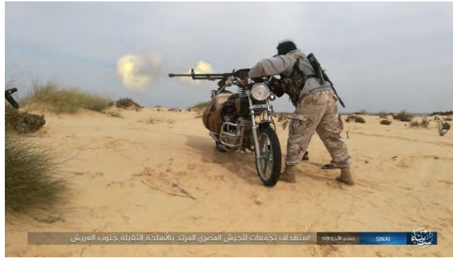
عنصر من تنظيم الدولة الإسلامية يطلق النار من مدفع رشاش ثقيل محمول على دراجة نارية على موقع احتشاد لقوة عسكرية مصرية في جنوب العريش (أخبار المسلمين، 4 آذار/ مارس 2018).

◀ أفادت ولاية سيناء في تنظيم الدولة الإسلامية في 3 آذار/ مارس 2018 بأن عناصر التنظيم قد أصابوا ودمروا تسع سيارات مصفحة للجيش المصري. ووفقاً لما جاء في بيان تنظيم الدولة الإسلامية فقد تمت تلك الإصابات في مناطق مختلفة من سيناء: جنوب الشيخ زايد (إصابة دبابتين بعبوات ناسفة); جنوب العريش (تدمير دبابة); منطقة سبيكة إلى الغرب من العريش (إصابة سيارتين مصفحتين بعبوات ناسفة). كما وأفاد تنظيم الدولة الإسلامية أن قناصة من التنظيم قد قتلوا وجرحوا ما لا يقل عن ستة جنود مصريين (أخبار المسلمين، 4 آذار/ مارس 2018).