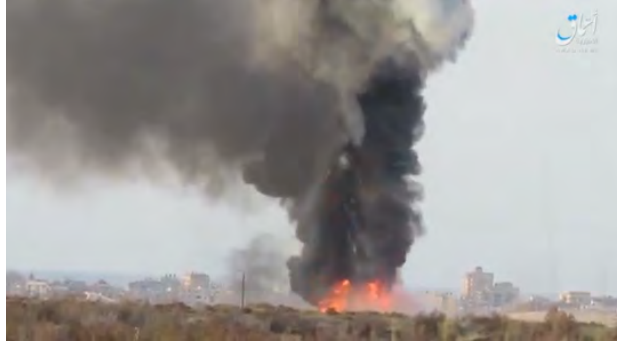
دبابة للجيش المصري تحترق بعد أن استهدفها عناصر تنظيم الدولة الإسلامية بعبوة ناسفة في جنوب العريش (أخبار المسلمين، 3 آذار/ مارس 2018).

◀ أفادت ولاية سيناء في تنظيم الدولة الإسلامية في 3 آذار/ مارس 2018 بأن عناصر التنظيم قد أصابوا ودمروا تسع سيارات مصفحة للجيش المصري. ووفقاً لما جاء في بيان تنظيم الدولة الإسلامية فقد تمت تلك الإصابات في مناطق مختلفة من سيناء: جنوب الشيخ زايد (إصابة دبابتين بعبوات ناسفة); جنوب العريش (تدمير دبابة); منطقة سبيكة إلى الغرب من العريش (إصابة سيارتين مصفحتين بعبوات ناسفة). كما وأفاد تنظيم الدولة الإسلامية أن قناصة من التنظيم قد قتلوا وجرحوا ما لا يقل عن ستة جنود مصريين (أخبار المسلمين، 4 آذار/ مارس 2018).