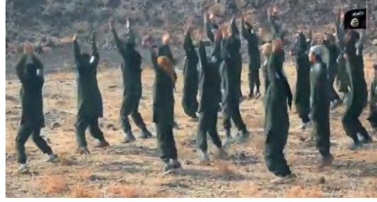
تدريبات عناصر جيش خالد بن الوليد (أخبار المسلمين، 25 شباط/ فبراير 2018).