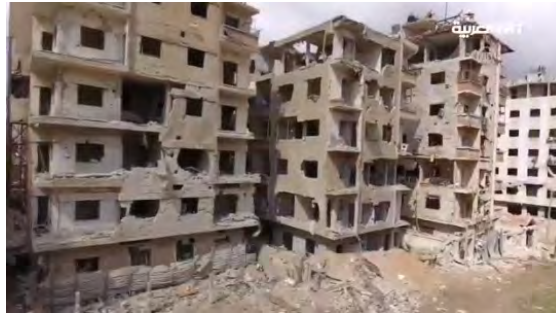
مظاهر الدمار في الغوطة الشرقية.

◀ الكولونيل سهيل حسن ("النمر") أعلن في اليوم السادس للعمليات البرية أن الجيش السوري قد احتل من تنظيمات المتمردين 30% من مساحة الغوطة الشرقية. وأفادت وسائل إعلام سورية أن هجوم القوات السورية قد استهدف بالأساس مواقع هيئة تحرير الشام (ملاحظة: تحارب هيئة تحرير الشام إلى جانب التنظيمات الأخرى، لكن الهيئة ليست مهيمنة على المنطقة كما هو الأمر في محيط إدلب). وقالت وسائل إعلام سورية إن القوات السورية تعمل الآن على تقطيع الغوطة الشرقية إلى جزئين (حلب توداي، 3 آذار/ مارس 2018).