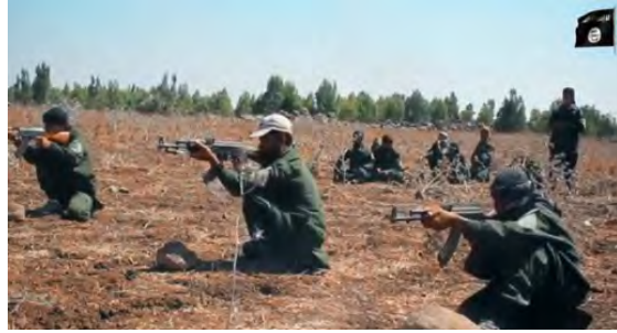
عناصر جيش خالد بن الوليد يتدربون على الرماية (أخبار المسلمين، 25 شباط/ فبراير 2018).