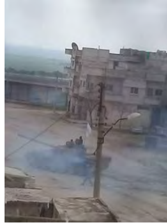
دبابات هيئة تحرير الشام تسيطر على مدينة معرة مصرين إلى الشمال من إدلب (صفحة فيسبوك فرات بوست [فرات بوست - [EuphratesPost 1 آذار/ مارس 2018].)