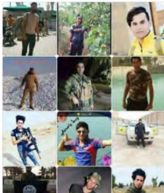
Траурные объявления сил "народного призыва" о гибели боевиков в результате нападения организации ИГИЛ