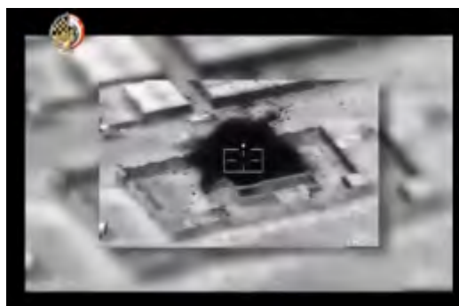
Справа: "террористический объект", который был уничтожен летательным аппаратом египетских ВВС на полуострове Синай, в рамках операции "Синай 2018". Слева: служащие египетских сил безопасности в ходе ведения операции