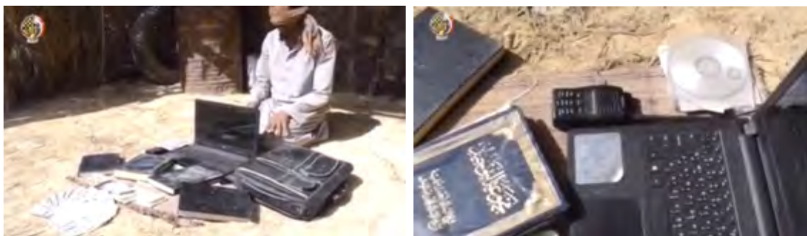
"Центр пропаганды" округа Синай организации ИГИЛ, обнаруженный служащими египетских сил безопасности (официальная страница Фейсбук пресс-секретаря вооруженных сил Египта, 18 февраля 2018 г.)

► В рамках статьи, опубликованной в газете "Аль Араби Аль Джадид" и описывающей ход первой недели проведения операции, сообщалось, что силы египетской армии предпринимали попытки распространить свой контроль над новыми районами, расположенными к югу от г. Рафиях, однако уровень боевой готовности боевиков округа ИГИЛ оказался для них неприятным сюрпризом. В результате этого египетские силы безопасности понесли потери убитыми и ранеными , и армейские подразделения вошли только на территорию некоторых из районов, расположенных к западу и к северу от г. Рафиях. Как сообщают источники из военного госпиталя, расположенного в г. Аль Ариш, было убито 15 служащих армии и полиции (газета "Аль Араби Аль Джадид", 16 февраля 2018 г.).