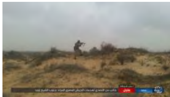
Боевики организации ИГИЛ ведут военные действия против египетских сил безопасности к югу от г. Аль Шейх Зувейд (сайт "ахбар аль муслемин", 17 февраля 2018 г.)

► Редакционная статья, опубликованная в журнале организации ИГИЛ "Аль Наба", была посвящена боевым действиям на полуострове Синай. В статье было указано, что боевики исламского государства во всех районах полуострова Синай готовятся к обострению своих атак против всех, кто ведет против них войну . В статье отмечается, что джихад священных воинов на полуострове Синай против власти президента Аль Сиси не прекратится . В статье также выражается надежда, что конец режиму будет положен руками солдат халифата, нападающими на него в его собственном доме и превращающими Каир в землю ислама, на которой будет царствовать шариат (журнал "Аль Наба", выпуск № 119, 15 февраля 2018 г.).