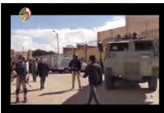
Служащие египетских сил безопасности в ходе ведения операции (официальная страница Фейсбук пресс-секретаря вооруженных сил Египта, 16 февраля 2018 г.)

В ходе проведения операции служащие египетских сил безопасности обнаружили "центр пропаганды" округа Синай организации ИГИЛ . "Центр пропаганды" был размещен во временном строении, собранном из листов жести, в пустынной местности. В этом центре были обнаружены: портативный компьютер-ноутбук, 2 радиостанции, кассеты, диски книги исламского религиозного содержания и наличные деньги (официальная страница Фейсбук пресс-секретаря вооруженных сил Египта, 148 февраля 2018 г.).