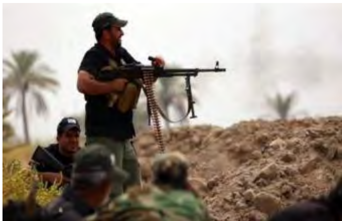
Действия сил "народного призыва" на территории Ирака (иракское агентство новостей, 16 февраля 2018 г.)

◆ Провинция Диала (район г. Бакуба): 3 боевика организации ИГИЛ, ехавшие в автомобиле, были уничтожены боевиками сил "народного призыва" , приблизительно в 66 км к северу от г. Бакуба. Остальные боевики, находившиеся в автомобиле, скрылись в направлении г. Бакуба (иракское агентство новостей, 15 февраля 2018 г.).