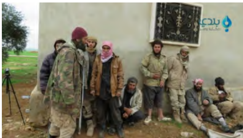
Боевики организации ИГИЛ, которые сдались в плен силам группировки "Штаб по освобождению Аль Шаам" и других повстанческих организаций (газета "Ахбар Балади", 13 февраля 2018 г.)

приблизительно в 22 км к юго-востоку от г. Меарат Аль Нааман, который находится на центральной трассе между городами Хама и Халеб (сирийский наблюдательный центр по защите прав человека, газета "Ахбар Балади", 13 февраля 2018 г.). Это одна из наиболее крупных массовых капитуляций боевиков организации ИГИЛ за весь период ведения боевых действий, и она может служить свидетельством падения морального настроения и утраты боевого духа в их рядах в районе г. Идлиб.