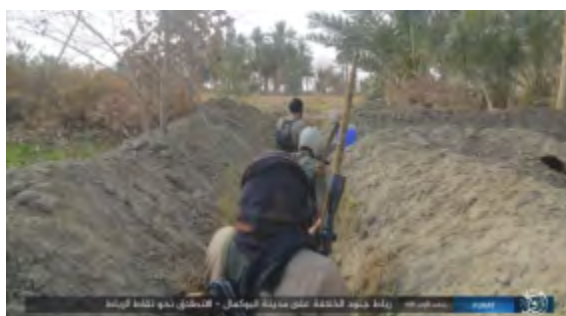
Боевики организации ИГИЛ готовятся к боевым действиям против позиций сирийской армии в районе г. Аль Абу Кемаль (сайт "ахбар аль муслемин", 7 февраля 2018 г.)