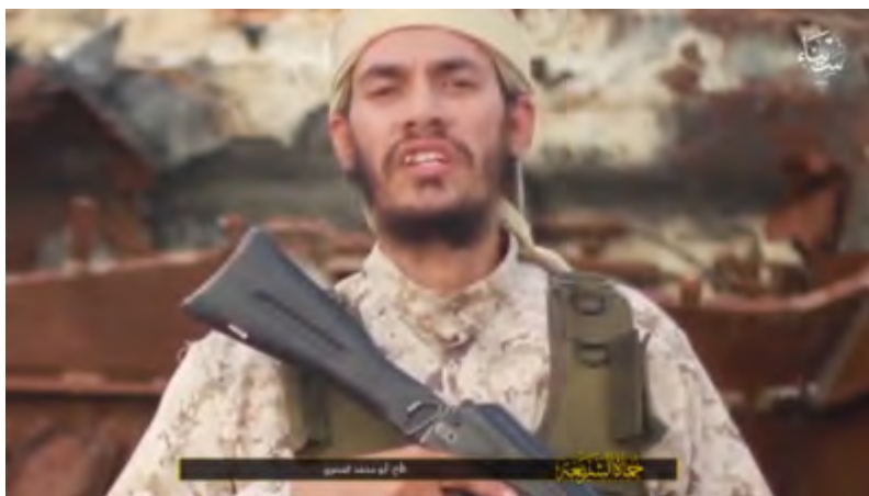
Диктор в ролике, боевик организации ИГИЛ по прозвищу Абу Мухаммад а-Масри (сайт "ахбар аль муслемин", 11 февраля 2018 г.)

теракты на территории Египта в день выборов, так как "демократия и выборы есть отступничество от религии". Высказываясь на тему операции египетских сил безопасности по искоренению террора на полуострове Синай, он угрожает войной против египетской армии (сайт "ахбар аль муслемин", 11 февраля 2018 г.).