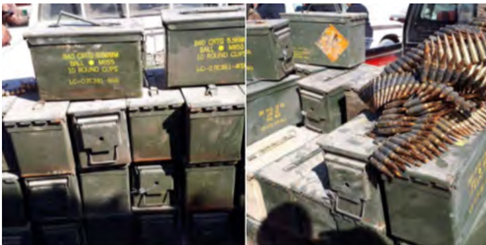
Легкое стрелковое оружие и боеприпасы, обнаруженные в г. Мосул (аккаунт Твиттер ArmY_Iq@الجيش العراقي الوطني, 7 февраля 2018 г.)