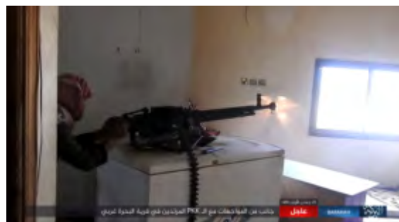
Боевики организации ИГИЛ ведут огонь, из легкого и среднего стрелкового оружия, в направлении позиций сил группировки SDF в деревне Аль Бахра Гарби, расположенной к северу от г. Аль Абу Кемаль (сайт "ахбар аль муслемин", 9 февраля 2018 г.)