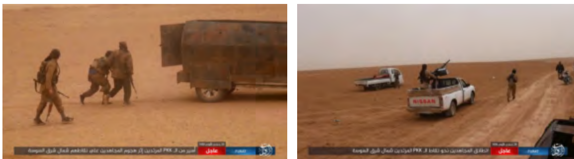
Справа: боевики организации ИГИЛ в ходе атаки на позиции сил группировки SDF. Слева: боец сил группировки SDF, который был захвачен в плен боевиками организации ИГИЛ (сайт "ахбар аль муслемин", 11 февраля 2018 г.)