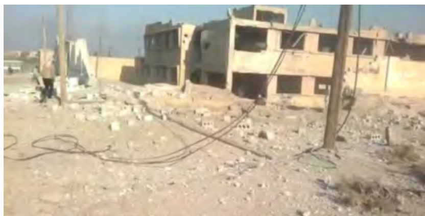
Разрушения в селе Аль Бахра (сирийский наблюдательный центр по защите прав человека, 13 февраля 2018 г.)