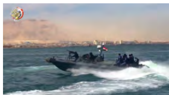
Силы египетской армии готовятся к проведению операции