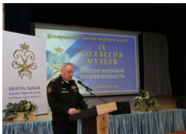
Адмирал Владимир Королев, командующий ВМФ России, в ходе речи, на конференции, проведенной в Центральном военно-морском музее в Санкт Петербурге (сайт министерства обороны России, 9 февраля 2018 г.)

боевых действиях с самого начала российской операции против террора на территории Сирии, и что в течении этого периода они приобрели ценный практический опыт, в первую очередь – в области запуска крылатых ракет дальнего радиуса действия с борта кораблей и подводных лодок. По его словам, за период проведения операции в Сирии силы ВМФ нанесли более 10 ударов, в рамках которых было применено свыше 100 крылатых ракет дальнего радиуса действия, которые запускались с борта боевых кораблей и подводных лодок. В результате этих ударов было уничтожено более 80 очагов деятельности "незаконных вооруженных группировок". Адмирал Королев добавил, что, параллельно с этим, силы, действовавшие с базы морской авиации, совершили свыше 400 боевых вылетов и нанесли удары по более чем 1300 "террористическим объектам" (сайт министерства обороны России, 9 февраля 2018 г.; агентство новостей "Спутник", 8 февраля 2018 г.).