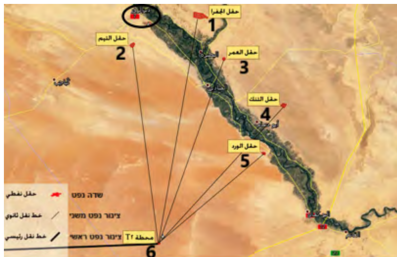
שדות נפט ומתקני נפט במחוז דיר אלזור: 1 - אלג'פרה (Al Jafrah); 2 - אלתיים (Al Taym); 3 - אלעמר (Al Omar); 4 - אלטנכ (Al Tanak); 5 - אלורד (Al Ward). 6 - תחנת T2 לשאיבת נפט (אח'באר אלאאן, 16 בפברואר 2016).