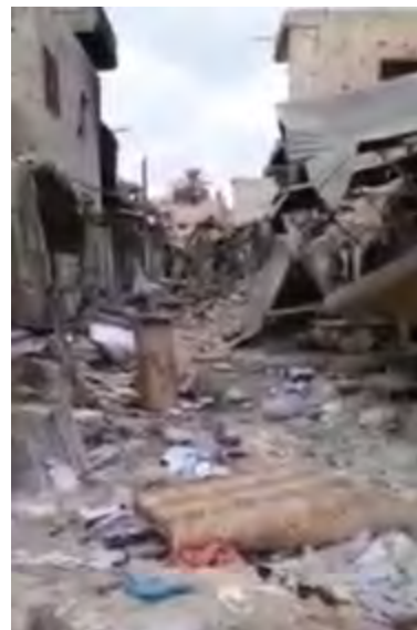
אזור השוק ההרוס באלמיאדין (ערוץ היוטיוב פראת פוסט, 7 בדצמבר 2017).