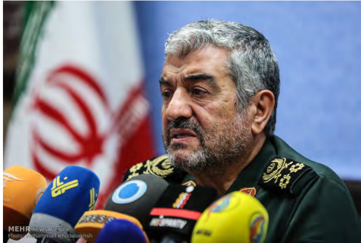
מפקד משמרות המהפכה ג'עפרי (מהר, 8 בפברואר 2018).