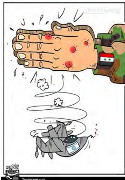
קריקטורה בסוכנות הידיעות האיראנית תסנים (12 בפברואר 2018) בעקבות הפלת המטוס הישראלי.

◀ בעקבות חדירת כלי טיס בלתי מאויש איראני לשטח ישראל, ששוגר ב-10 בפברואר 2018 מאזור שדה התעופה T-4 סמוך לעיר תדמור בסוריה והופל על-ידי צה"ל בשטח ישראל, תקף צה"ל מטרות בסוריה, שכללו גם את קרון השליטה האיראני. במסגרת התקיפה התגובתית שוגרו טילי נ"מ לעבר מטוסי חיל האוויר, שהביאו להפלת מטוס "סופה (F-16) " בשטח ישראל. בתגובה להפלת המטוס, ביצע צה"ל תקיפה רחבת היקף נגד מערך ההגנה האווירית הסורי ומטרות איראניות בסוריה. עפ"י הודעת דובר צה"ל, תקף צה"ל 12 מטרות, בהן מטרות בשלוש סוללות הגנה אווירית סוריות וארבע מטרות איראניות.