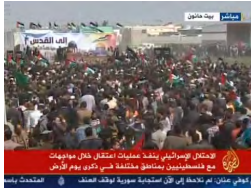
העצרת בבירת חאנון, בצפון רצועת עזה (אלג'זירה, 30 במרץ 2012).

◀ מארגני האירועים לא הצליחו להביך את ישראל ובכך נכשלה המטרה העיקרית שלשמה אורגנו האירועים. הדבר גרם למארגנים לאכזבה שניכרה בהתבטאויות פעילי חמאס בבריטניה, שהיו בין מארגני האירועים: