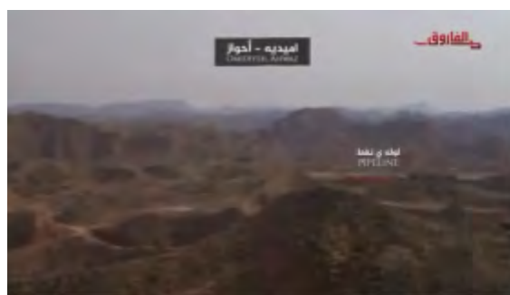
Кадры из ролика с заявлением о принятии ответственности за взрыв на линии нефтепровода. Справа: снимок участка нефтепровода. Слева: момент взрыва на линии нефтепровода (аккаунт Твиттер Baloshi_issue@قضية بلوشستان محنته , 30 декабря 2017 г.)