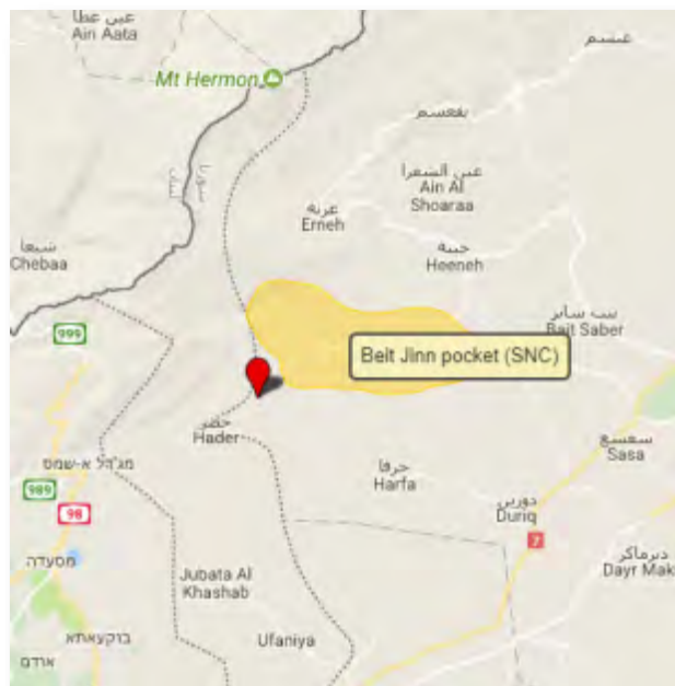
Анклав в районе села Бейт Джан (обозначен желтым цветом) и высоты Аль Ахмар (обозначены красным цветом), из которых были эвакуированы боевики группировки "Штаб по освобождению Аль Шаам" и других повстанческих организаций (Google Maps)