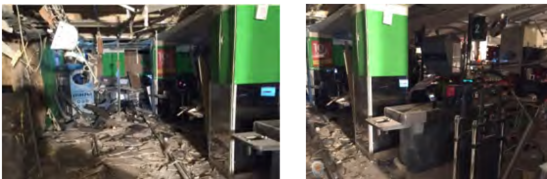
Место взрыва в продуктовом магазине в г. Санкт Петербург (сайт национального комитета России по борьбе с террором, 27 декабря 2017 г.)