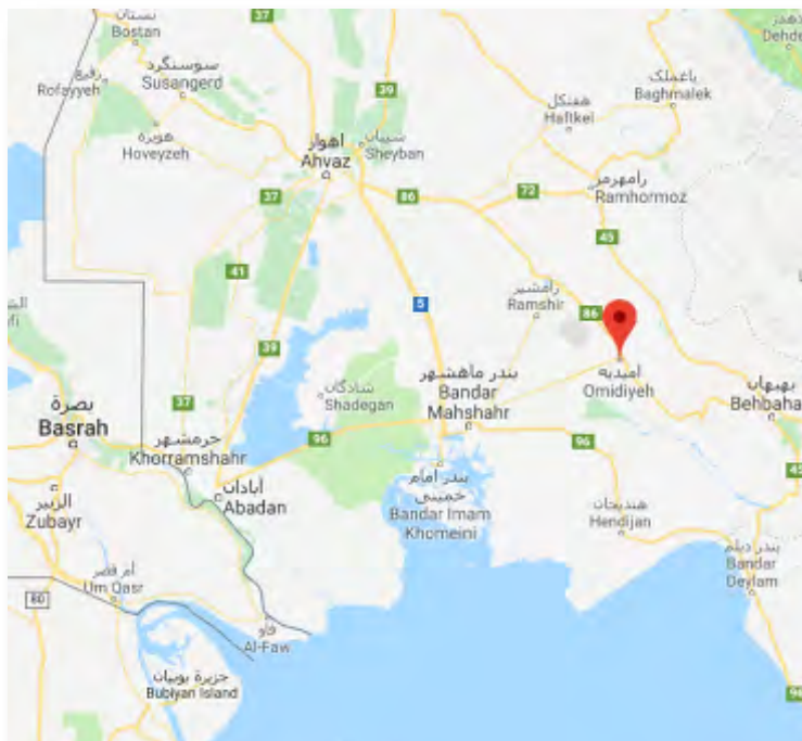
Г. Амидия в провинции Хузестан. Г. Ахваз расположен приблизительно в 116 км к северо-западу от г. Амидия (Google Maps)

► Организация "Ансар Аль Фуракан" 2 , объявленная властями Ирана террористической организацией, является салафитской джихадистской организацией, состоящей из жителей иранской провинции Белуджистан (суннитских мусульман), которая была создана в 2013 г. Члены этой организации ведут действия против иранского режима в провинции Систан и Белуджистан, расположенной в юго-восточной части Ирана, поблизости от границы с Пакистаном. Совершение взрыва на линии нефтепровода в провинции Хузестан является нехарактерной акцией для организации "Ансар Аль Фуракан", которая обычно действует на территории провинции Белуджистан.