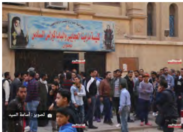
Вход в церковь "Мар Мина" в селе Халуан, неподалеку от которой был совершен теракт (газета "Аль Масри Аль Йоум", 31 декабря 2017 г.)

► Как сообщил представитель министерства здравоохранения, в результате этого теракта было убито 10 человек, один из которых – офицер полиции . Еще 5 человек получили ранения. В некоторых из поступивших сообщений говорилось, что в совершении этого теракта принимало участие несколько террористов, один из которых был уничтожен служащими египетских сил безопасности (газета "Аль Йоум Аль Саба", 29 декабря 2017 г.). Следует отметить, что церковь и прилегающая к ней местность находились под охраной, в рамках состояния повышенной боевой готовности, которое было введено в египетских силах безопасности в течении периода христианских праздников.