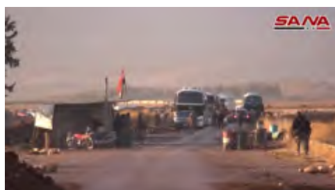
Эвакуация боевиков группировки "Штаб по освобождению Аль Шаам" в провинцию Идлиб (агентство новостей САНА, 29 декабря 2017 г.)

► 1-го января 2018 г. действия по выполнению соглашения были прекращены, так как, по сообщению сирийских источников, "вооруженные боевики" отказались передать в распоряжение сил сирийской армии несколько позиций, расположенных на высотах Аль Ахмар, на западном краю анклава, а также на территории комплекса гробницы шейха Абдаллы, священного места для друзов, которое господствует над районом Мизрат Бейт Джан. В конце концов, в соответствии с решительной позицией, занятой представителями сирийского режима, высоты Аль Ахмар перешли под контроль сил сирийской армии, в соответствии с договоренностью между сторонами (газета "Батулат Аль Джиш Аль Сури", 2 января 2018 г.). 2-го января 2018 г. силы сирийской армии заняли позиции, расположенные на высотах Аль Ахмар, вместо боевиков группировки "Штаб по освобождению Аль Шаам" и других повстанческих организаций (агентство новостей САНА, 2 января 2018 г.). В результате этого, по нашим оценкам, станет возможным продолжение выполнения соглашения.