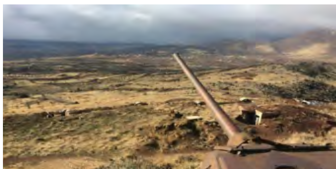
Справа: вид, открывающийся с высот Аль Ахмар. Слева: колонна транспортных средств и солдат сирийской армии в районе высот Аль Ахмар