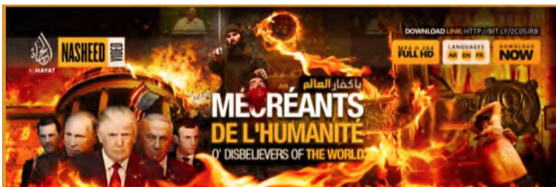
Изображение, служащее заставкой к ролику: Трамп, Нетанияху, Путин, Макрон и Башар Аль Асад, под заголовком "О, неверные всего мира" (агентство новостей "Аль Суарам", 31 декабря 2017 г.)