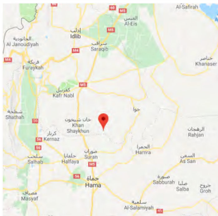
Село Атшан, расположенное в районе, в котором велись бои между силами сирийской армии и боевиками группировки "Штаб по освобождению Аль Шаам" (обозначен красным значком)

устройств и мин, установленных боевиками группировки "Штаб по освобождению Аль Шаам" (канал Ютуб агентства новостей САНА, 30 декабря 2017 г.).