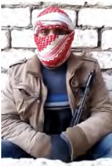
Один из террористов зачитывает свое завещание перед выходом на совершение теракта ("ахбар аль муслемин", 30 декабря 2017 г.)