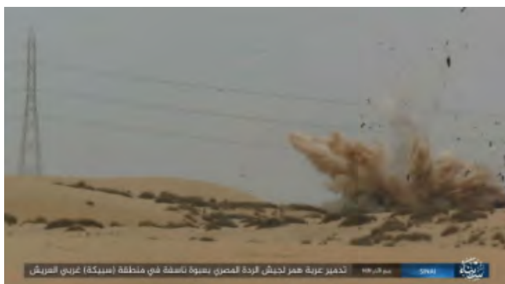
תיעוד של דאעש: פיצוץ כלי רכב של צבא מצרים באזור סביכה (Sebeekah), ממערב לאלעריש (אח'באר אלמסלמין, 30 בדצמבר 2017).