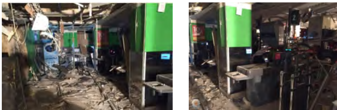
זירת הפיצוץ במרכז בסנט פטרסבורג (אתר הוועדה הלאומית למלחמה בטרור של רוסיה, 27 בדצמבר 2017).