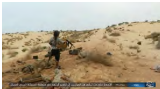
מימין: פעיל דאעש יורה בחיילים ששרדו את פיצוץ המטען. משמאל: נשק שלל שנלקח על-ידי פעילי דאעש, כולל טלפונים סלולאריים ומסמכי זיהוי של החיילים (אח'באר אלמסלמין, 30 בדצמבר 2017).