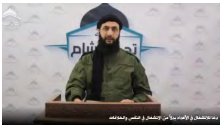
אבו מחמד אלג'ולאני (אלח'ליג אונליין, 17 בינואר 2018).

◀ נוכח המשברים והמצב הקשה מפציר אלג'ולאני בארגונים הסורים החמושים להניח למחלוקות, לאחד מאמצים וללכד את השורות נגד צבא סוריה . הוא שיבח את עמידתם האיתנה של הלוחמים בדרעא בקניטרה ובאזור דמשק ואמר שהם מהווים את הבסיס לכיבוש דמשק. בסוף דבריו הוא פנה ללוחמים ואמר להם שהמשך הג'האד באלשאם הוא עמוד התווך לסיכול "המזימות" שנתקמות נגד מסגד אלאקצא. הוא הזכיר כי זוהי אחריות כבדה ולכן יש לאחד את השורות ואת הלבבות ולהניח בצד את המחלוקות .