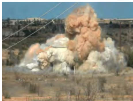
השמדת בסיס טרור בצפון סיני על-ידי צבא מצרים (דף הפייסבוק הרשמי של דובר צבא מצרים, 23 בינואר 2018).

◀ דאעש המשיך לקיים פעילות אינטנסיבית נגד הכוחות הביטחון המצרים בצפון סיני בדגש על הנחת מטעני חבלה: