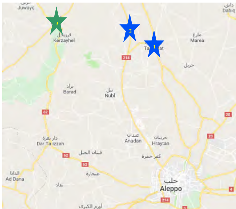
תל אג'אר (2), הנמצא מצפון מזרח לתל רפעת (1), שאליו נסוגו היחידות הרוסיות מאזור עפרין (3) (Google Maps).

לספק את הסיוע הדרוש לאזרחים הנמלטים מאזורי הלחימה (דף הפייסבוק של משרד ההגנה הרוסי, 20 בינואר 2018).