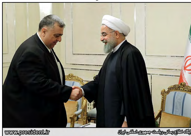
פגישת רוחאני-צבאע' (אתר הנשיא, 16 בינואר 2018).

◀ ב-15 בינואר 2018 נפגש צבאע' עם מזכיר המועצה העליונה לביטחון לאומי, עלי שמח'אני, ודן עמו בהתפתחויות בסוריה ובאזור ובהרחבת שיתוף הפעולה בין שתי המדינות. שמח'אני הדגיש את הצורך בהמשך תהליך ההסדרה הפוליטי לחיזוק ריבונות ממשלת סוריה והגברת שליטתה בכל שטח סוריה וציין, כי כל פעולה פוליטית או צבאית, שיש בה משום העברת שטחים סורים לידי קבוצות טרוריסטיות או כיבוש שטח סורי על-ידי כוחות זרים, מנוגדת לאינטרסים של סוריה ומציבה איום בפני מדינות האזור. כמו כן התייחס שמח'אני לצורך להרחיב את הקשרים בין שתי המדינות, בעיקר בתחומי הכלכלה והמסחר, ואמר, כי השבת הביטחון לסוריה יוצרת הזדמנות לפיתוח המדינה וכי איראן מוכנה להגיש לסוריה את כל הסיוע והייעוץ הדרושים לשם כך (פארס, 15 בינואר 2018).