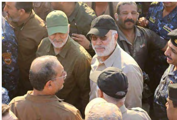
קאסם סלימאני לצד אבו-מהדי אל-מהנדס.

◀ בתוך כך דיווחו מקורות תקשורת בעיראק (טוויטר, 13 בינואר 2018), כי מפקד כוח קדס של משמרות המהפכה, קאסם סלימאני, ביקר ב-13 בינואר 2018 בבגדאד וקיים התייעצויות עם ראש ממשלת עיראק, חידר אלעבאדי; עם מפקד מיליצית בדר, האדי אלעאמרי; ועם סגן מפקד הגיוס העממי, אבו-מהדי אלמהנדס, כדי לגבש הסכמה ביניהם לקראת הבחירות. הדיווח, שלא אושר על-ידי מקורות איראנים, התפרסם על רקע מגעים מתקדמים בין ראש ממשלת עיראק למיליציות השיעיות העיראקיות הבולטות, ובהן מיליצית בדר, עצאא'ב אל-חק ותנועת האצילים (אלנג'בא') בנוגע לאפשרות לכינון קואליציה משותפת לקראת הבחירות הכלליות.