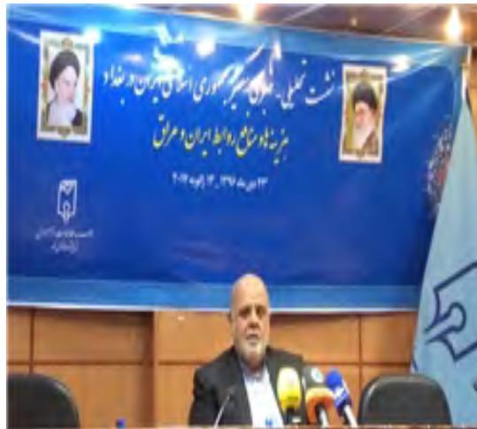
שגריר איראן בבגדאד, אירג' מסג'די (פארס, 13 בינואר 2018).

◀ בהרצאה בכנס, שדן ביחסי איראן-עיראק, התייחס שגריר איראן בעיראק, אירג' מסג'די (Iraj Masjedi), בהרחבה לפעילות האיראנית בעיראק בעקבות תבוסת המדינה האסלאמית. את עיקר דבריו ייחד השגריר למאמץ האיראני להרחיב את פעילותה הכלכלית בעיראק בתום המערכה נגד המדינה האסלאמית. מסג'די אמר, כי איראן היא השותף הכלכלי השני בחשיבותו של עיראק (אחרי סין). עם זאת, היא אינה מרוצה מהיקף היחסים הנוכחי בין המדינות בתחומים השונים ומעוניינת להרחיבם. הוא ציין, כי בשגרירות איראן בבגדאד הוקמה ועדה כלכלית, שנועדה לסייע לחברות ציבוריות ופרטיות ולמשקיעים איראנים המבקשים לפעול בעיראק. לדבריו, עיראק זקוקה להשקעות בתחומי התחבורה והתיירות ולסיוע בשיקום חלק מהמחוזות שנפגעו במלחמה נגד דאעש, ואיראן יכולה לסייע לה בכך.