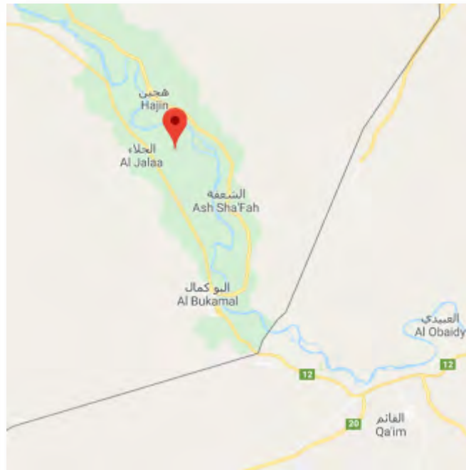
הכפר אלבקעאן בגדה המערבית של נהר הפרת, שבו התנהלו ההתנגשויות בין כוחות SDF לבין פעילי דאעש.