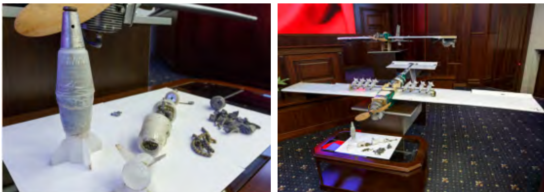
מימין: אחד מכלי הטיס הבלתי מאוישים, שנטלו חלק בניסיון התקיפה נגד בסיס חמימים וטרטוס. משמאל: הפצצות שנשאו כלי הטיס הללו (אתר משרד ההגנה הרוסי, 11 בינואר 2018).

על כך שארגוני טרור מחזיקים בטכנולוגיה מתקדמת המאפשרת להם לעשות שימוש בכלי טיס בלתי מאוישים למטרות טרור בכל מקום בעולם (אתר משרד ההגנה הרוסי, 11 בינואר 2018; טאס, 11 בינואר 2018).