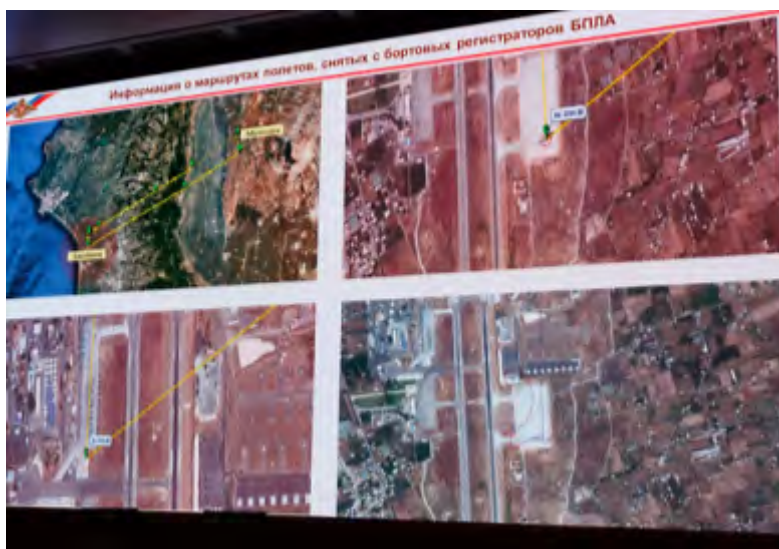
המסלול שבו טסו כלי הטיס הבלתי מאוישים בעת ניסיון התקיפה נגד הבסיסים הרוסיים בחמימים ובטרטוס.