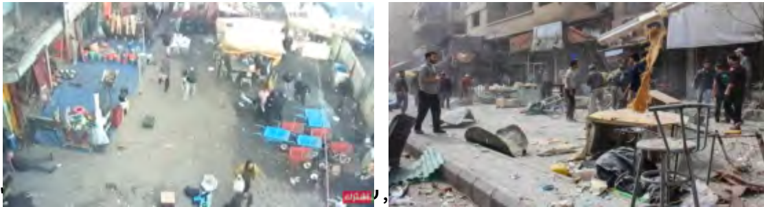
ואזרחים, שנמלטו מהזירה מייד לאחר ביצועו (אלסומריה ניוז, 15 בינואר 2018).

◀ בבוקר ה-15 בינואר 2018 בוצע פיגוע התאבדות בשוק שבכיכר אלטיראן במרכז בגדאד . שני מחבלים מתאבדים, שנשאו על גופם חגורות נפץ פוצצו עצמם. בפיגוע נהרגו 26 בני אדם ונפצעו 95 (אלסומריה ניוז, 15 בינואר 2018). עד כה לא אותרה קבלת אחריות על הפיגוע. להערכתנו הוא בוצע ע"י דאעש .