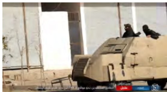
מימין: פעילי דאעש נעים בכלי רכב שטח ממוגן מייצור עצמי לעבר עמדות של כוחות SDF בכפר אלבקעאן. משמאל: פעילי דאעש משגרים פצצת מרגמה לעבר עמדות של כוחות SDF באזור הכפר אלבקעאן (אח'באר אלמסלמין, 13 בינואר 2018).