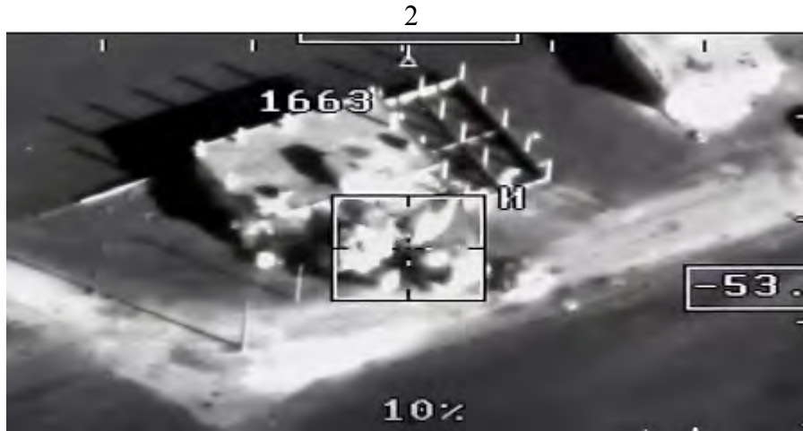
תקיפת בסיס החוליה, שביצעה את ירי המרגמות על בסיס חמימים ב-31 בדצמבר 2017 (דף הפייסבוק של משרד ההגנה הרוסי, 12 בינואר 2018).