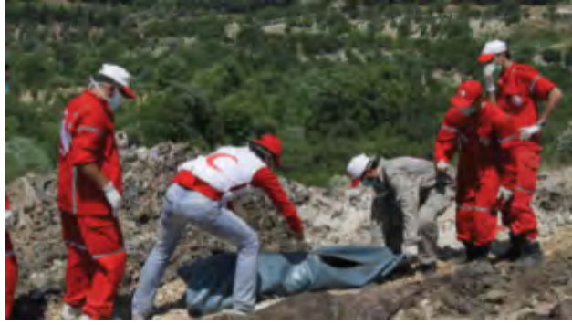
הוצאת גופה מקבר אחים [ככל הנראה באלרקה] (אלוטן, 16 בינואר 2018).