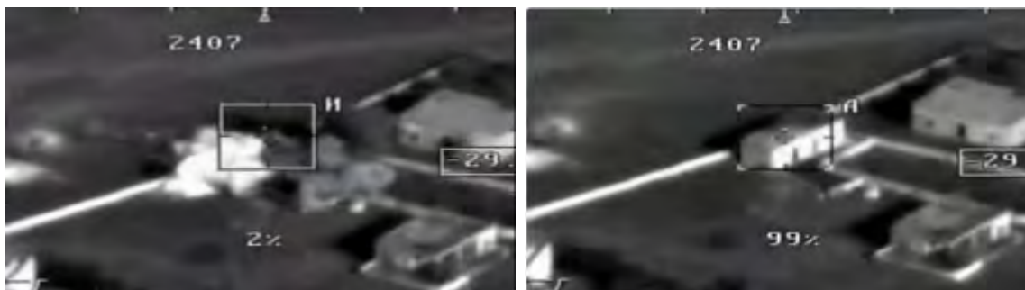
השמדת המחסן, שבו אוחסנו כלי הטיס הבלתי מאוישים שבהם השתמשו פעילי הטרור (דף הפייסבוק של משרד ההגנה הרוסי, 12 בינואר 2018).