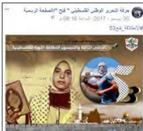
הכרזה שהועלתה לאחרונה לדף הפייסבוק של פתח.