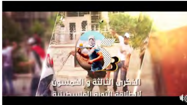
סרטון המסית לעימותים אלימים, שהכינה פתח לציון יום השנה ה-53 לייסודה (דף הפייסבוק של פתח, 29 בדצמבר 2017)

◀ בולטים במיוחד בדף הפייסבוק פוסטים המאדירים את תפקידה של האישה הפלסטינית, אשר מוקדשים לחמש מחבלות מתאבדות, חברות תנועת פתח, שביצעו פיגועים רצחניים בהם נהרגו ונפצעו אזרחים ישראלים רבים. בחמש כרזות נפרדות הנראות אחידות בעיצוב שלהם, פורסמו תמונותיהן של המחבלות ללא ציון שמן. ברקע כל תמונה תמונת הפלסטיני המיידה אבנים על רקע המסגדים והכנסיות. במקביל הועלה לדף הפייסבוק פוסט המשבח את תפקידה של האישה הפלסטינית במאבק הפלסטיני. על רקע תמונת נשים לבושות כפייה נכתב: "האישה הפלסטינית. האם... האחות... השהידה... האסירה... הלוחמת" (דף הפייסבוק של פתח, 30 בדצמבר 2017).