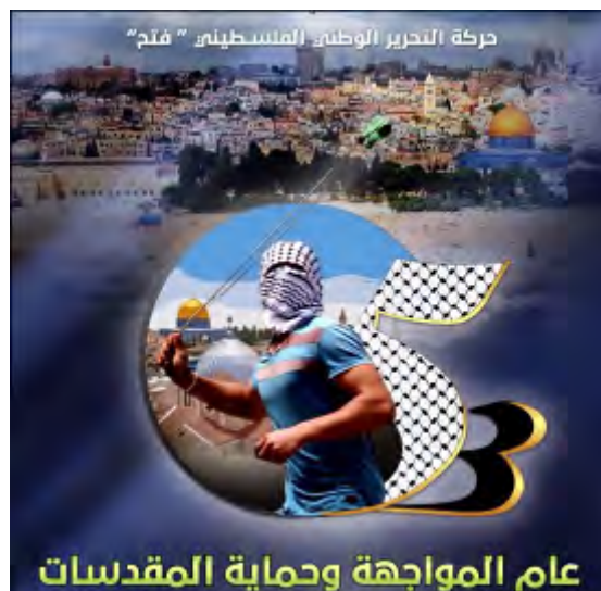
תמונת הפרופיל בדף הפייסבוק של פתח שהוחלפה לרגל יום השנה ה-53 להקמת התנועה (דף הפייסבוק של הפתח, 30 בדצמבר 2017)

◀ ב-1 בינואר 2018 חל יום השנה ה-53 להקמת תנועת פתח. לרגל יום השנה הוחלפה תמונת הפרופיל בדף הפייסבוק הרשמי של תנועת פתח והועלו בו מספר פוסטים חדשים. תמונת הפרופיל הוחלפה בתמונה של צעיר פלסטיני רעול פנים מיידה אבן, כשברקע כיפת הסלע וכנסיות בירושלים. על התמונה נכתב: "שנת העימות וההגנה על המקומות הקדושים" 1 (דף הפייסבוק של פתח, 30 בדצמבר 2017).