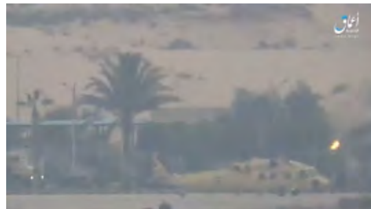
Справа: запуск противотанковой ракеты в направлении аэропорта. Слева: попадание ракеты в вертолет ("ахбар аль муслемин", 21 декабря 2017 г.)