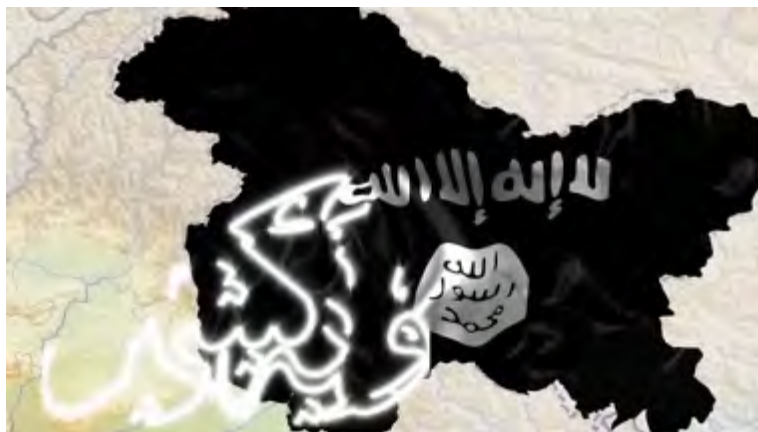
Карта округа Кашмир организации ИГИЛ, представленная в ролике с призывами Абу Аль Бара Кашмирца (агентство новостей "Хек" и сайт по обмену файлами, 25 декабря 2017 г.)

► Организация ИГИЛ обратилась к организации "Ансар Адуат Аль Хинд" (сторонники нашествия на Индию), которая была создана организацией "Аль Кайда" в секторе Кашмир в конце июля 2017 г., с призывом к сотрудничеству (газета "Аль Масдар ньюз", 23 декабря 2017 г.). В конце июля 2017 г. было опубликовано заявление организации "Аль Кайда", в рамках которого она сообщала, что кашмирский боевик по имени Дакар Рашид Бхат Муса , местный джихадистский лидер, действующий в секторе Кашмир, станет главой организации "Ансар Адуат Аль Хинд" 3 , новой организации, входящей в структуру организации "Аль Кайда", в Кашмире. Данная организация была создана для того, чтобы "изгнать индийские войска из этого района" (газета "Арам ньюз", 30 июля 2017 г.; газета "Глобал Дейли Трибун", 28 июля 2017 г.).