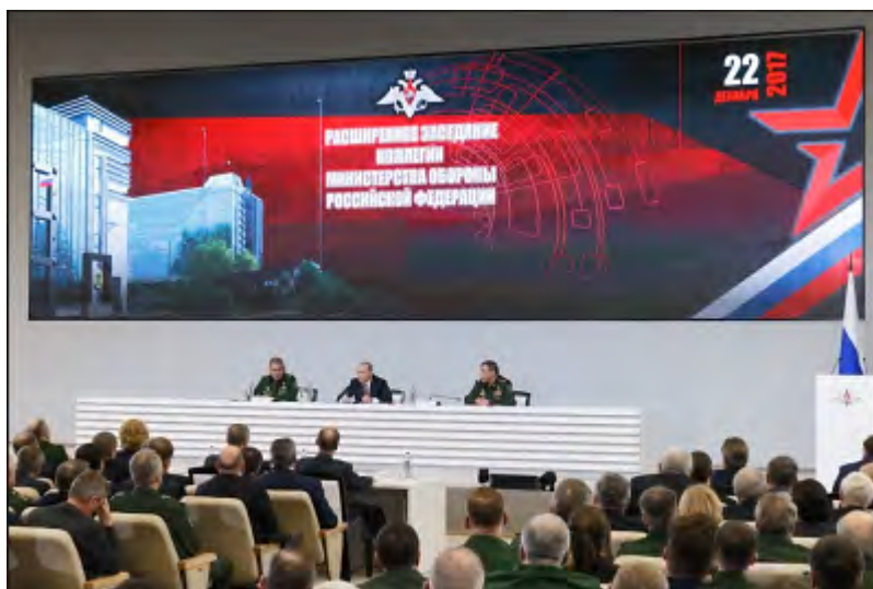
Заседание руководителей министерства обороны России. Справа налево: начальник Ген. штаба российской армии, Валерий Герасимов; президент России, Владимир Путин; министр обороны России, Сергей Шойгу (сайт министерства обороны России, 22 декабря 2017 г.)