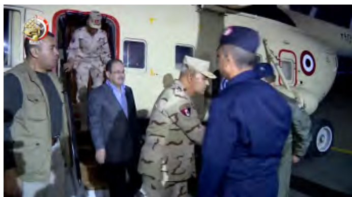
Министр обороны (в центре) и министр внутренних дел (слева, одет в костюм) после возвращения из аэропорта в г. Аль Ариш (канал Ютуб египетского министерства обороны, 19 декабря 2017 г.)

В статье, которая была опубликована в газете "Аль Масри Аль Йоум", было указано, что в распоряжении боевиков организации ИГИЛ, действующих на полуострове Синай, имеется приблизительно 50 современных противотанковых ракетных комплексов модели "Корнет" . По словам автора статьи, изначально эти ракетные комплексы принадлежали ливийской армии . После падения режима Каддафи они попали в руки различных элементов, которые переправили их на территорию континентального Египта, а оттуда - и на полуостров Синай . Комплексы