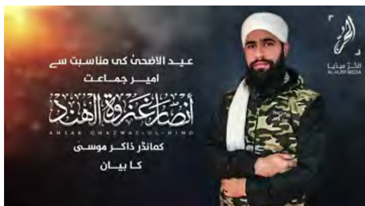
Дакар Муса, лидер организации "Ансар Адуат Аль Хинд" (сторонники нашествия на Индию), входящей в структуру организации "Аль Кайда", в секторе Кашмир (сайт "Fast Kashmir", 31 августа 2017 г.)