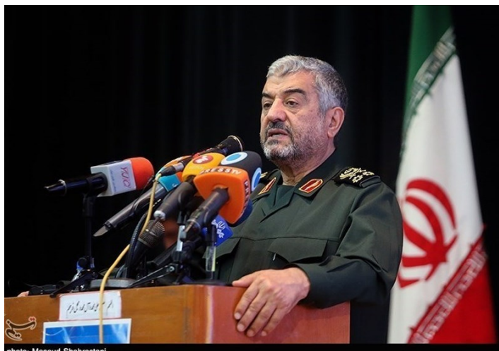
מפקד משמרות המהפכה ג'עפרי (תסנים, 14 בדצמבר 2017).

◀ מחמד-עלי ג'עפרי (Mohammad Ali Jafari), מפקד משמרות המהפכה, אמר בנאום בכנס בטהראן, כי המהפכה האסלאמית מרחיבה את השפעתה באזור ובעולם וכי כעת יש לייצב את הניצחונות, שהושגו על-ידי "חזית ההתנגדות" באזור בעשרים השנים האחרונות. הוא ציין, כי כל המזימות, שנרקמו על-ידי האמריקאים, הישראלים, הסעודים וחלק ממדינות האזור, הובסו וכי בקרוב יושג ניצחון גם בתימן. ג'עפרי אמר, כי האיומים המרכזיים הניצבים כיום בפני איראן אינם האיומים הביטחוניים כי אם האיומים "הרכים" הכלכליים, הפוליטיים, התרבותיים והחברתיים (תסנים, 14 בדצמבר 2017).