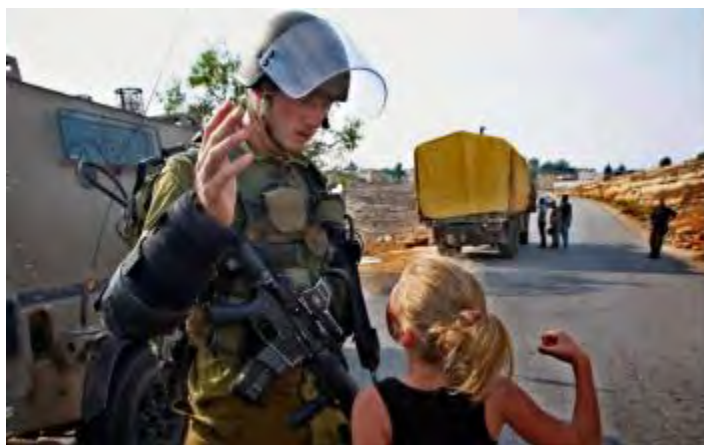
(דף הטוויטר של עאהד תמימי, 5 בדצמבר 2015).