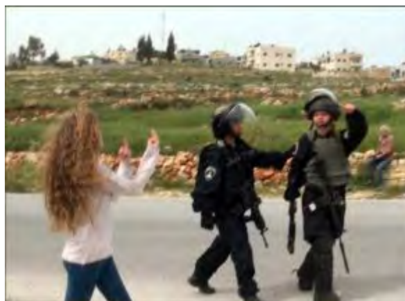
(דף הטוויטר של עאהד תמימי, 27 באוגוסט 2016).