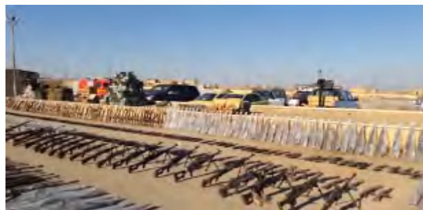
מימין: רובים ומקלעים. משמאל: תותחי נ"מ נישאים על-גבי רכבי שטח