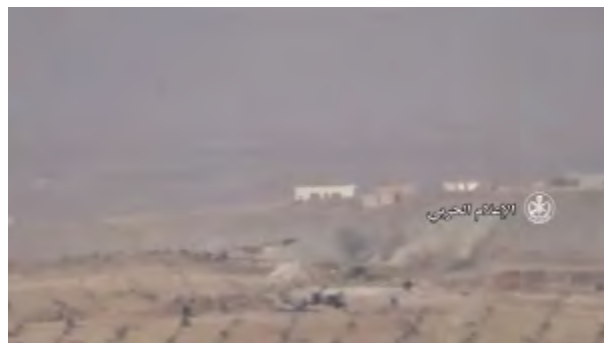
מימין: מטרת של המטה לשחרור אלשאם בכפר בליל, במרחב הכפרי שמצפון מזרח לחמאה, שנפגעו מרקטות ששוגרו על-ידי מטוס קרב (סורי או רוסי). משמאל: שיגור רקטה לעבר מטרת של המטה לשחרור אלשאם בכפר בליל (אלחדת' סוריה, 12 בדצמבר 2017).