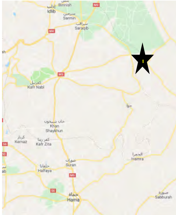
שדה התעופה אבו אלט'הור - יעד ביניים אפשרי להתקפה על אזור אדלב? (1).

אדלב מידי ארגוני המורדים. המטה לשחרור אלשאם (הארגון הדומיננטי בקרב ארגוני המורדים), ומספר פלגים מקרב צבא סוריה החופשי, שלחו תגבורות כדי להשיב לידיהם מספר כפרים במרחב הכפרי, שנכבשו ע"י צבא סוריה. נמסר כי שדה התעופה הצבאי אבו אלט'הור, שמדרום מזרח לאדלב הינו היעד הראשון של צבא סוריה (רויטרס בערבית, 11 בדצמבר 2017).