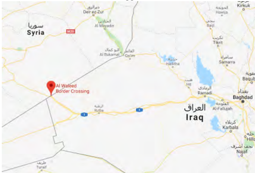
מעבר הגבול אלוליד בין עיראק לסוריה.

פעילי דאעש תקפו כלי רכב של הגיוס העממי כ-11 ק"מ מדרום לאלחויג'ה. דאעש הודיע, כי השמיד שלושה כלי רכב והרג ארבעה לוחמים. חולייה אחרת של דאעש פגעה בכלי רכב של צבא עיראק באמצעות מטען חבלה, שהונח באותו אזור (אח'באר אלמסלמין, 5 בדצמבר 2017).