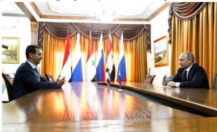
פגישת פוטין ובשאר אלאסד בבסיס חמימים (אתר הקרמלין, 11 בדצמבר 2017).

◀ להלן כמה התבטאויות רוסיות, רשמיות ולא רשמיות, על אופן הוצאת הכוחות הרוסיים מסוריה ועל היקף הכוחות שיוצאו: