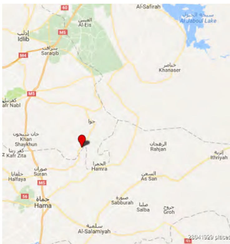
הכפר בליל, שנכבש ע"י הכוחות הסוריים מידי המטה לשחרור אלשאם