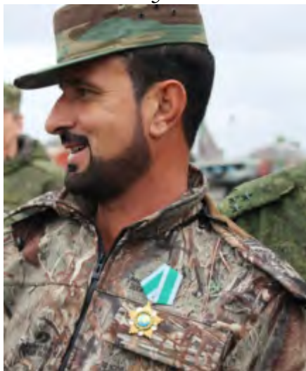
Suheil Hassan ("le Tigre"), commandant des forces qui ont fini de nettoyer la vallée de l'Euphrate (Butulat Al-Suri Al-Jaysh, blog affilié à l'armée syrienne, 7 décembre 2017)