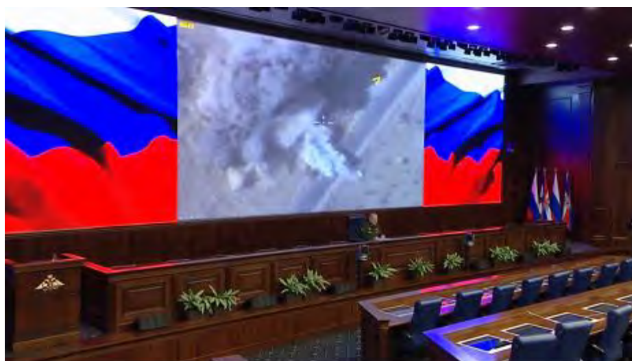
Sergey Rudskoy à la conférence de presse. En arrière-plan, on aperçoit des images des frappes aériennes russes (Site Internet du ministère russe de la Défense, 7 décembre 2017)

► Un représentant de la Coalition internationale a déclaré aux médias russes que, selon la Coalition, l'Etat islamique est toujours présent dans les zones situées au-delà des deux rives de l'Euphrate . Par conséquent, les frappes aériennes de la Coalition , qui visent à soutenir les FDS, se poursuivront sur la rive Est de l'Euphrate , tandis que les Syriens et l'aviation russe continueront d'attaquer des cibles sur la rive occidentale, entre Al-Mayadeen et Abu-Kamal. La coalition internationale continue d'opérer en coordination avec les FDS afin de s'assurer que les civils sont en mesure de revenir dans les zones libérées (Spoutnik, 9 décembre 2017).