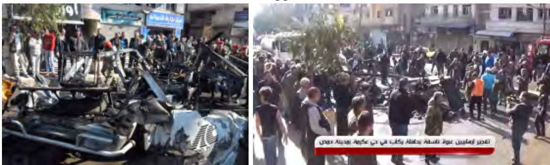
Droite: Débris d'un autobus visé par un engin piégé de l'Etat islamique à Homs. Selon les débris, il semble que l'engin était puissant, puisque le véhicule a été presque totalement détruit. Gauche: Les débris du minibus (Sana, 5 décembre 2017)