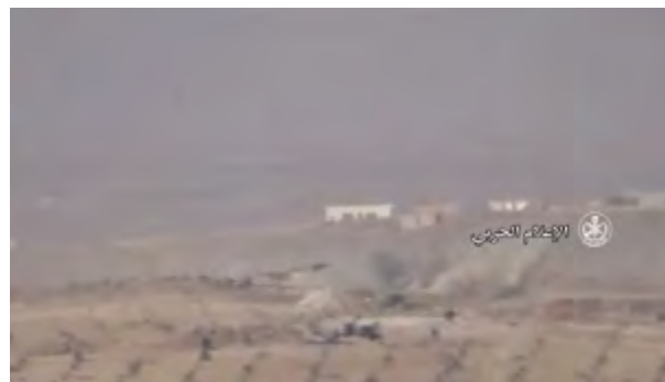
Droite: Objectifs du Siège de Libération d'Al-Sham dans le village de Balil, touchés par des roquettes tirées par un avion de chasse (syrien ou russe). Gauche: Roquette tirée sur des cibles du Siège de Libération d'Al-Sham dans le village de Balil (Al-Hadath Suriya, 12 décembre 2017)