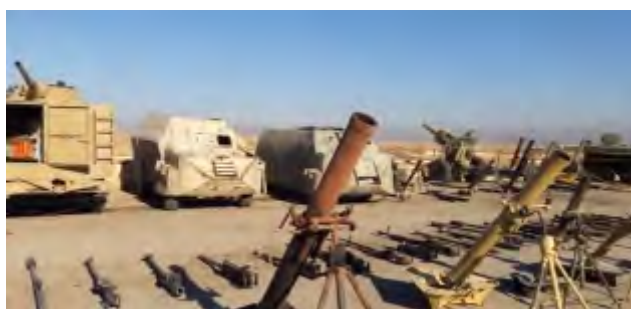
Gauche: Chars de l'Etat islamique. Droite: Mortiers et véhicules blindés de l'Etat islamique.