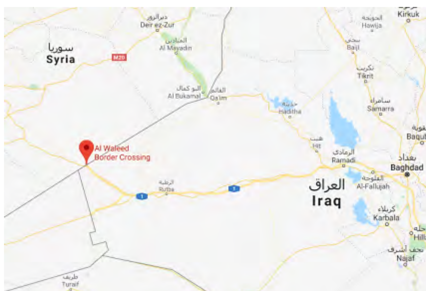
Le terminal d'Al-Waleed entre l'Irak et la Syrie

► Le 8 décembre 2017, une force de la police des frontières irakienne aurait déjoué une attaque de l'Etat islamique contre un de ses sièges au Nord du terminal d'Al-Waleed, à environ 15 km au Nord-Est de la frontière entre la Jordanie, l'Irak et la Syrie. Des membres de l'Etat islamique sont arrivés de Syrie. Deux gardes-frontières irakiens ont été blessés dans les affrontements. Les membres de l'Etat islamique ont subi des pertes et se sont retirés en territoire syrien (Al-Sumaria News, 8 décembre 2017).