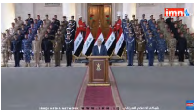
Le Premier ministre irakien Haydar al-Abadi dans son discours marquant la victoire sur l'Etat islamique en Irak

► Le 9 décembre 2017, le Premier ministre irakien Haydar al-Abadi a prononcé un discours solennel dans lequel il a annoncé la libération complète de l'Irak de l'Etat islamique . Soixante-dix membres des forces de sécurité irakiennes étaient debout derrière lui. Il a noté que les forces irakiennes avait fini de nettoyer des bastions de l'Etat islamique à l'Ouest de la province Al-Anbar, qui était "le dernier territoire irakien qui a été volé." Il a appelé les responsables politiques à assumer la responsabilité pour la sécurité et la stabilité dans le pays et à empêcher le retour du terrorisme (Al-Sumaria News, 9 décembre 2017 ; compte YouTube de la chaîne Al-Iraqiya International, 9 décembre 2017).