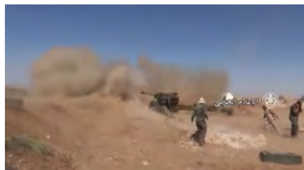
Droite: Tirs d'artillerie de l'armée syrienne sur des cibles du Siège de Libération d'Al-Sham dans la région du village de Balil. Gauche: Le village de Balil repris par l'armée syrienne (Al-Hadath Suriya, 12 décembre 2017)