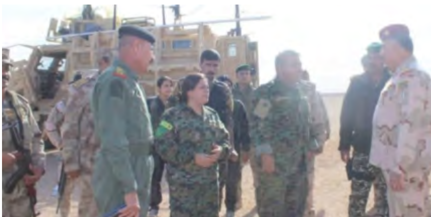
Réunion de hauts responsables de l'armée irakienne et des FDS dans le cadre des négociations qui ont conduit à la décision de créer un centre de coordination commun pour la défense de la frontière syro-irakienne