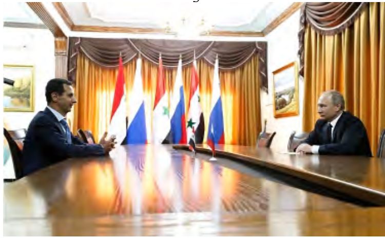
Rencontre entre Poutine et Bashar Assad à Hmeimim

► Ci-après plusieurs déclarations officielles et non officielles sur le retrait des forces russes de la Syrie et l'étendue du retrait :