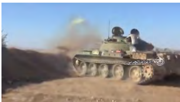
Droite: Tank de l'armée syrienne attaquant des cibles du Siège de Libération d'Al-Sham dans la région du village de Balil. Gauche: Cible du Siège de Libération d'Al-Sham dans le village de Balil, frappée par un char de l'armée syrienne (Al-Hadath Suriya, 12 décembre 2017)