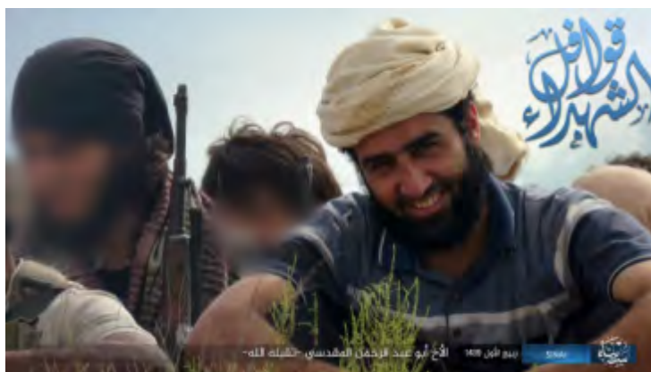
Le terroriste de l'Etat islamique Abu Abd al-Rahman al-Maqdisi, qui a été tué dans la péninsule du Sinaï. En haut à droite on peut lire : "Le convoi des Chahids" (Haqq, 9 décembre 2017)