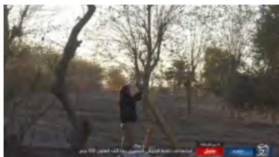
Droit : Un membre de l'Etat islamique tire un mortier au cours d'affrontements dans la banlieue Ouest d'Abu-Kamal. Gauche : Obus de mortier de l'Etat islamique visant des positions de l'armée syrienne (Haqq, 1er décembre 2017)