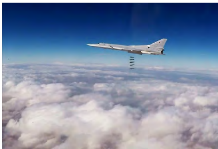
L'une des attaques de bombardiers stratégiques sur Deir ez-Zor (Page Facebook du ministère russe de la Défense, 1 er décembre 2017)

► Les 1 er et 3 décembre, 2017, six bombardiers russes Tu-22M3 à longue distance, qui ont décollé d'une base aérienne en Russie, ont attaqué des cibles de l'Etat islamique dans la province de Deir ez-Zor (principalement dans le Sud-Est de la province, où l'armée syrienne mène des recherches). Des appareils Su-30SM de la base aérienne de Hmeymim ont couvert les bombardiers. Des positions de l'Etat islamique, des dépôts de munitions et des équipements ont été détruits dans la frappe. Après l'attaque, le 3 décembre 2017, les bombers sont retournés à leur base en Russie (Page Facebook du ministère russe de la Défense, 1 er et 3 décembre 2017).