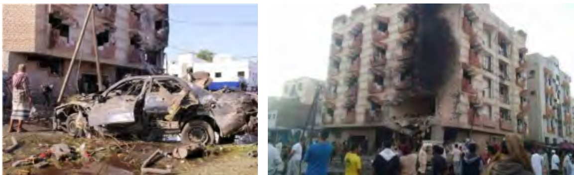
Droite: Bâtiment du ministère des Finances à Aden, endommagé par l'explosion d'une voiture piégée de l'Etat islamique (Haqq, 29 novembre 2017). Gauche : La voiture piégée (Site Internet Novinite, qui a repris une photo de Twitter, 29 novembre 2017)

l'explosion a complètement détruit le bâtiment du ministère des Finances et également endommagé des maisons voisines (dailymail.co.uk, 29 novembre 2017).