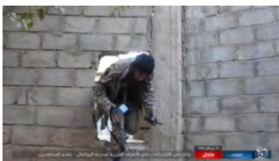
Droite : Un membre de l'Etat islamique armé d'une arme légère et d'un dispositif de communication traverse un trou dans un mur au cours d'affrontements dans la banlieue Ouest d'Abu-Kamal. Gauche : Un membre de l'Etat islamique ouvre le feu (Haqq, 1er décembre 2017)