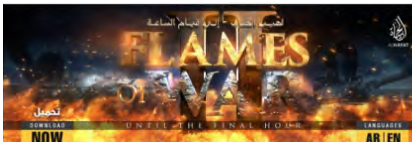
L'affiche de la vidéo intitulée "Flammes de la guerre" (Akhbar al-Muslimeen, 30 novembre 2017)

islamique et de recruter de nouveaux partisans en Occident chargés de continuer le jihad.