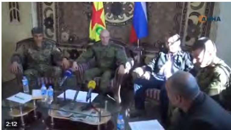
Centre : Le général russe Alexander (Aleksey) Kim au cours de la conférence de presse. Gauche : le porte-parole des YPG Nouredine (Nouri) Mahmoud (Twitter, 4 décembre 2017)

créée, partagée par l'armée russe, les YPG et les représentants des tribus arabes (Twitter, 4 décembre 2017).