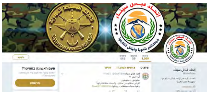
Photo de profil de la page Twitter de l'Union des tribus du Sinaï, montrant l'emblème de l'Union et l'insigne de l'armée égyptienne côte à côte (Compte Twitter de l'Union des tribus du Sinaï, 3 décembre 2017).

personne qui apporte une aide à des éléments terroristes ; l'Union des tribus du Sinaï soutiendra toute personne qui transmettra des informations qui aideront à atteindre des terroristes ; tous les terroristes qui sont impliqués dans des opérations contre les citoyens égyptiens doivent se rendre et accepter la règle de droit, sinon, ils seront condamnés à mort ; l'Union des tribus du Sinaï a demandé à tous les combattants à être prêts à aller au combat (Page Facebook de l'Union des tribus du Sinaï, 30 novembre 2017).