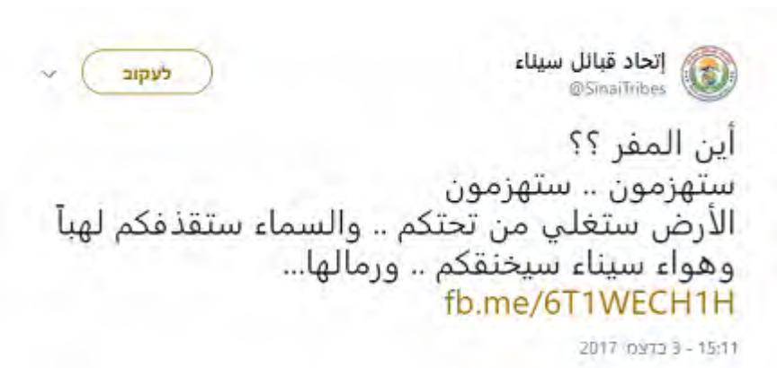
L'Union des tribus du Sinaï promet aux éléments terroristes qu'ils seront vaincus (Compte Facebook de l'Union des tribus du Sinaï, 3 décembre 2017)

◆ Le 3 décembre 2017, l'Union des tribus du Sinaï a publié un commentaire sur Facebook s'adressant aux éléments terroristes [cf., les membres de la Province du Sinaï de l'Etat islamique] : "Où est le refuge ? Vous serez défaits [...] Vous allez être rejetés [...] La terre va bouillir sous vos pieds [...] et le ciel sera mis à feu sur vous, et l'air du Sinaï va vous étouffer [...]"