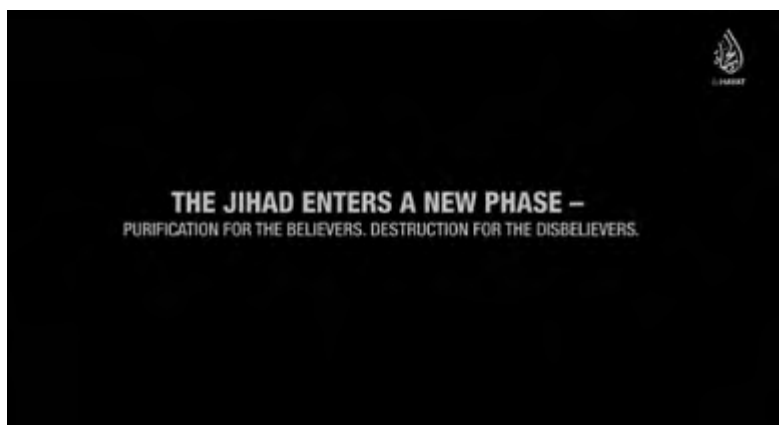
Contenu de la vidéo: "Le jihad entre dans une nouvelle phase - purification pour les croyants, destruction pour les mécréants" (Akhbar al-Muslimeen, 30 novembre 2017)

► La vidéo critique l'administration Trump pour lutter contre les musulmans brutalement et les invite à se battre contre l'organisation. L'orateur note que les meilleurs des croyants n'arrêteront pas de se battre jusqu'à ce qu'ils obtiennent la victoire, même s'ils sont peu nombreux. Ces croyants continueront le jihad tant qu'il y aura des infidèles . Dans la vidéo, un membre de l'Etat islamique en Irak affirme que la disparition des États-Unis est imminente et que les membres de l'organisation lutteront dans les pays sous la protection de l'Amérique (cf., les pays d'Occident). À la fin de la vidéo, un membre de l'Etat islamique (probablement un Américain) déclare : "Ils [Trump et ses hommes] ont dit qu'ils allaient combattre le feu par le feu et donc le califat islamique. Ils ont échoué. Nous sommes les vainqueurs [...]".