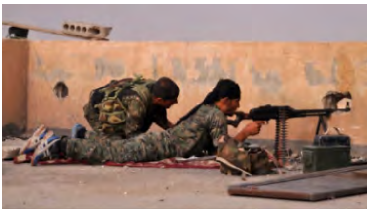
Combattants kurdes des YPG, composant la force dominante des FDS, au cours d'affrontements avec l'Etat islamique sur la rive orientale de l'Euphrate (Twitter, décembre 2017)