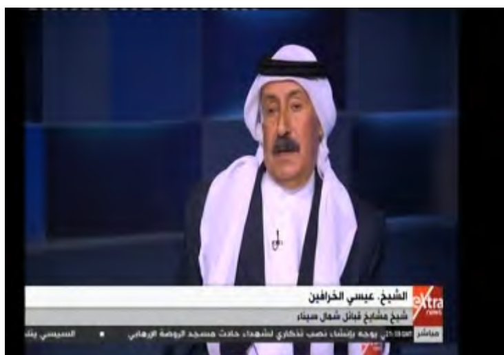
Le cheikh Issa al-Kharafin interviewé par une chaîne égyptienne à la suite de l'attaque terroriste à la mosquée Al-Rawdah (Chaîne eXtra News, Egypte, 25 novembre 2017)

► Le cheikh Issa al-Kharafin , 75 ans, vit du côté égyptien de Rafah. Il est le principal cheikh du Nord de la péninsule du Sinaï et le cheikh de la tribu Al-Rumeilat . En Juillet 2017, il a survécu à une tentative d'assassinat lorsque des hommes masqués ont tiré sept balles dans sa direction. Il est un ancien membre de l'Assemblée du peuple de l'Égypte (la Chambre basse du parlement). Il accorde fréquemment des entrevues aux médias égyptiens.