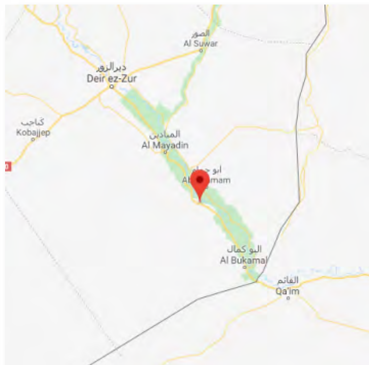
Le village d'Al-Salihyah, où une salle d'opérations doit être installée, partagée par l'armée russe, les YPG et les tribus arabes (en rouge)