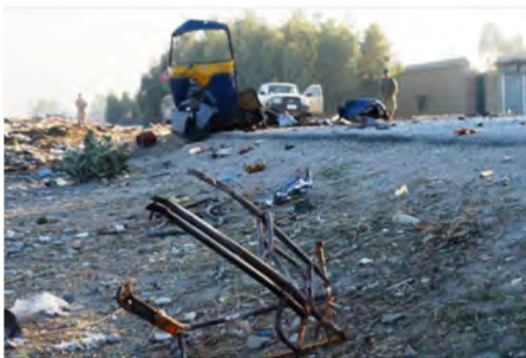
Le lieu de l'attaque à Jalalabad

► L'attentat a tué au moins deux agents de renseignements afghans et blessé 10 policiers, membres des renseignements et civils. Selon Attahullah Khogyani, porte-parole du gouverneur de la province de Nangarhar, l'une des victimes est le directeur du bureau des renseignements de Jalalabad 2 (Site Internet Radio Free Europe ; New York Times, 2 décembre 2017). Il convient de noter que ce n'est pas la première fois que l'Etat islamique cible les médias afghans. 3