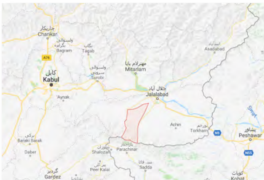
La zone des villages de Khugyani repris par l'Etat islamique (en rouge)

► Le 30 novembre 2017, l'Etat islamique a signalé que, le 24 novembre 2017, ses membres ont repris plus de 18 villages des talibans dans la région de Khugyani . Cette zone est située dans la partie Ouest de la circonscription de Nangarhar dans l'Est de l'Afghanistan, près de la frontière avec le Pakistan (à environ 37 km au Sud-Ouest de Jalalabad). Le rapport de l'Etat islamique énumère les noms des 18 villages repris par ses membres (Akhbar al-Muslimeen et site Internet de partage de fichiers, 1 er décembre 2017, citant le dernier numéro d'Al-Nabā', 30 novembre 2017).