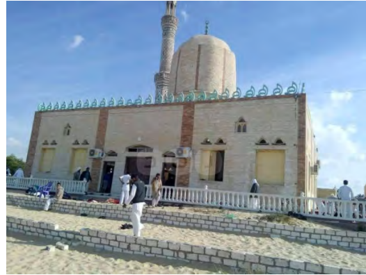
Droite : La mosquée du village d'al-Rawda dans le Nord de la péninsule du Sinaï. Gauche : Les corps de certaines des victimes (Haq, 25 novembre 2017)