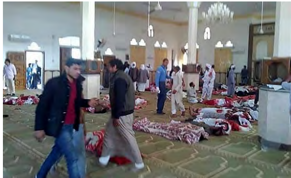
Droite : Les corps de certaines des victimes de l'attaque dans la mosquée d'al-Rawda (Haq, 25 novembre 2017). Gauche : Deux véhicules appartenant à des résidents locaux incendiés par des terroristes de l'Etat islamique (al-Masry al-Youm, 25 novembre 2017)