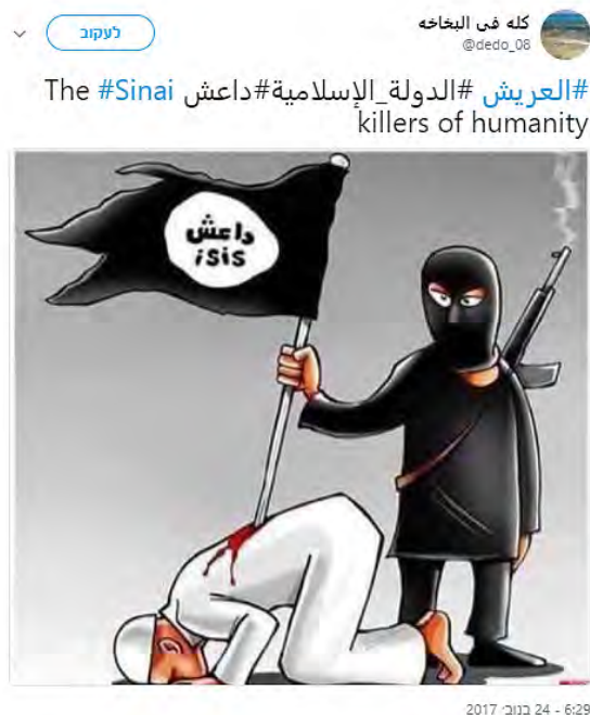
Caricature condamnant l'Etat islamique pour l'attaque (Twitter, 24 novembre 2017)