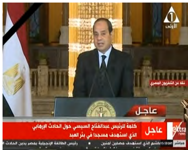
Le Président égyptien Abdel Fattah el- Sisi d'adresse au peuple égyptien après l'attaque contre la mosquée d'al-Rawda (Masr al-Arabiya, 24 novembre 2017)