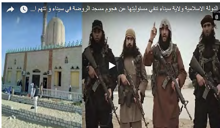
Scène de la vidéo de l'Etat islamique niant l'attaque : "La Province du Sinaï de l'État islamique refuse la responsabilité de l'attaque contre la mosquée al-Rawda dans le Sinaï..." (Haq, 26 novembre 2017)