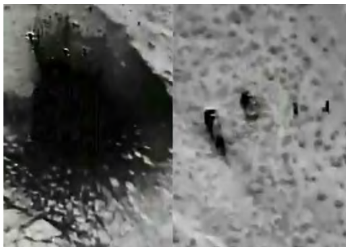
Droite : Deux des véhicules utilisés par les terroristes dans l'attaque contre la mosquée d'Al-Rawda dans le Nord de la péninsule du Sinaï. Gauche : Destruction des deux véhicules

► Par ailleurs, des appareils de l'armée de l'air égyptienne ont attaqué des bases de l'Etat islamique dans le Sinaï. L'armée égyptienne a publié une vidéo montrant la frappe de bases, d'armes et de munitions.