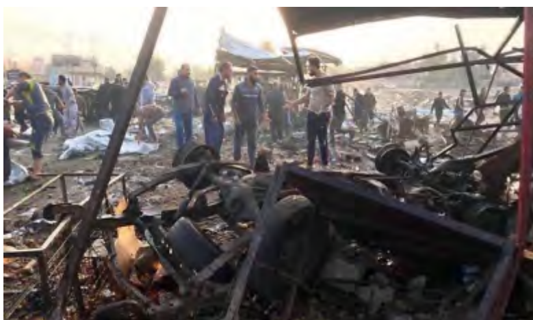
Место взрыва заминированного автомобиля на овощном рынке в г. Тоузхурмату (телеканал "Аль Джазира", 21 ноября 2017 г.)

► 21-го ноября 2017 г. террорист-смертник взорвал заминированный автомобиль на овощном рынке, расположенном в центральной части г. Тоузхумарту, который находится приблизительно в 69 км к югу от г. Киркук 3 . В результате этого теракта было убито не менее 23 человек, а еще 60 человек получили ранения. Большинство убитых – мирные жители. Организация ИГИЛ приняла на себя ответственность за совершение теракта.