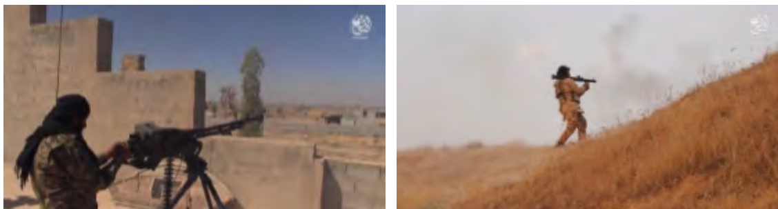
Справа: боевик организации ИГИЛ производит выстрел из РПГ в направлении иракских войск. Слева: боевик организации ИГИЛ ведет огонь из крупнокалиберного пулемета в направлении иракских войск (агентство новостей "Хек"; сайт по обмену файлами, 14 ноября 2017 г.)