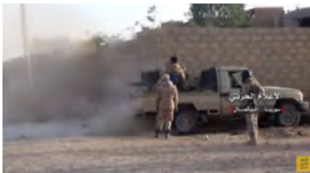
Ведение огня из зенитного орудия калибра 23 мм, установленного в кузове транспортного средства повышенной проходимости (канал Ютуб центрального органа боевой пропаганды организации "Хезболлах", 18 ноября 2017 г.)