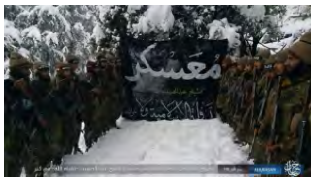
Справа: новые рекруты организации ИГИЛ, которые закончили свой курс подготовки в "лагере имени шейха Абеда Аль Хасиба". Слева: новые рекруты организации ИГИЛ в ходе тренировок по ведению стрельбы в позиции "с колена". На заднем плане виден флаг организации ИГИЛ (агентство новостей "Хек", 20 ноября 2017 г.)