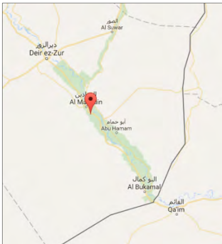
Село Михкан, которое находится поблизости от маршрута, соединяющего города Дир Аль Зур и Аль Абу Кемаль (Google Maps)

► 15-го ноября 2017 г, организация ИГИЛ опубликовала снимки, на которых видны ее боевики, находящиеся в готовности на боевых и наблюдательных позициях, расположенных в районе села Михкан , которое находится приблизительно в 4 км к югу от г. Аль Миадин (поблизости от маршрута, соединяющего города Дир Аль Зур и Аль Абу Кемаль). Видно, что один из боевиков организации ИГИЛ ведет наблюдение после стрельбы из крупнокалиберного пулемета, установленного на мотоцикле (относительно небольшая мобильная платформа, обнаружение которой является затруднительным и поэтому – подходящая для применения в партизанских вылазках). Другой боевик снят ведущим огонь из зенитного орудия, установленного в кузове транспортного средства повышенной проходимости, а третий – на снайперской позиции (агентство новостей "Хек", 15 ноября 2017 г.).