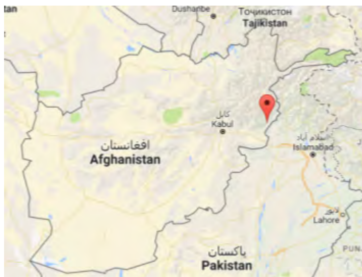
Провинция Кунар (обозначена красным значком)