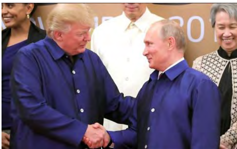
Встреча Трампа и Путина в ходе конференции АРЕС (сайт Кремля, 10 ноября 2017 г.)

► Кроме того, в своем совместном заявлении президенты подчеркнули, что военного решения для ситуации в Сирии не существует . Они обратились ко всем сторонам, имеющим отношение к данному вопросу, с призывом принять участие в политическом процессе , который будет опираться на резолюцию № 2254 Совета Безопасности ООН и на процесс в Женеве. Президенты также выразили свою обязанность по сохранению районов, свободных от эскалации, в Сирии и заверили своими подписями принципиальную договоренность, которая была подписана 8-го ноября 2017 г. в Амана между Россией, США и Иорданией по вопросу снижения уровня эскалации в южной части Сирии (сайт гос. департамента США и сайт Кремля, 11 ноября 2017 г.).