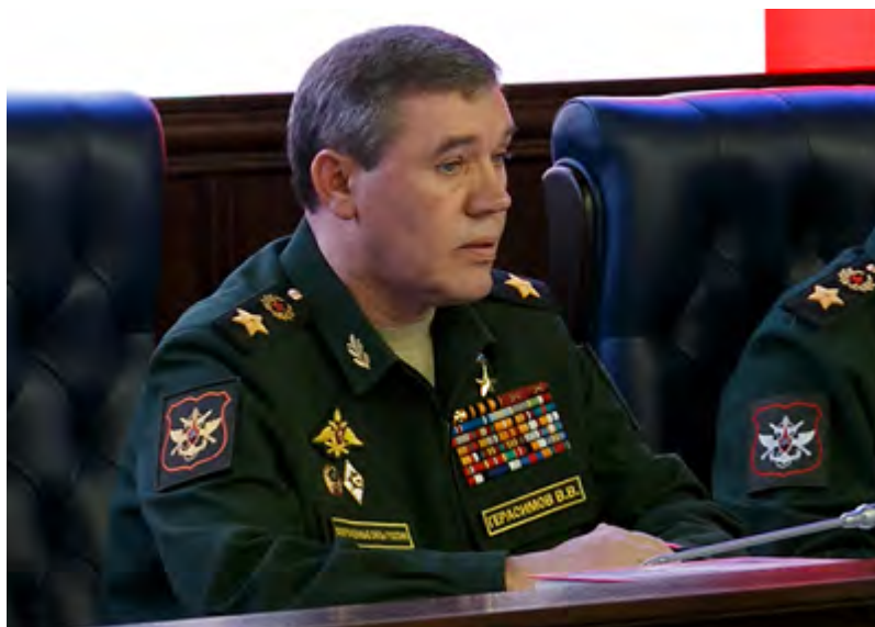
Валерий Герасимов произносит речь перед сотрудниками министерства обороны России

только переломить ход боевых действий в пользу сирийских правительственных войск, но также и уничтожить большое количество боевиков террористических организаций и освободить некоторые ключевые населенные пункты. В общей сложности было освобождено свыше 1000 населенных пунктов и было уничтожено 54000 боевиков террористических организаций (в том числе и около 2800 уроженцев России и 1400 выходцев из стран СНГ).