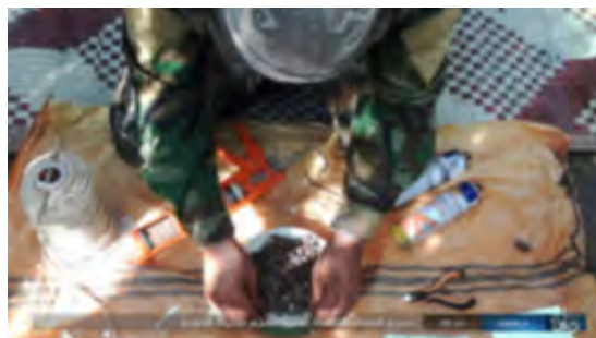
Справа: изготовление взрывного устройства – этап № 7. Слева: 5 взрывных устройств, готовых к применению (агентство новостей "Хек", 13 ноября 2017 г.)