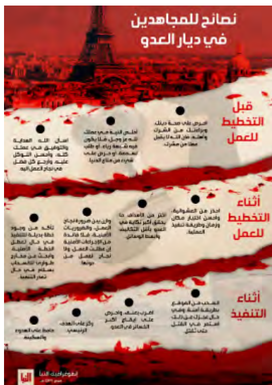
Листовка организации ИГИЛ под заголовком "Советы для воинов джихада на территории врага". В верхней части листовки изображен фрагмент Эйфелевой башни и ее окрестностей