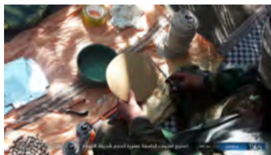
Справа: изготовление взрывного устройства – этап № 1. Слева: изготовление взрывного устройства – этап № 5 (агентство новостей "Хек", 13 ноября 2017 г.)