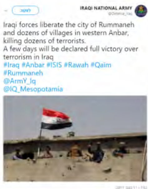
Сообщение иракской армии о захвате г. Рамана и десятков деревень, расположенных в западной части провинции Аль Анвар (аккаунт Твиттер IRAQI NATIONAL ARMY@Defense_Iraq, 11 ноября 2017 г.)