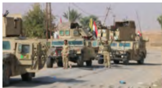
Иракские войска в районе г. Аль Рамана (телеканал "Аль Сумария ньюз", 12 ноября 2017 г.)