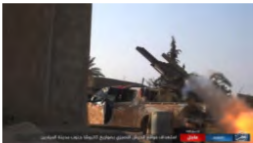
Боевики организации ИГИЛ производят запуски ракетных снарядов в направлении позиций сирийской армии, расположенных к югу от г. Аль Миадин (агентство новостей "Хек", 9 ноября 2017 г.)

► 13-го ноября 2017 г. террорист-смертник организации ИГИЛ, чеченского происхождения, взорвал заминированный автомобиль на въезде на военный аэродром в г. Дир Аль Зур. После этого на территорию аэродрома прорвались на автомобиле 5 боевиков организации ИГИЛ, также чеченского происхождения, которые были одеты в военную форму российского образца. Они вышли из автомобиля и открыли беспорядочную стрельбу во всех направлениях. В ходе завязавшейся перестрелки боевики были уничтожены, однако один из них успел привести в действие пояс со взрывчаткой, который был надет на его тело. Поступило сообщение о том, что не менее 13 сирийских и российских военнослужащих было убито в