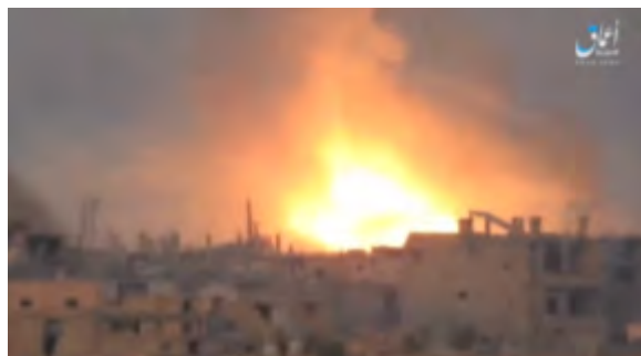
Справа: нанесение удара с воздуха по стадиону г. Дир Аль Зур. Слева: вид на стадион после нанесения удара с воздуха