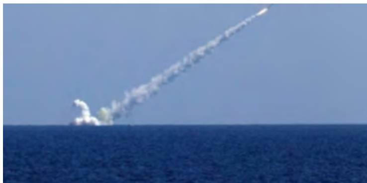
Запуск крылатой ракеты модели "Калибр" с российской подводной лодки (агентство новостей САНА, 31 октября 2017 г.)

► 31-го октября 2017 г. российская подводная лодка "Великий Новгород" выпустила 3 крылатых ракеты модели "Калибр" в направлении объектов организации ИГИЛ, расположенных в районе г. Абу Кемаль. В результате этого обстрела были уничтожены командные пункты, укрепления, скопления боевиков, бронированные транспортные средства и склады военного снаряжения организации ИГИЛ (агентство новостей САНА, со ссылкой на министерство обороны России, 31 октября 2017 г.).