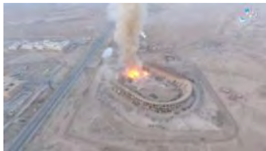
Нанесение удара с воздуха по стадиону г. Дир Аль Зур, на котором был размещен склад боеприпасов сирийской армии (агентство новостей "Хек"; сайт по обмену файлами, 30 октября 2017 г.)