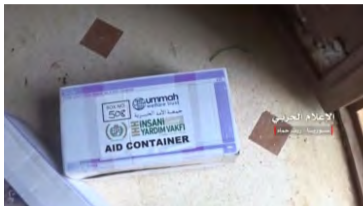
Фото комплекта гуманитарной помощи, найденного в одном из транспортных средств группировки "Штаб по освобождению Аль Шаам", поврежденном огнем сил сирийской армии в ходе боев в сельской местности, расположенной к северо-востоку от г. Аль Хама. На упаковке комплекта изображены 2 логотипа: благотворительного фонда "Аль Умма" и турецкой организации ИНН (снимок был получен из органа боевой пропаганды сирийской армии и опубликован, среди прочего, на аккаунте Твиттер органа боевой пропаганды организации "Хезболлах", 29 октября 2017 г.)