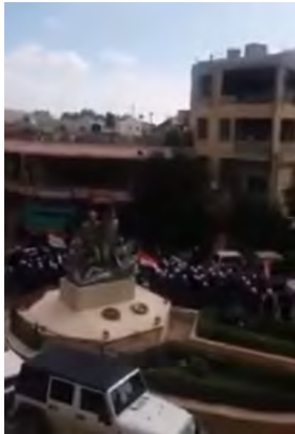
مظاهرات تأييد الدروز للنظام السوري في قرية حضر (حساب يوتيوب SABEELable، 3 تشرين الثاني/ نوفمبر 2017).

◀ في 3 تشرين الثاني/ نوفمبر 2017 تم نشر شريط مصور يظهر فيه دروز أثناء مظاهرة تأييد للنظام السوري في قرية حضر. وردد المتظاهرون هتافات مؤيدة للرئيس بشار الأسد "بالروح بالدم نفديك يا بشار" (يوتيوب SABEELable، 3 تشرين الثاني/ نوفمبر 2017).