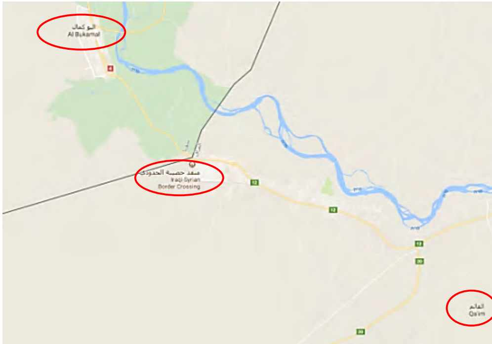
معبر حُصْبِيَّة الحدودي (في المركز) الذي احتله الجيش العراقي.

أعلن الجيش العراقي أن قواته قد احتلت كذلك معبر حُصْبِيَّة الحدودي (Husybah)، إلى الشمال الغربي من القائم (حساب تويتر IRAQI NATIONAL ARMY@Defense_Iraq، 3 تشرين الثاني/ نوفمبر 2017). وعلاوة على ذلك وبعد احتلال القائم توجه الجيش العراقي لاحتلال راوه، إلى الغرب من القائم، لاستكمال احتلال معازل تنظيم الدولة الإسلامية في المنطقة (الشرق الأوسط، 6 تشرين الثاني/ نوفمبر 2017).