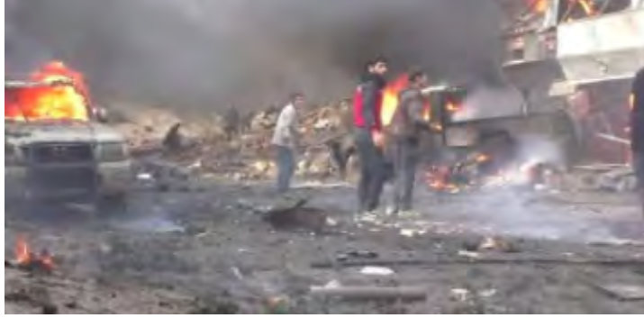
مسرح تفجير سيارة تنظيم الدولة الإسلامية الملغمة وسط تجمع من النازحين إلى الشرق من دير الزور (التلفزيون السوري، 5 تشرين الثاني/ نوفمبر 2017).

◀ لم تلاحظ في صفوف مقاتلي تنظيم الدولة الإسلامية مقاومة منظمة ومنهجية للقوات السورية في دير الزور وفي محيطها. في 4 تشرين الثاني/ نوفمبر 2017 أفادت التقارير عن مقتل أكثر من مائة شخص وجرح عدد كبير جراء تفجير سيارة ملغمة لتنظيم الدولة الإسلامية استهدفت تجمعاً للنازحين الفارين من دير الزور على الجانب الشرقي من نهر الفرات (الميادين، 4 تشرين الثاني/ نوفمبر 2017). ومن جملة القتلى عدد كبير من النساء والأطفال (التلفزيون السوري، 5 تشرين الثاني/ نوفمبر 2017).