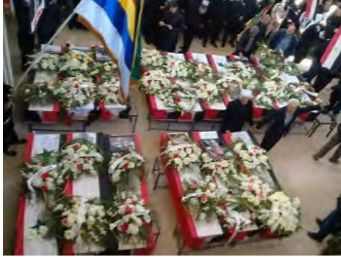
توابيت القتلى الـ 16 جراء تفجير السيارة الملقمة في قرية حضر الدرزية (حساب تويتر @lamloma3، 5 تشرين الثاني/ نوفمبر 2017).