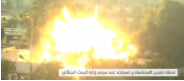
لحظة تفجير سيارة تنظيم الدولة الإسلامية الملغمة في مبنى مديرية البحث الجنائي التابعة لوزارة الداخلية اليمنية في عدن (حساب تويتر هلا@Shk39s، 5 تشرين الثاني/ نوفمبر 2017).

◀ في 5 تشرين الثاني/ نوفمبر 2017 أعلن تنظيم الدولة الإسلامية عن مقتل 69 عنصراً من قوات الأمن اليمنية في هجوم نفذته مقاتلو التنظيم في عدن. قام مقاتلو من تنظيم الدولة الإسلامية في ساعات الصباح بهجوم على مبنى مديرية البحث الجنائي التابعة لوزارة الداخلية اليمنية. قام إرهابي من تنظيم الدولة الإسلامية بقيادة سيارة ملغمة واقتحم بها البوابة الرئيسية للمديرية أثناء إجراء الطابور الصباحي وقام بتفجيرها. أسفر التفجير عن مقتل 29 شخصاً. ومن ثم قام ثلاثة إرهابيون آخرون باقتحام بناية مديرية التحقيق الجنائي وقتلوا 21 ضابطاً وإدارياً. قامت قوات الأمن اليمنية بإرسال تعزيزات على موقع العملية وخلال الاشتباكات بين الأطراف قام أحد الإرهابيين من تنظيم الدولة الإسلامية بتفجير ستره ناسفة كان يرتديها وتسبب بمقتل وجرح أكثر من ثلاثين عنصراً من قوات الأمن اليمنية. واستمرت المواجهات بين الأطراف حوالي 11 ساعة (حساب تويتر هلا@Shk39s، 5 تشرين الثاني/ نوفمبر 2017).