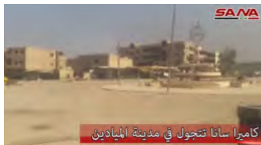
Кадры из ролика. Справа: центральная площадь г. Аль Миадин. Слева: частично разрушенная улица в г. Аль Миадин (канал Ютуб агентства новостей САНА, 21 октября 2017 г.)