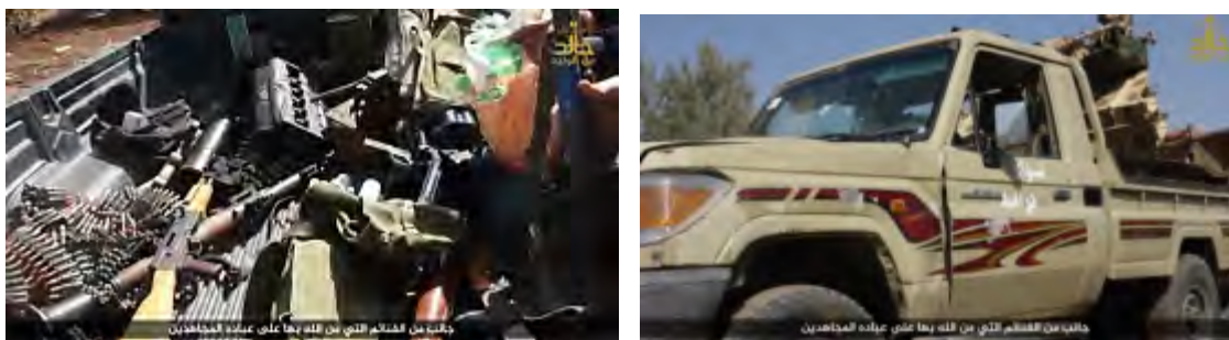
Справа: транспортное средство повстанцев, захваченное боевиками группировки "Армия Халеда Бин Аль Валида" в сельской местности, расположенной к северо-западу от г. Дерра. Слева: оружие и военное снаряжение, захваченное боевиками группировки "Армия Халеда Бин Аль Валида" (агентство новостей "Аль Суарам", 20 октября 2017 г.)

Валида", в сельской местности, расположенной к северо-западу от г. Дерра. Боевики группировки "Армия Халеда Бин Аль Валида" захватили в качестве трофеев некоторое количество оружия и военного снаряжения (агентство новостей "Хек", 20 октября 2017 г.).