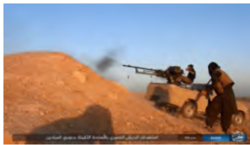
Столкновения между боевиками организации ИГИЛ и силами сирийской армии к югу от г. Аль Миадин (агентство новостей "Хек", 20 октября 2017 г.)

► Сирийцы опубликовали ролик, в котором запечатлено большое количество вооружения и военного снаряжения, обнаруженного после захвата г. Аль Миадин. Среди трофейного оружия: пулеметы, крупнокалиберные зенитные пулеметы, ручные зенитно-ракетные пусковые установки, безоткатные артиллерийские орудия модели SPG-9, полевые артиллерийские орудия калибром 155 мм, танки, а также бронированный заминированный автомобиль собственного изготовления организации ИГИЛ. Кроме того, в ролике сняты беспилотные летательные аппараты и