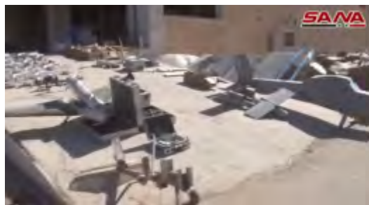
Беспилотные летательные аппараты и дроны организации ИГИЛ, обнаруженные силами сирийской армии в г. Аль Миадин (канал Ютуб агентства новостей САНА, 19 октября 2017 г.)

► Кроме того, сирийцы опубликовали еще один ролик, запечатлевший ситуацию в г. Аль Миадин после его захвата. В ролике сняты в основном здания, использовавшиеся организацией ИГИЛ в качестве правительственных учреждений. Среди прочего, в ролике сняты: центральная площадь города; школа "Абен Тимия", которая работала под руководством бюро образования (диван аль талим) организации ИГИЛ; центральный рынок; "медиа-центр", в котором расположены сидения и экран, по которому, судя по всему, для посетителей демонстрировались пропагандистские ролики организации ИГИЛ (канал Ютуб агентства новостей САНА, 21 октября 2017 г.). В ходе просмотра этого ролика можно заметить, что, по сравнению с другими городами в Сирии, которые были освобождены из-под контроля организации ИГИЛ, масштаб разрушений в г. Аль Миадин не так велик, судя по всему, благодаря скорости завершения операции по захвату города.