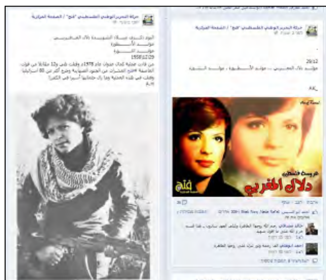
Листовка, опубликованная на странице Фейсбук бюро вербовки и логистики организации ФАТХ, ко дню рождения террористки Делаль Аль Муграби (официальная страница Фейсбук бюро вербовки и логистики организации ФАТХ, 26 декабря 2013 г.)