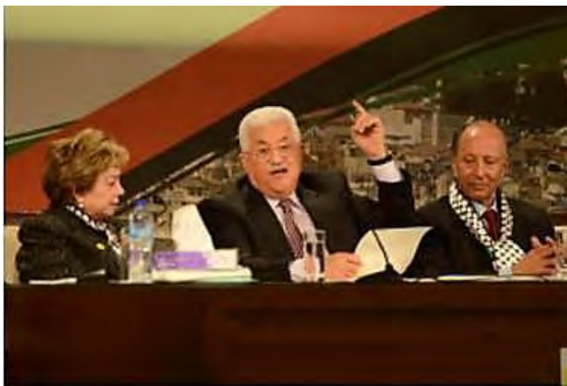
Речь Махмуда Аббаса при открытии 7-й конференции организации ФАТХ в г. Рамалла, в ходе которой была вновь утверждена стратегия "народного сопротивления" (агентство новостей ВАФА, 30 ноября 2016 г.)

► Террор и насилие, в их нынешней форме, а также безудержное подстрекательство, сопровождающее их, представляют собой непосредственный результат стратегического политического решения, которое было принято 8 лет назад в ходе 6-й конференции организации ФАТХ (в августе 2009 г.) 2 . В ходе этой конференции была принята стратегия "народного сопротивления" (то есть, "народного" террора), которая, начиная с этого момента времени и до сегодняшнего дня, применяется Палестинской автономией и организацией ФАТХ . Данная стратегия была вновь утверждена в ходе 7-й конференции организации ФАТХ , которая состоялась в г. Рамалла (29 ноября – 21 декабря 2016 г.), путем принятия решения об усилении и укреплении "народного сопротивления" 3 .