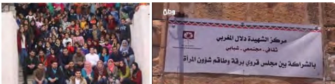
Справа: культурный и общественный центр для женщин, носящий имя Делаль Аль Муграби, в деревне Бараке (телеканал "Ватан", 1 июня 2017 г.). Слева: активисты центра и подростки принимают участие в программах, которые он проводит (газета "Мадар ньюз", 31 мая 2017 г.)

церемонии открытия центра одна из депутаток местного совета деревни отметила, что он будет фокусировать свою работу на изучении истории борьбы шахидки Делаль Аль Муграби и ее представлении перед группами подростков (агентство новостей МААН, 15 мая 2017 г.). Европейские правительства, которые финансировали этот проект, объявили, 21-го августа 2017 г., что они прекратят его финансирование и начнут расследование путей использования денежных средств, которые в прошлом предоставлялись женской анти-израильской организации WATC, которая оказывала помощь в создании этого центра в деревне Бараке 9 .