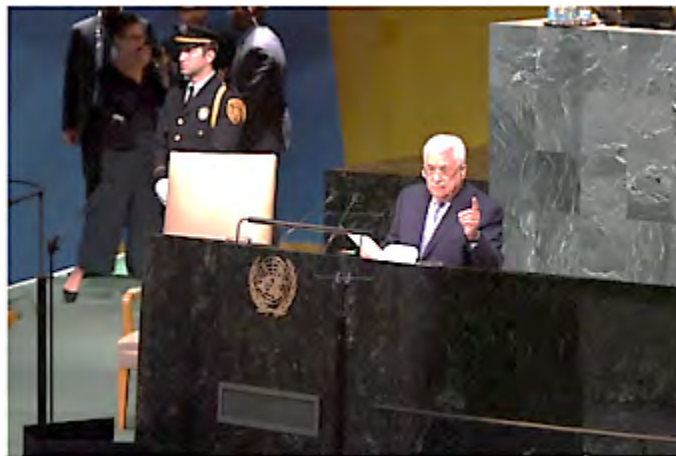
Махмуд Аббас произносит речь в ходе заседания Ген. Ассамблеи ООН в Нью Йорке: "мы не пойдем по пути террора и насилия ... " (21 сентября 2017 г.)

► Действительно ли Палестинская автономия на самом деле выступает против террора в любой его форме? Действительно ли "народный" террор ("народное сопротивление") ведется без применения насилия и мирными методами? "Народный террор, который пользуется поддержкой со стороны Палестинской автономии, как уже было указано выше, теракты с применением огнестрельного и холодного оружия, транспортные теракты, так же, как и метание камней и бутылок с зажигательной смесью, ни в коем случае не могут соответствовать определению "народного сопротивления", которое ведется мирными методами и без применения насилия. Этот террор собрал, начиная с возникновения волны "народного" террора в октябре 2015 г., и до сегодняшнего дня, кровавую жатву в виде жизней 59 израильтян. К этому числу следует прибавить еще 50 погибших , которые были убиты с момента принятия решения о ведении народного сопротивления, в ходе 6-й конференции организации ФАТХ (август 2009 г.) и до сентября 2015 г. Общее число израильтян, которые были убиты в результате "народного" террора за 8 лет, прошедших с того момента, составляет 109 человек. Большинство из них – гражданские лица, и лишь немногие – служащие сил безопасности Израиля.