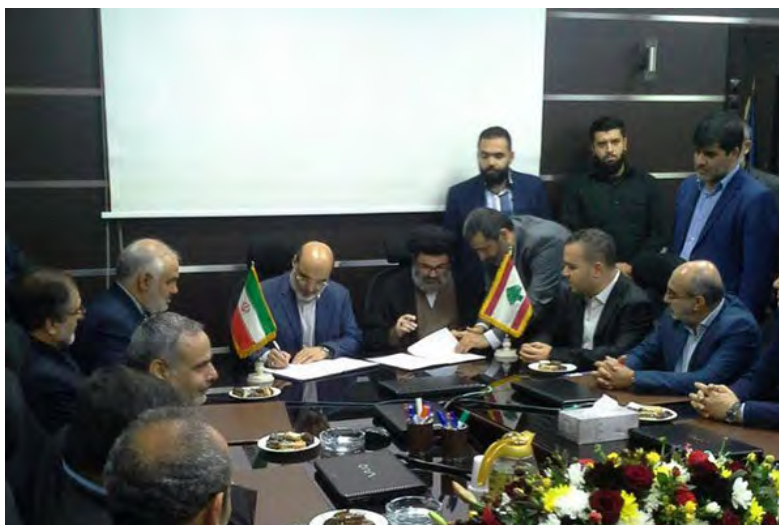
מנכ"ל IRIB ובכיר חזבאללה חותמים על מזכר ההבנה (טהראן טיימס, 17 באוקטובר 2017).