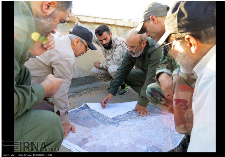
באקרי מבקר בחזית הלחימה באזור חלב (אירנ"א, 20 באוקטובר 2017).

◀ בפגישתו עם הנשיא אסד העביר באקרי לנשיא סוריה איגרת אישית ממנהיג איראן, עלי ח'אמנהאי. במהלך שהותו בסוריה ביקר באקרי גם בחלב וסייר בחזיתות הלחימה באזור הכפרי הדרומי של חלב ובאזור לאד'קיה. בפגישה עם לוחמים באזור אמר רמטכ"ל איראן, כי האחדות, הסולידריות והאמונה בקרב לוחמי "חזית ההתנגדות" הן שהובילו להצלחה ולניצחונות במאבק נגד הטרוריסטים (איסנ"א, 20 באוקטובר 2017).