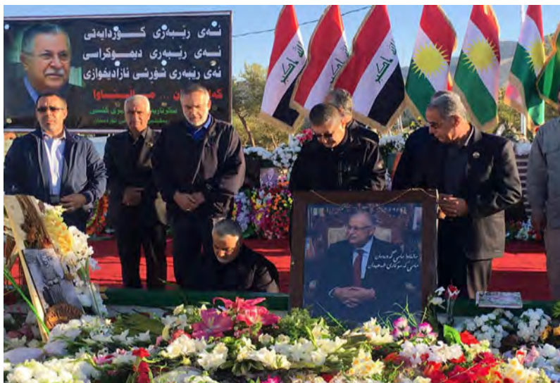
קאסם סלימאני לצד קברו של ג'לאל טאלבאני (משרק ניוז, 14 באוקטובר 2017).

◀ על רקע נסיגת הכוחות הכורדים מכרכוכ פרסם חבר הפרלמנט העיראקי הכורדי, מסעוד חידר ( Masoud Haydar), פרטים אודות הסכם, שהושג בין באפל טאלבאני מהאיחוד הפטריוטי הכורדי ( PUK) והאדי אלעאמרי, ראש ארגון בדר וממפקדי המיליציות השיעיות העיראקיות, בתיווכו של מפקד כוח קדס של משמרות המהפכה, קאסם סלימאני, ובפיקוח ראש ממשלת עיראק, חידר אלעבאדי, לאחר משאל העם על עצמאות החבל הכורדי.