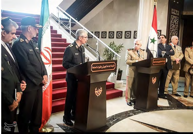
רמטכ"ל איראן באקרי במסיבת עיתונאים בדמשק עם עמיתו הסורי (תסנים, 18 באוקטובר 2017).

◀ בפגישתו עם הנשיא אסד העביר באקרי לנשיא סוריה איגרת אישית ממנהיג איראן, עלי ח'אמנהאי. במהלך שהותו בסוריה ביקר באקרי גם בחלב וסייר בחזיתות הלחימה באזור הכפרי הדרומי של חלב ובאזור לאד'קיה. בפגישה עם לוחמים באזור אמר רמטכ"ל איראן, כי האחדות, הסולידריות והאמונה בקרב לוחמי "חזית ההתנגדות" הן שהובילו להצלחה ולניצחונות במאבק נגד הטרוריסטים (איסנ"א, 20 באוקטובר 2017).