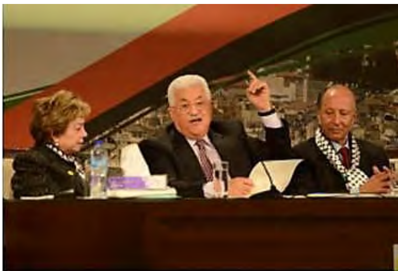
נאום הפתיחה של אבו מאזן בוועידה השביעית של פתח בראמאללה, אשר שבה ואשררה את אסטרטגיית "ההתנגדות העממית" (ופא, 30 בנובמבר 2016).

◀ הטרור והאלימות במתכונתם הנוכחית, וההסתה הקשה הנלווית אליהם, הינם פועל יוצא מהחלטה מדינית אסטרטגית, שהתקבלה לפני שמונה שנים בוועידה השישית של פתח (אוגוסט 2009) 2 . ועידה זאת אימצה אסטרטגיה של "התנגדות עממית" (קרי, טרור עממי), שמאז ועד היום ממומשת בשטח ע"י הרשות הפלסטינית ופתח . אסטרטגיה זאת שבה ואושררה בוועידה השביעית של פתח , שהתקיימה בראמאללה (29 בנובמבר-21 בדצמבר 2016), אשר החליטה לבסס ולחזק את "ההתנגדות העממית" 3 .